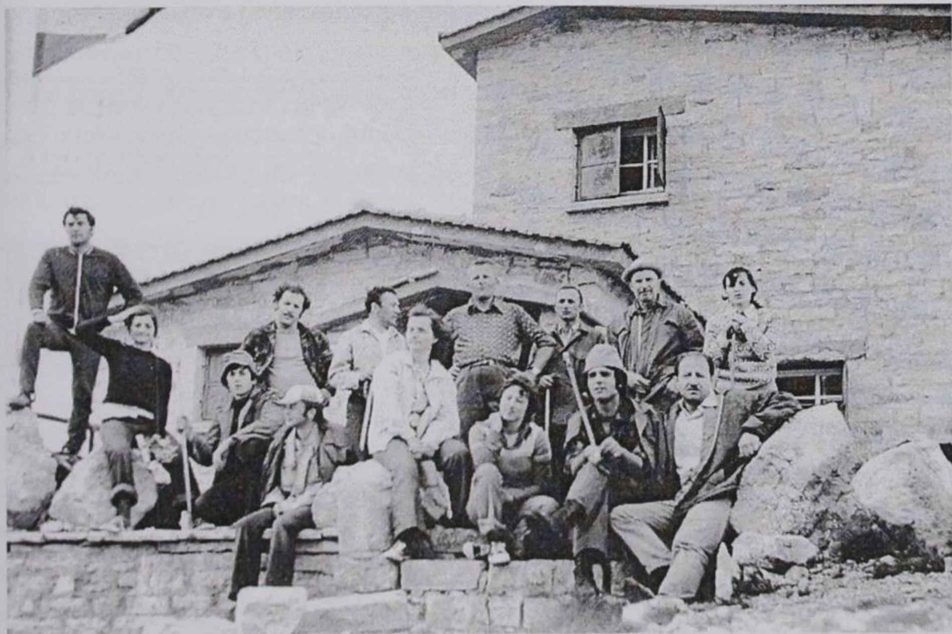
Ο Ορειβατικός Σύλλογος Κόνιτσας στο καταφύγιο «Αστράκας».

Τώρα που τα δημοσίευσα αυτά, φο- βάμαι πως αν με ξαναδούν να κρατάω σημειώσεις, θα με πετάξουν απ' το λεω- φορείο.