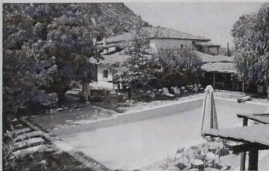
ΞΕΝΟΔΟΧΕΙΟ «Το Γεφύρι» Με 40 κλίνες, εστιατόριο, μπάρ, θέρμανση, πάρκιγκ κλπ. Στην ειδυλλιακή τοποθεσία της γέφυρας Αώου στην Κόνιτσα Τηλ. 26550 23780