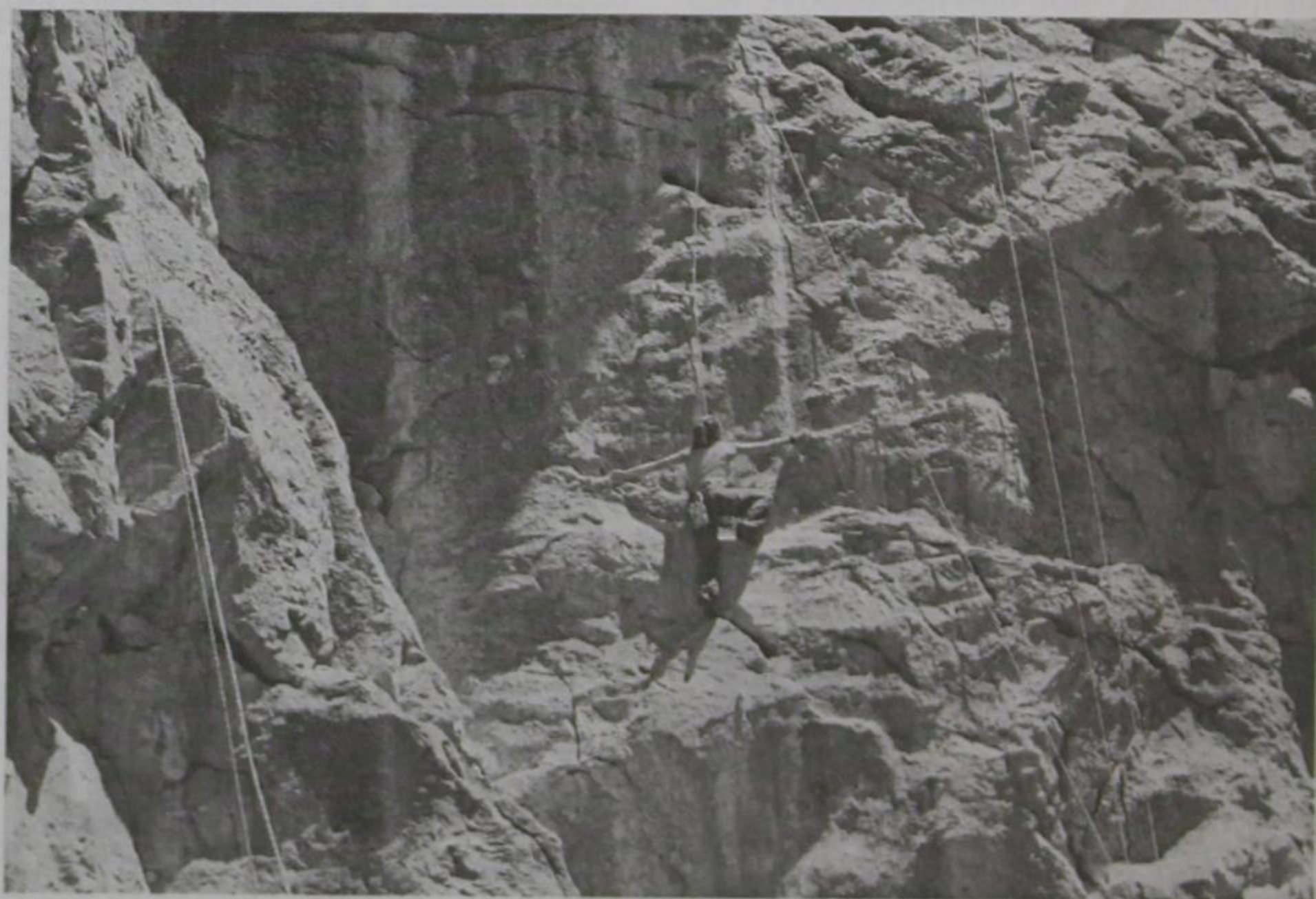
Στο αναρριχητικό πεδίο Πάδων «STOGI» (Stogi στη βλάχικη = βράχοι μαζεμένοι ο ένας κοντά στον άλλο)