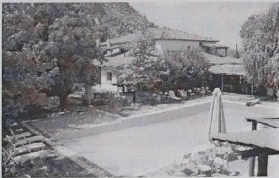
ΞΕΝΟΔΟΧΕΙΟ «Το Γεφύρι» Με 40 κλίνες, εστιατόριο, μπάρ, θέρμανση, πάρκιγκ κλπ. Στην ειδυλλιακή τοποθεσία της γέφυρας Αώου στην Κόνιτσα Τηλ. 26550 23780