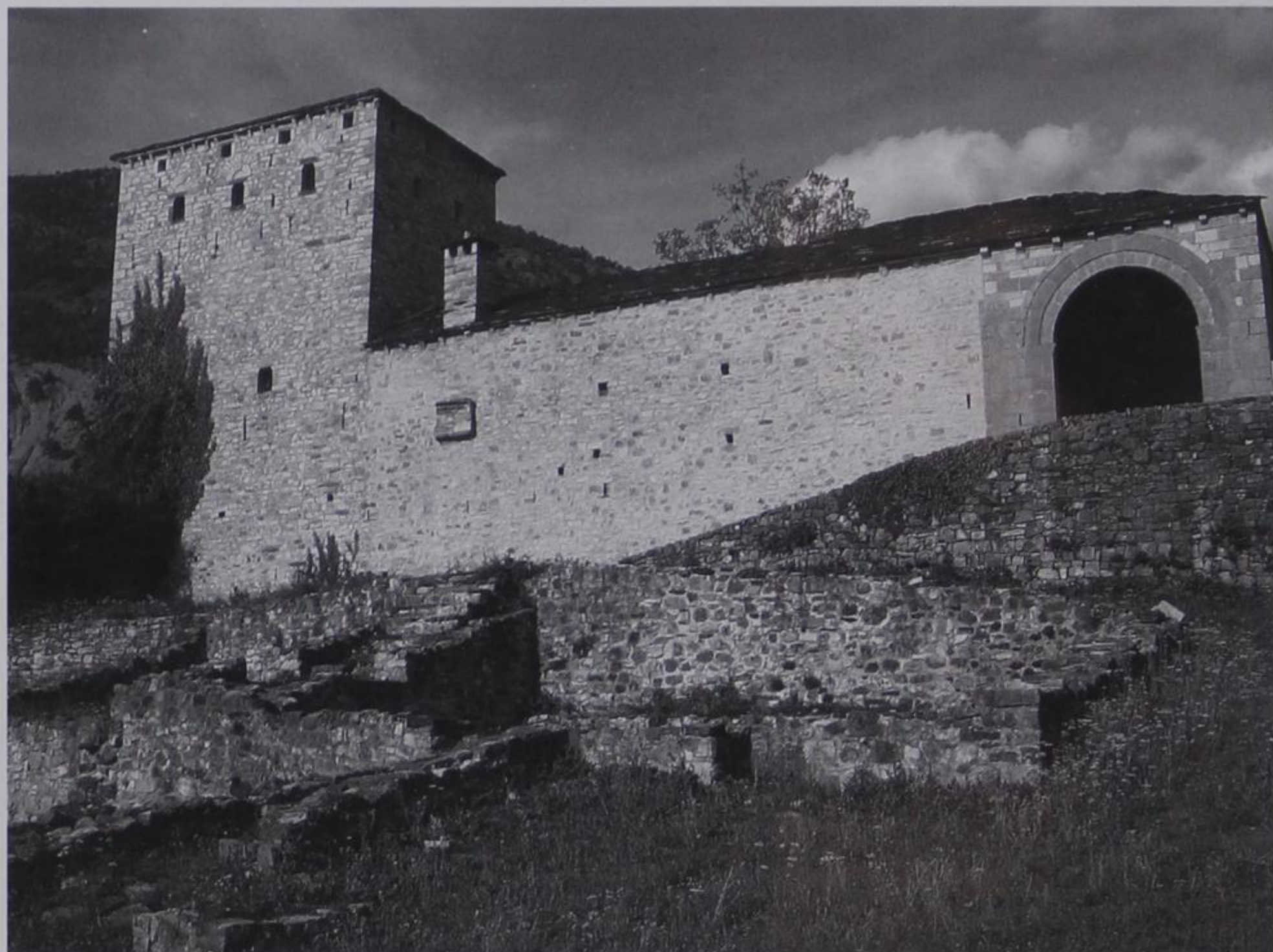
Το αρχοντικό της Χάρκως,

ΥΠΟΔ.1031 ΚΑΥ.25.90.09.0010 ΕΠΙΣΤΡΟΦΗ / RETOUR