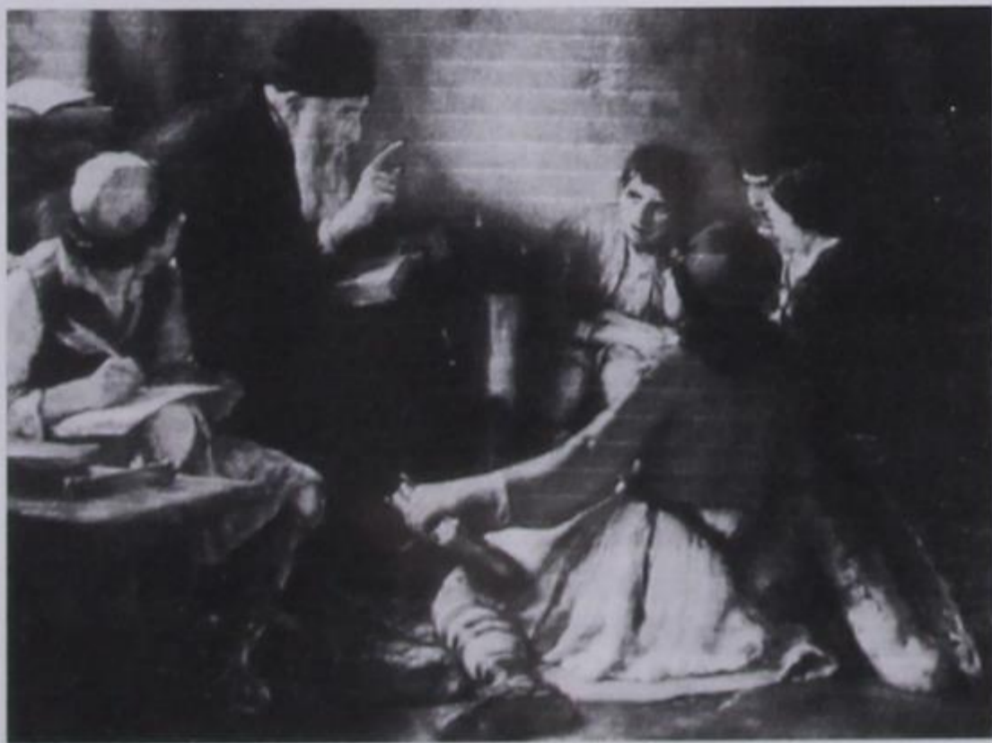
Το κρυφό σχολειό (έργο του Γ. Γύζη).

[Θέλω σε παρένθεση να σημειώσω, ότι μεταξύ των προνομίων που δόθηκαν στους Έλληνες μετά την άλωση της Πόλης, ήταν η διατήρηση της παιδείας των. Αλλ' αυτό στην μακρόχρονη δουλεία δεν εφαρμόστηκε και μάλιστα σε όλες τις περιοχές της υπόδουλης χώρας. Όταν μάλιστα βρέθηκαν άξεστοι σουλτάνοι έθεσαν υπό διωγμό την παιδεία και ασφαλώς τότε λειπούργησαν τα κρυφά σχολεία και η προσφορά τους στη διάσωση της Θρησκείας και της γλώσσας ήταν ανυπολόγιστη], Αλλ' εκείνο, που έγινε αφορμή για ανιστόρητη κριτική, είναι η ανήκουστη θεωρία περί του χορού του Ζαλόγγου. Επειδή τα πρώτα χρόνια της θητείας μου τα υπηρέτησα στη Λάκα Σούλι και μάλιστα εκεί με βρήκε