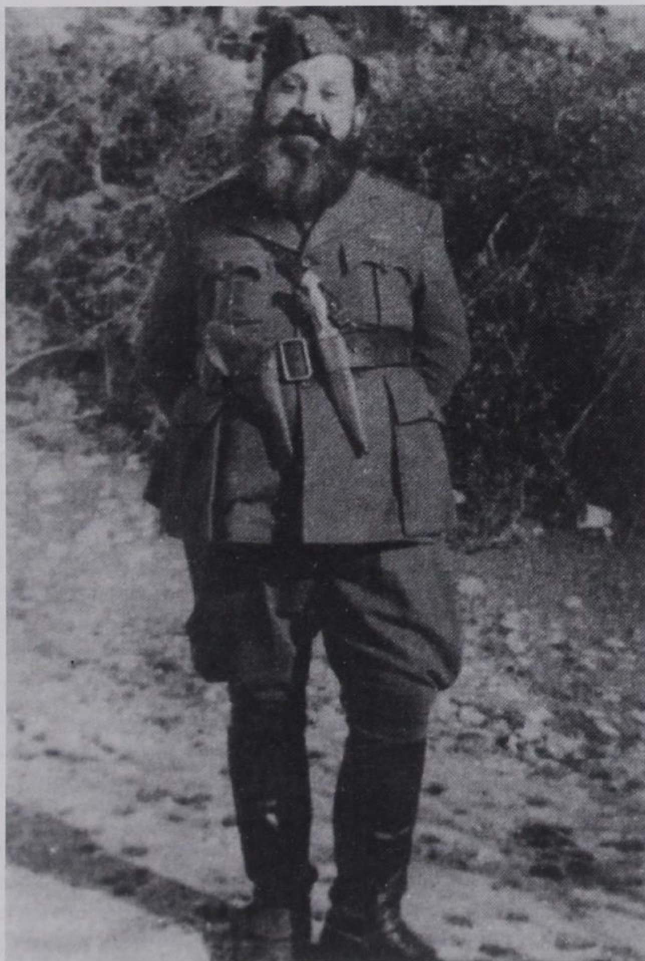
Ο στρατηγός Ναπολέων Ζέρβας