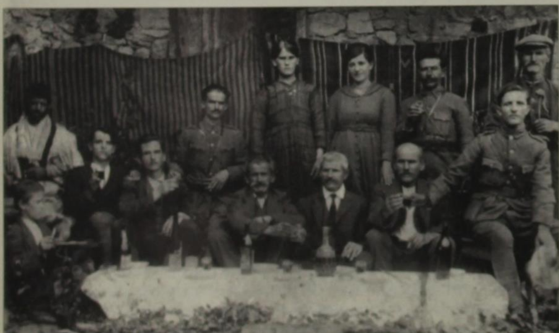
Αρχές δεκαετίας του '20.

Τη σημερινή εποχή, που η εγκατάλειψη των χωριών μας και η ερείπωση των σπιτιών είναι ένα σύνηθες φαινόμενο, δεν πρέπει να μας φαίνεται καθόλου παράξενο το πώς εξαφανίστηκαν ή μετατράπηκαν σε ένα σωρό χαλάσματα και οι μύλοι του χωριού, κτίρια που κάποτε έπαιξαν σπουδαίο και πρωτεύοντα ρόλο στην οικονομία του χωριού, συμβάλλοντας ουσιαστικά στην εξασφάλιση της διατροφής, που για τις μικρές κοινωνίες των ορεινών όγκων της πατρίδας μας, εκείνη την εποχή, ήταν κυρίαρχο μέλημα, ένας διαρκής αγώνας ζωής.