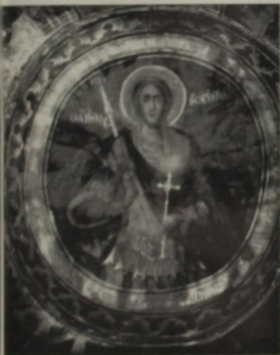
Μικρός τοιχογραφικός τρούλος με τον Αγ. Γεώργιο.

Η Κλεισούρα είναι ένα μικρό χωριό του νομού Πρέβεζας. Παλιότερα υπάγονταν στην κοινότητα Μουζακαίικα της επαρχίας Νικοπόλεως και Πάργας. Σήμερα αποτελεί δημοτικό διαμέρισμα του δήμου Φαναρίου με έδρα το Καναλάκι. Βρίσκεται σε υψόμετρο 60 μέτρων.