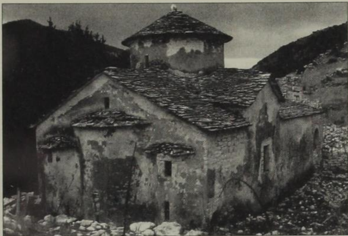
Μία από τις εκκλησίες που διασώθηκαν στη Β. Ήπειρο. Μονή Ντρού-νου, Ζερβάτι Δρόπολης. Από το βιβλίο του Γ. Γιακουμή, Ορθόδοξα μνημεία στη Βόρειο Ήπειρο.

(με 62 ονόματα), που δίνει ο γνωστός λαογράφος Κίτσος Μακρής στο έργο του «Χιονιαδίτες ζωγράφοι» (1981), θα πρέπει να αυξηθεί με τουλάχιστον πέντε ονόματα (και λέμε «τουλάχιστον», διότι μόνο γι' αυτούς μπορούμε να μιλήσουμε με απόλυτη βεβαιότητα, ενώ για την εξακρίβωση της ταυτότητας κάποιων άλλων είναι αναγκαίες επιτόπιες έρευνες προς μελέτη του ύφους τους,