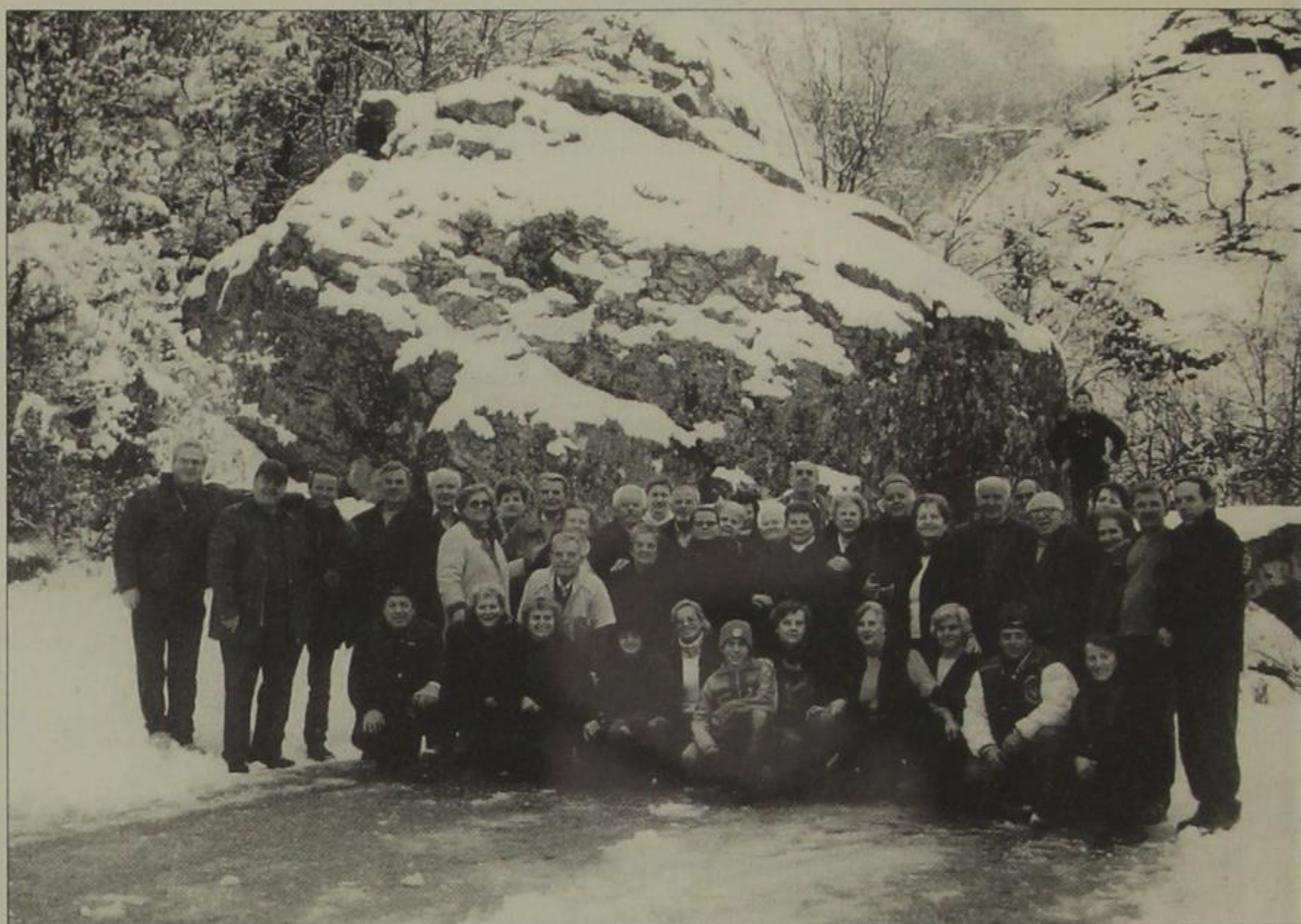
Εκδρομείς για τη γιορτή του Αγίου Αθανασίου. 19 Ιανουαρίου 2003.