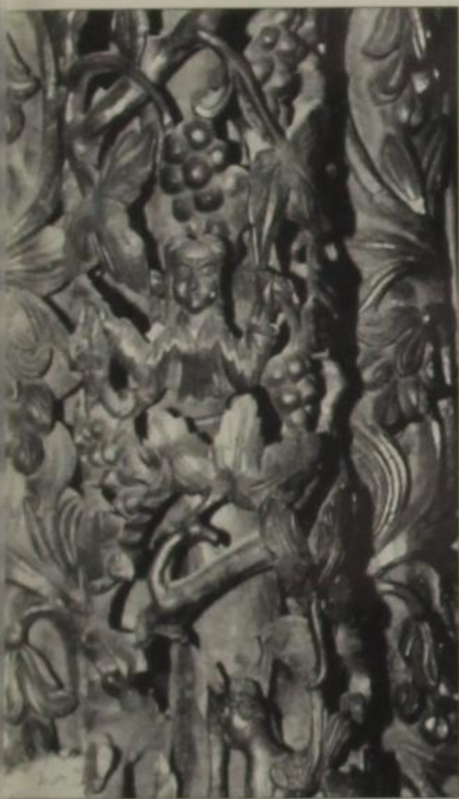
Αμπελος. Λεπτομέρεια υπό το ξυλόγλυπτο τέμπλο στην Αγ. Σοφία Άρτας.