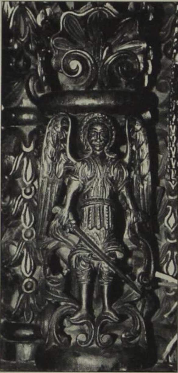
Αρχάγγελος. Λεπτομέρεια από το ξυλόγλυπτο τέμπλο στην Αγ. Σοφία Άρτας.

Ομοίως ως είμεθα εις θέσιν να γνωρίζωμεν ως ξυλόγλυπτης ειργάσθη και ο επίσης μακαρία τη μνήμη Γεώργιος Κ. Κώτας (= Δημητριάδης) εις διάφορα μέρη, ιδίως στο Ελμπασάνι επεξεργασθείς τον Τέμπλον της Ι. Μονής του Αγ. Ιωάννου του Βλαδιμήρου, εν Άρτη τον τέμπλον του Ι. Ναού Αγ. Κωνσταντίνου, τον Αρχιερατικόν θρόνον εις Αγ. Σπυρίδωνα εντός της πόλεως Άρτης, ως και έξωθεν αυτής εις το χωρίον Ιμάμ Τσαούση (νυν Αγ. Σπυρίδων) τον τέμπλον και Αρχιεπισκ. Θρόνον, ως και αλλαχού.