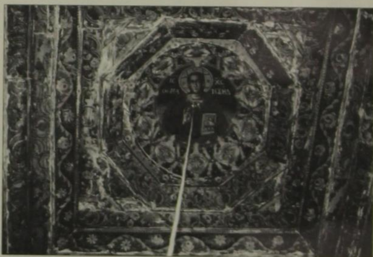
Περίτεχνο ταβάνωμα με μικρό τρούλο στο ναό Κοίμησης Θεοτόκου στους Πάδες Κόνιτσης, κατασκευασμένο και ζωγραφισμένο από Χιονιαδίτες.

Πλήθος δε τοσούτων εργαλείων σώζονται και σήμερα εν τω χωρίω, ως επί το πλεί-