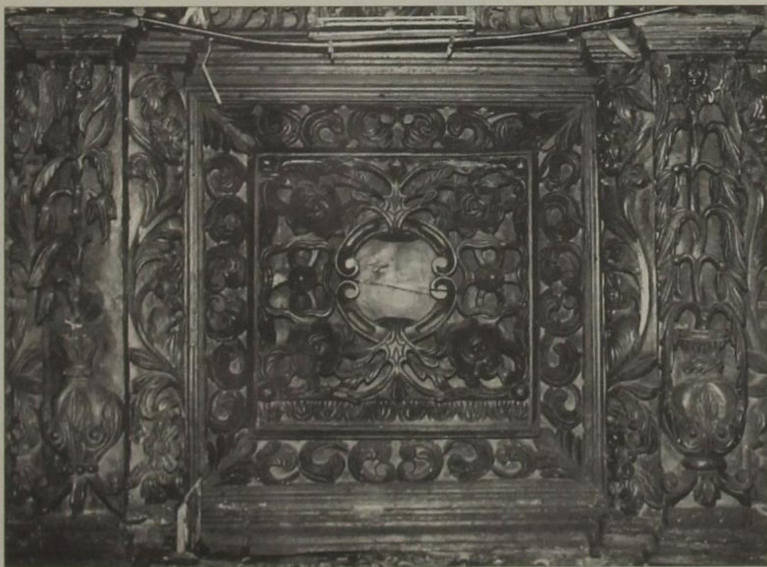
Τμήμα του ξυλόγλυπτου τέμπλου στην Αγ. Σοφία Άρτας, έργο του Σίμου Μαργαρίτη, 1850.