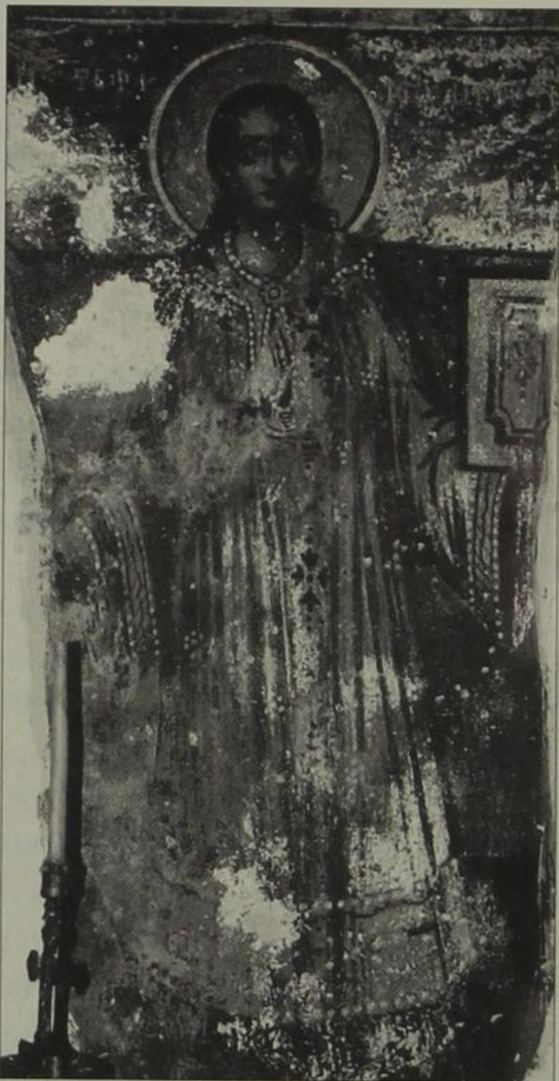
Ο Αγ. Στέφανος. Τοιχογραφία στο ιερό.

την κεραμοσκεπή. Σε αυτούς εικονίζονται η Παναγία ως Πλατυτέρα των Ουρανών και ο Άγιος Γεώργιος. Στα σφαιρικά τρίγωνα κάτω από την Παναγία φιλοτεχνήθηκαν προφήτες και κάτω από τον Άγιο Γεώργιο σκηνές του βίου και του μαρτυρίου του. Στον μεγαλύτερο τρούλο που βρίσκεται κοντύτερα στο ιερό εικονίζεται ο Χριστός Παντοκράτωρ, προφήτες και στα τρίγωνα οι Ευαγγελιστές. Η ζωγραφική του τρούλου έχει υποστεί μεγάλες φθορές. Στις καμάρες κάτω από τους τρούλους ζωγραφίστηκαν άγιοι-μάρτυρες, μούστα ή ολόσωμοι, άγγελοι και χερουβείμ. Αξιοσημείωτη είναι η απεικόνιση στηθαρίου του Χριστού ως Μεγάλης Βουλής Αγγέλου, στη βόρεια πλευρά ανάμεσα στις συνθέσεις, ο οποίος ζωγραφίστηκε μετά και κάλυψε ορισμένες μορφές των παραστάσεων.