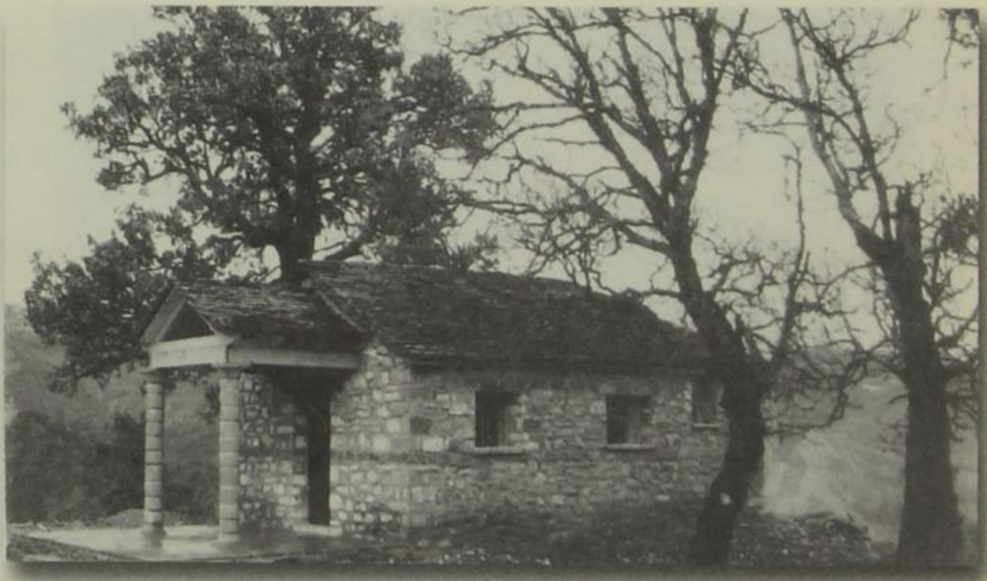
Ό Άγιος Χαράλαμπος τής Πυρσόγιαννης.

Άνηφορίζοντας σήμερα τά σοκάκια τής Πυρσόγιαννης καί σκύβοντας στοργικά σέ κάθε σκαλιστή πέτρα, κτητορική έπιγραφή καί τοιχοποιία, διαπιστώνεις πώς ή εϋθύνη, τό μεράκι καί ή γνώση σέ βάθος χαρακτήριζαν τή δουλειά τών παλιών μαστόρων. Άπό τίς κατασκευές τής τουρκοκρατούμενης κοινότητας σώζονται ελάχιστες καί ή διατήρηση μερικών άκόμα λιθόγλυφων όφείλεται στήν