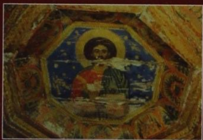
Ὁ Παντοκράτορας στό Ναό τοῦ Ἁγίου Ἀθανασίου