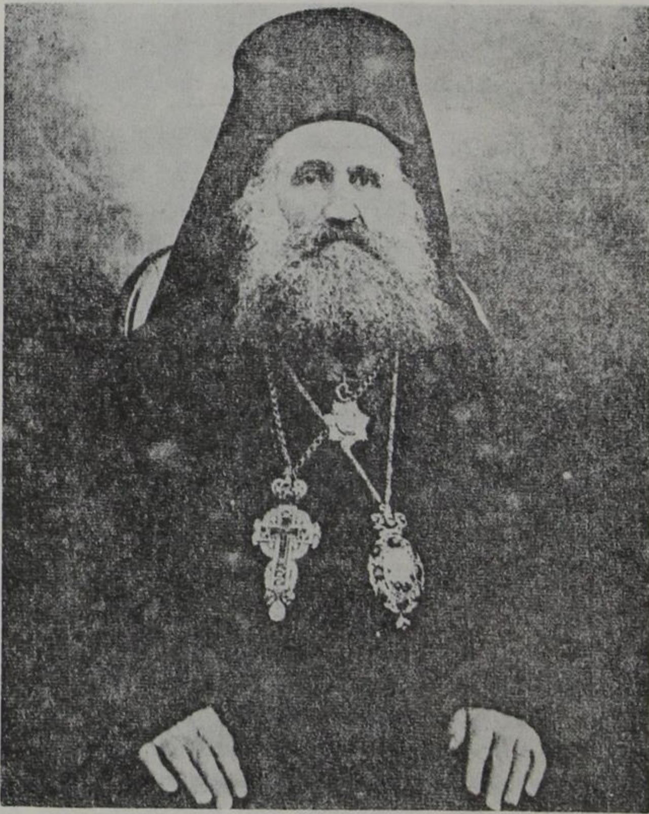
Ὁ Μητροπολίτης Ἀργυρουπόλεως Βασίλειος (1858—1936)

Κεῖται δὲ τὸ Νέον Λάμποθον παρὰ τὴν ἀρχαίαν Φωτικήν, ἐπὶ