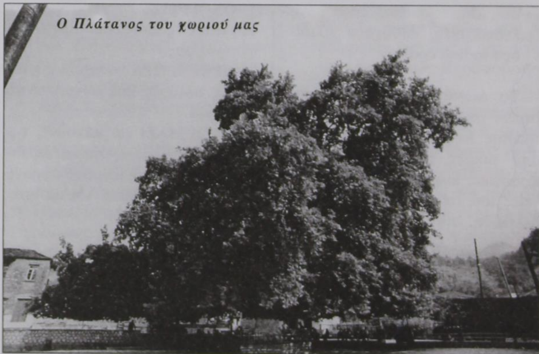
Ο Πλάτανος του χωριού μας