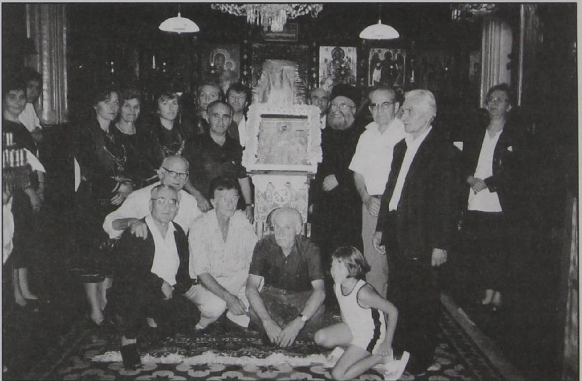
Οι Εκκλησιαστικοί Επίτροποι των χωριών Κερασόβου-Παλαιοσελίου, εν μέσω του παλά και Κερασοβιτών/-σών.

Εκφράζουμε ολόθερμα, Σεβασμασιώτατε, προς την αγιότητά σας, τις ευχαριστίες μας για τη θερμή σας συνηγορία, ώστε να γίνει πραγματικότητα η από πολλά χρόνια ή δεκαετίες αυτή μας η μεγάλη επιθυμία.