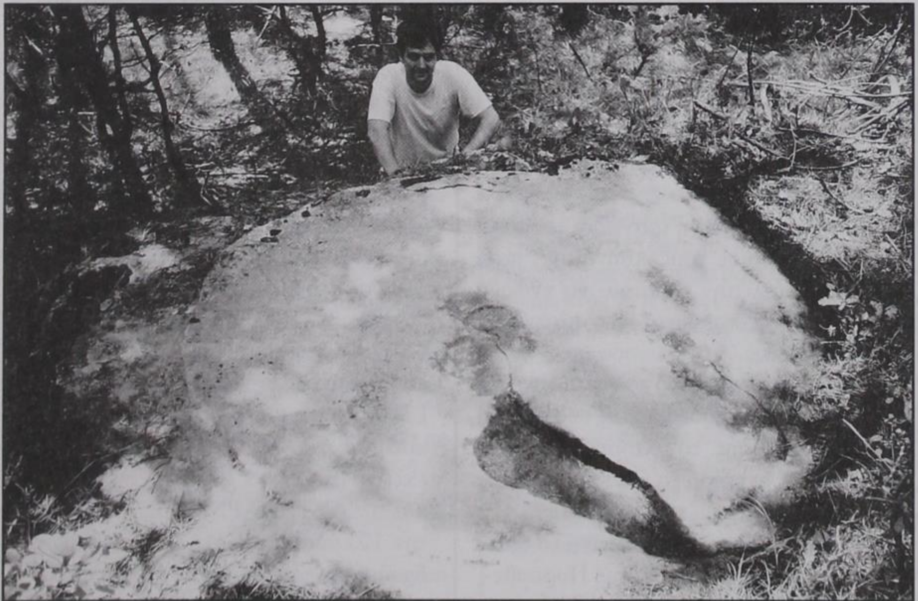
Φώτης Κ. Βάιλας στον ολοστρόγγυλο βράχο της Κόντα-ράχης.