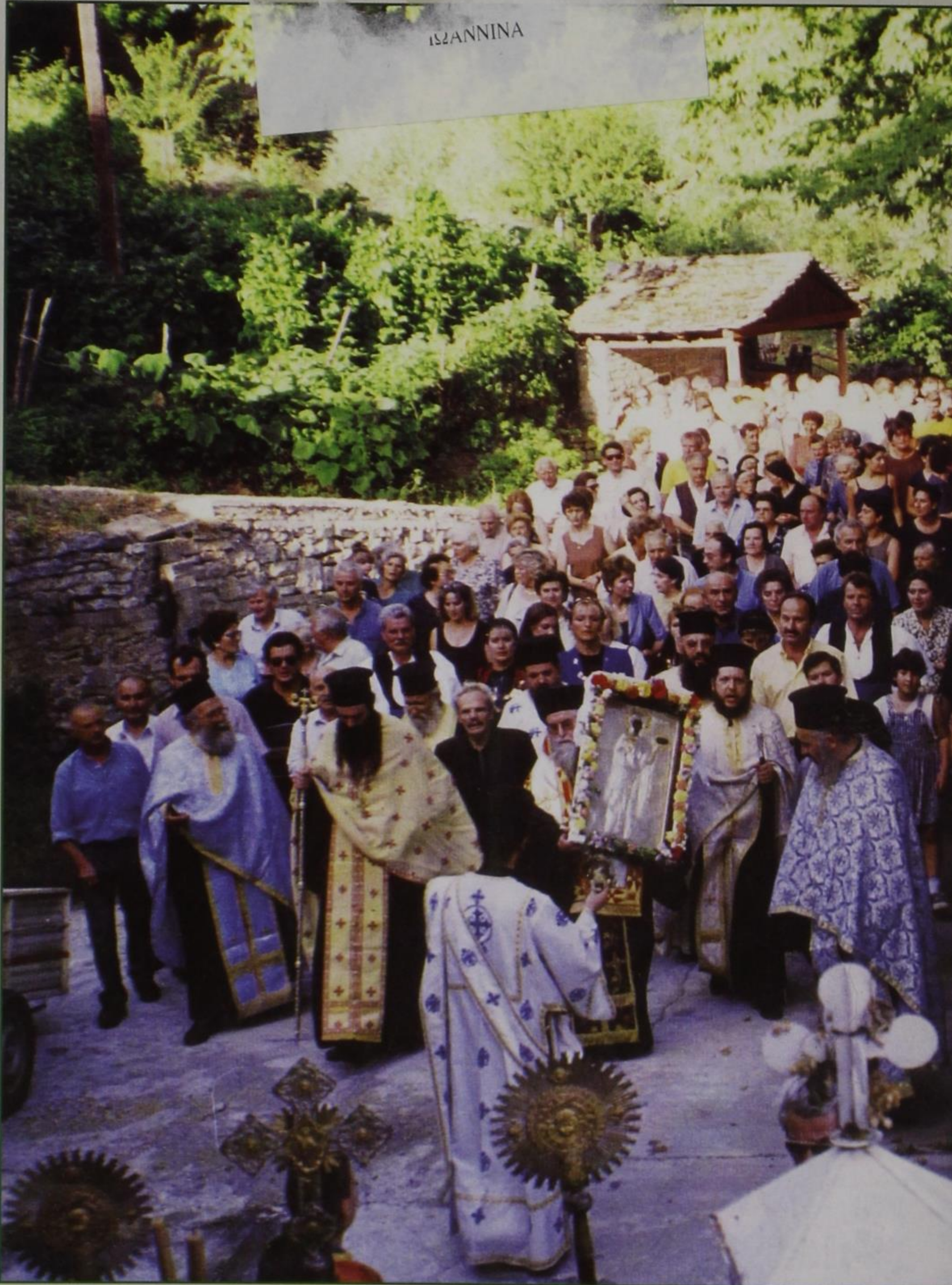
Λιτάνευση της αγίας εικόνας στο χωριό μας.