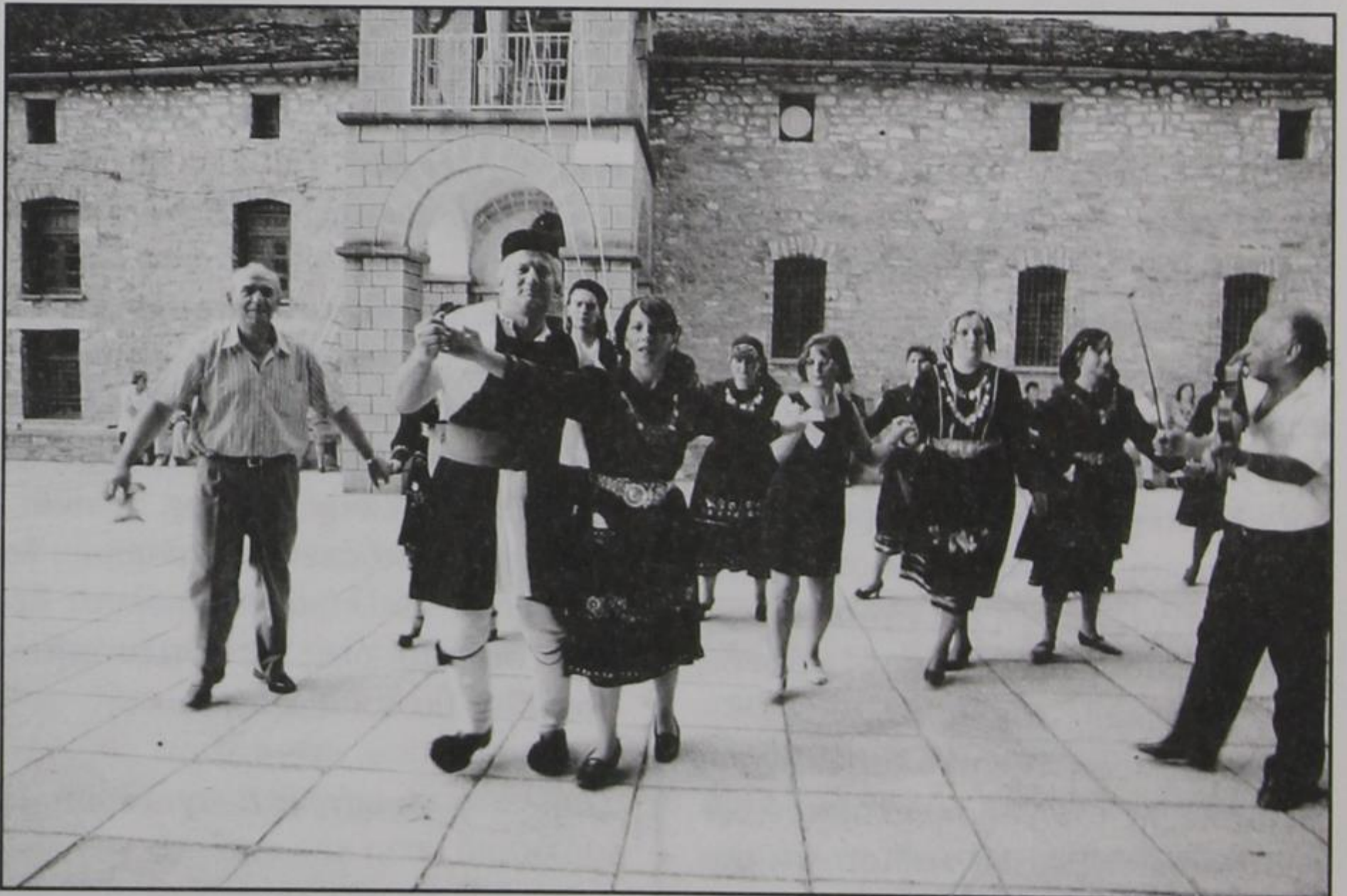
Πανηγύρι 1999. Χορός στην πλατεία της εκκλησίας.

Όταν τ' απόγεμα πήραμε το δρόμο του γυρισμού, φάγαμε καθ' οδόν τόση βροχή, που γίναμε μούσκεμα, χωρίς υπερβολή, και μέσα απ' το δέρμα μας. Κανείς δεν παραπονέθηκε, κανείς δεν κρύωσε παρ' όλο που ακόμα και τα