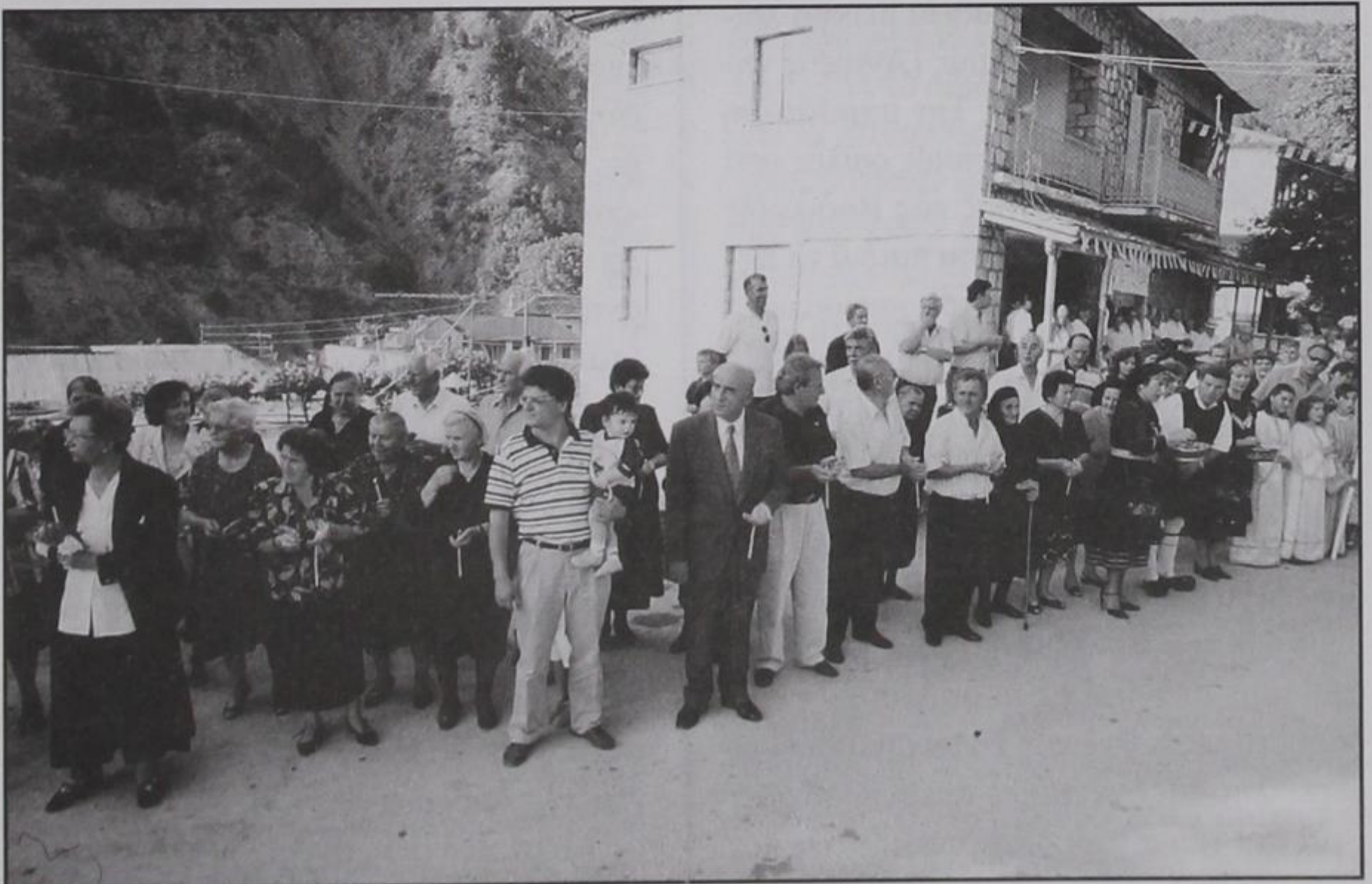
Αναμόνη υποδοχής της θαυματουργικής εικόνας της αγίας Παρασκευής με αναμμένα κεράκια.

Ακολούθησε μέγας Αρχιερατικός Εσπερινός μετ' αρτοκλασίας και παρακλητικού κανόνα, χοροστατούντος του Σε-