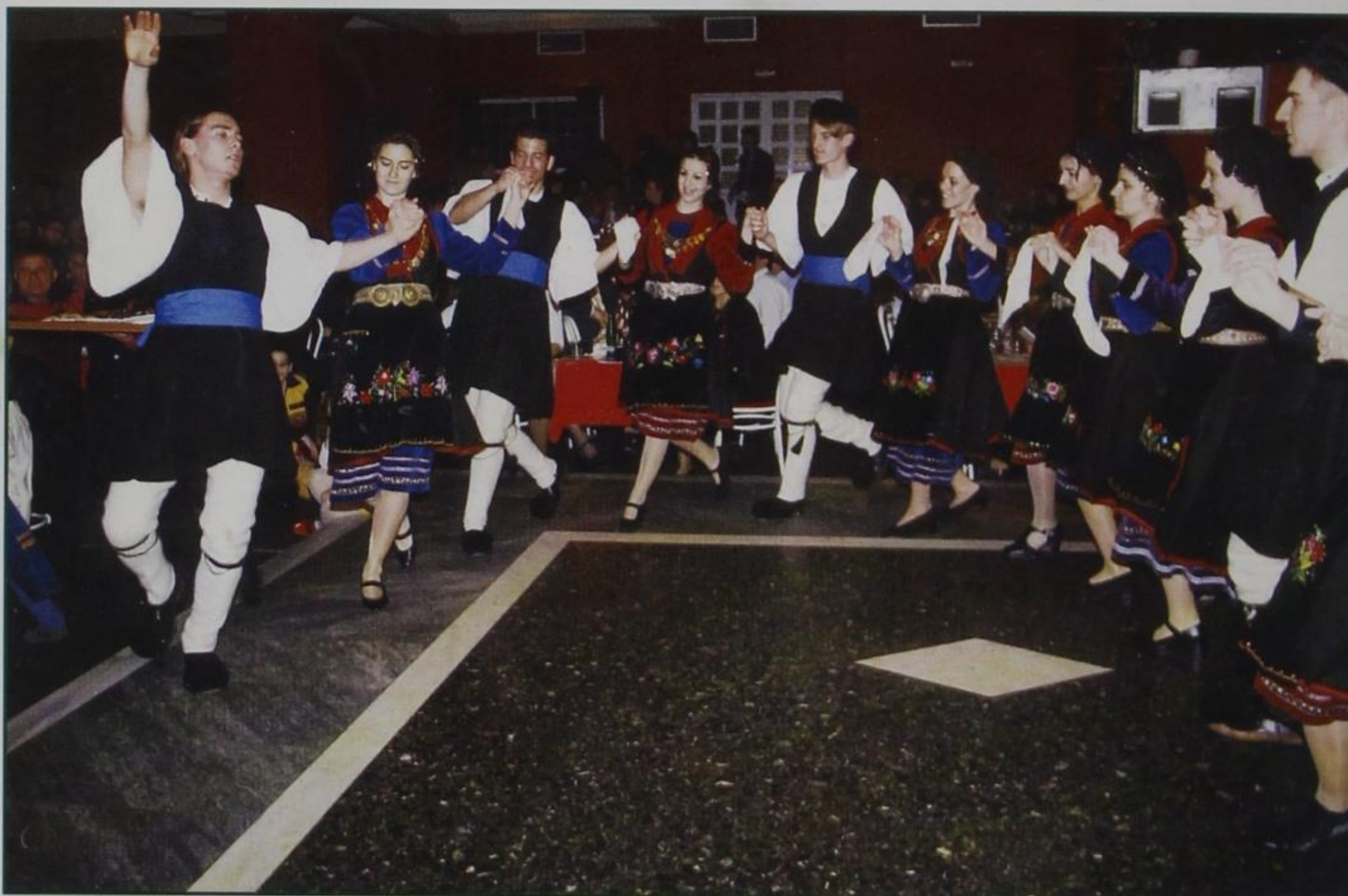
Στιγμιότυπο από το χορευτικό των παιδιών του Κερασόβου.

ΠΑΝΕΠΙΣΤΗΜΙΟ ΙΩΑΝΝΙΝΩΝ ΦΙΛ. ΣΧΟΛΗ ΛΑΟΓΡΑΦΙΚΟ ΤΜΗΜΑ 453 32 ΙΩΑΝΝΙΝΑ