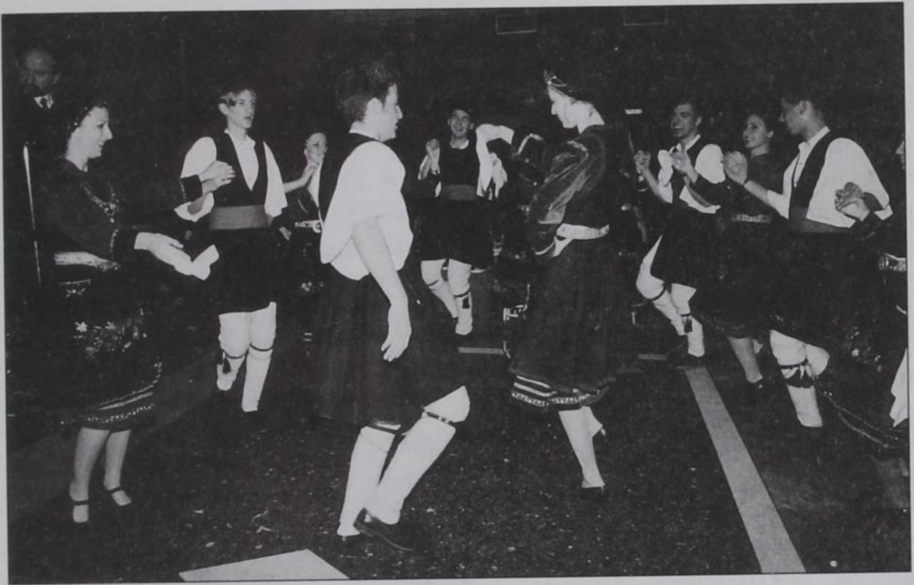
Στιγμιότυπο από το χορευτικό των παιδιών μας.

ΝΕΑ», που στις 24 του Φλεβάρη αφιέρωσε μια ολόκληρη σελίδα για τις πολιτιστικές εκδηλώσεις των δύο χωριών, του Πύργου στις 18 και του Κερασόβου στις 19. Τους ευχαριστούμε πάρα πολύ για τα καλά τους λόγια όπως και τα «Π.Ν.».