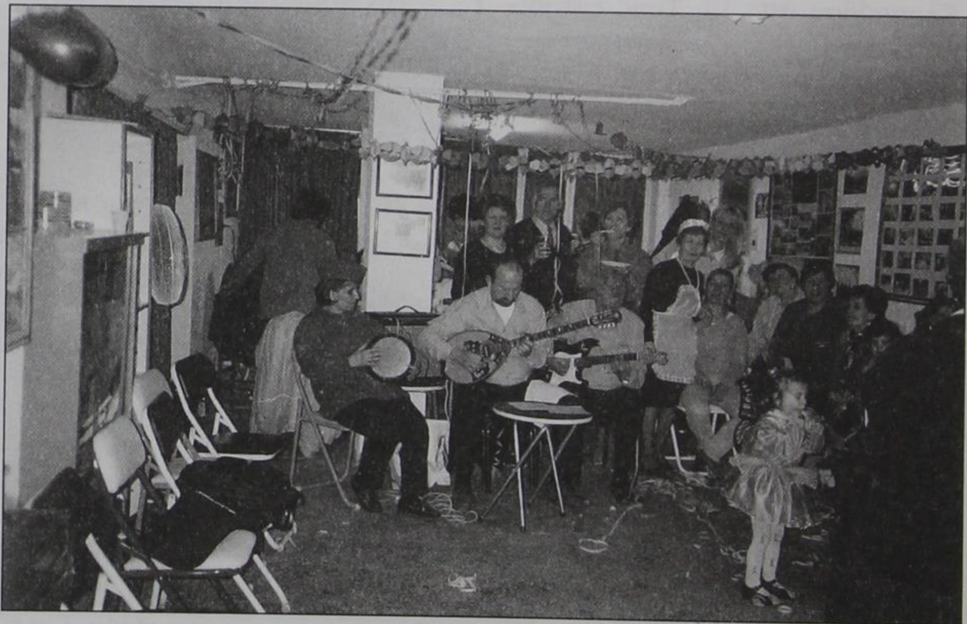
Αποκριάτικο γλέντι στα Γραφεία της Αδελφότητας.