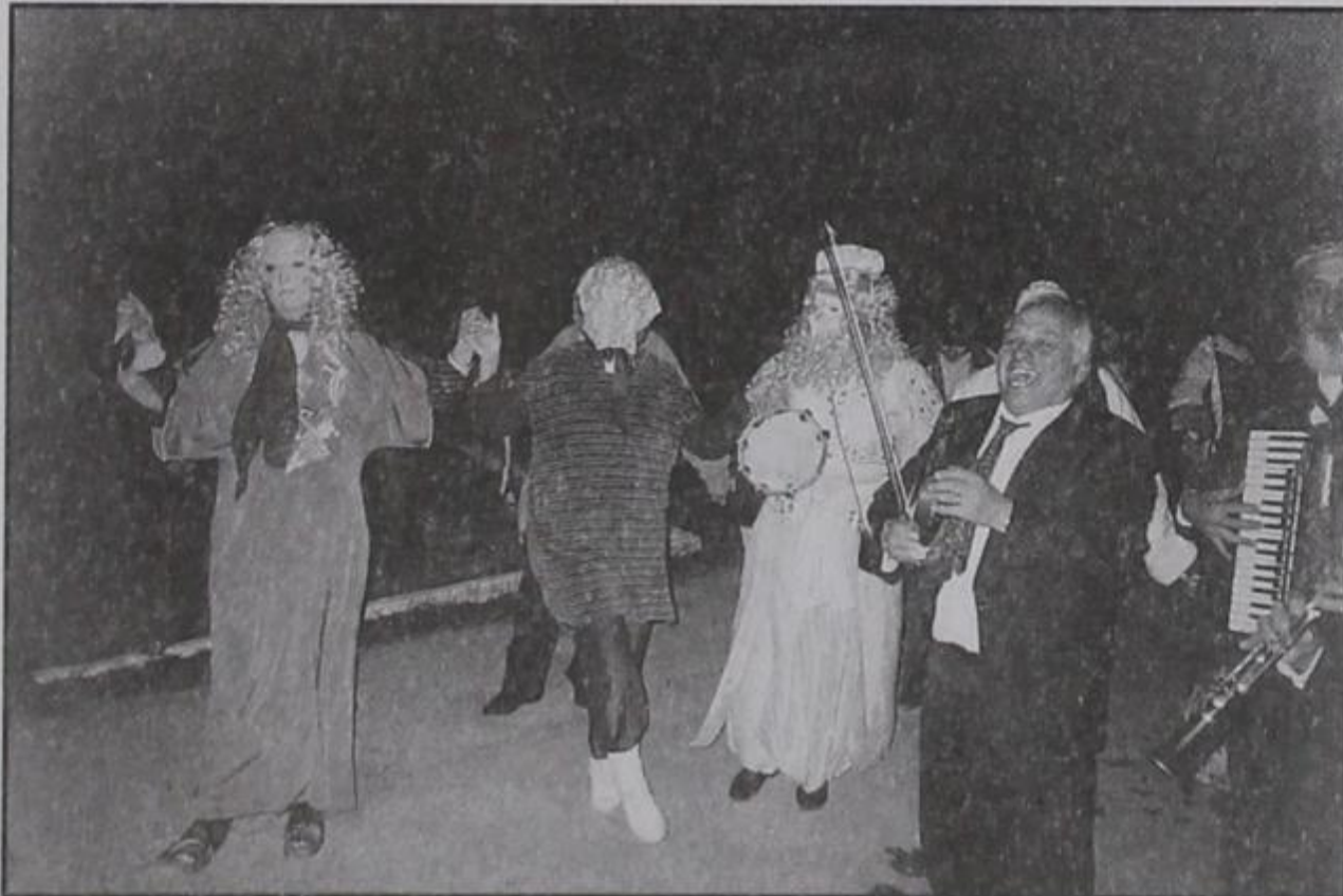
Γυναίκες μασκαράδες χορεύουν στο Σχολειό