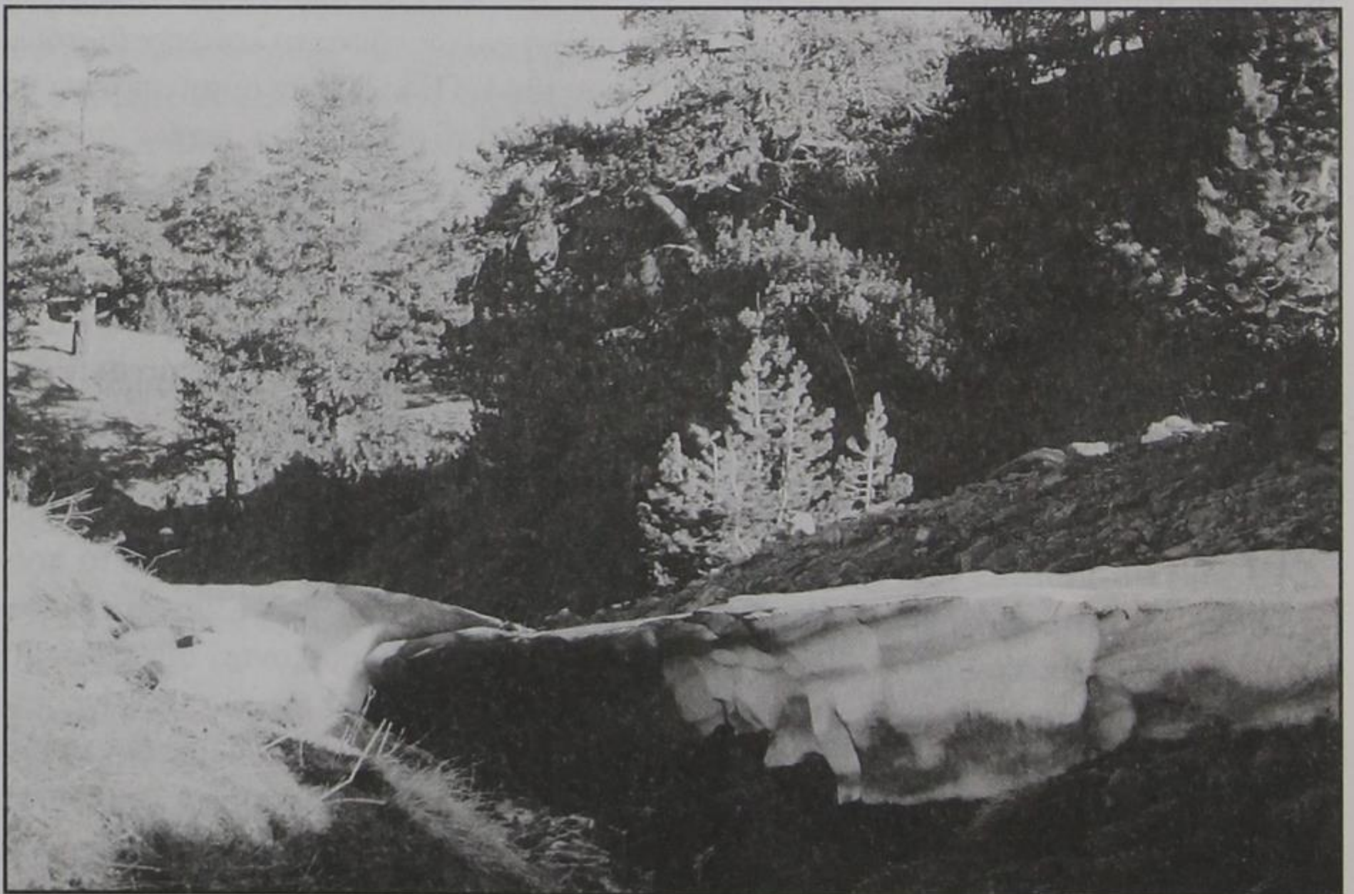
Άνοιξη με παγωμένο ακόμα τον Βουρκοπόταμο