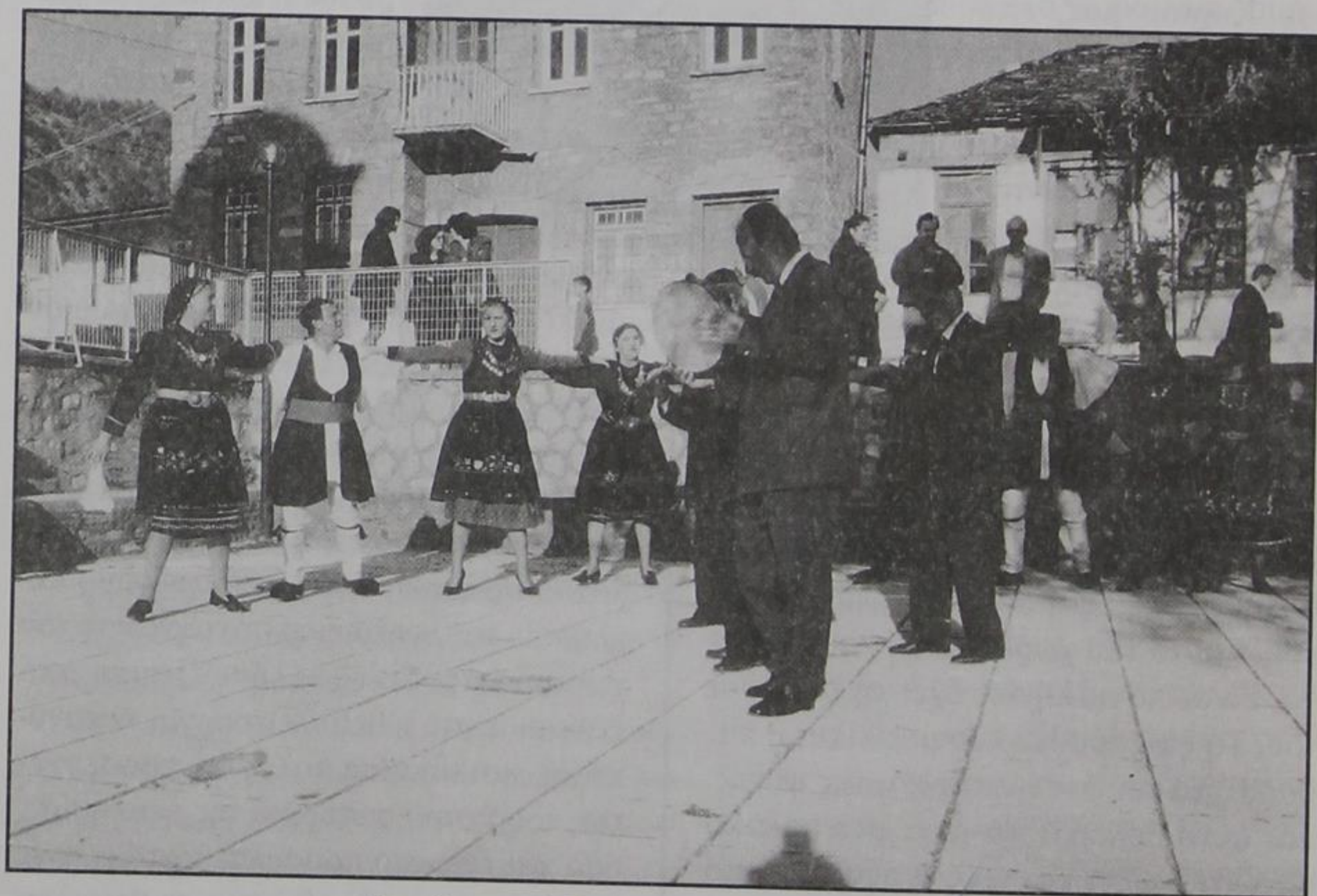
Χορός στο Μεσοχώρι, Πάσχα 2000

Πάντως, ήταν μια νότα ευχάριστης ξεγνοιασιάς για εμάς τους Πασχαλινούς επισκέπτες και για δυο-τρία ζευγάρια ξένων επισκεπτών που δεν πήγαν στον Σμόλυγκα με την υπόλοιπη παρέα τους. Οι Άγιοι Προκόπης-Γιώργης να έχουν καλά όλο τον κόσμο ώστε να μπορέσουμε και του χρόνου να παραβρεθούμε στη χάρη του Αγίου και να έχουμε την ευλογία του πλούσια.