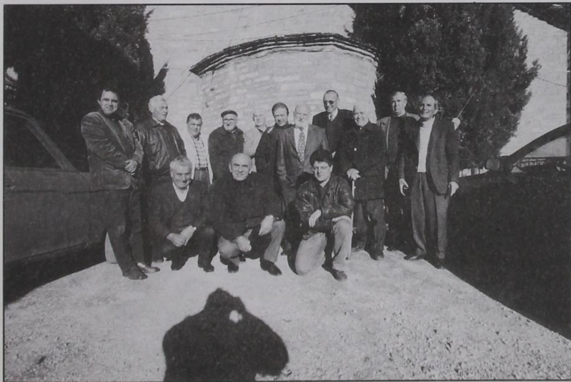
Κερασοβίτες την ημέρα της ΑΠΟΧΗΣ

Έχουμε λοιπόν τρεις (3) συνεχείς ΑΠΟΧΕΣ από τις κάλπες. Φαινόμενο ΣΠΑΝΙΟ και ΜΟΝΑΔΙΚΟ στα Κερασοβίτικα χρονικά. Ειδικά η τελευταία