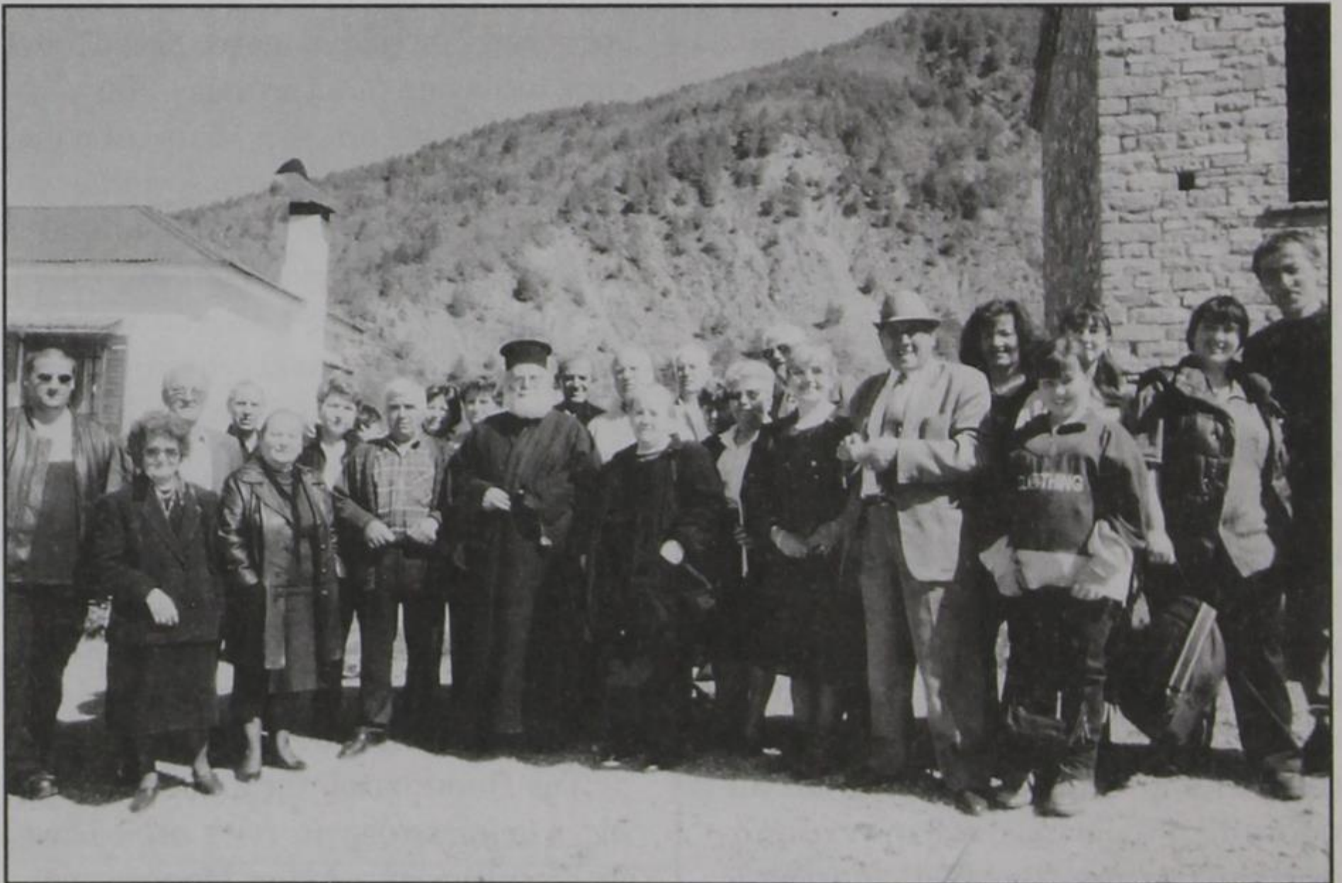
Ώρα αναχώρησης των Πασχαλινών εκδρομμένων, Κυριακή του Θωμά.

Υ.Γ. Πρωτομαγιά δεν γιορτάστηκε φέτος στο χωριό μας, λόγω βροχερού καιρού. Μας τα χάλασε. Είχαμε προγραμματίσει για την Τετάρτη 3 του Μάη.