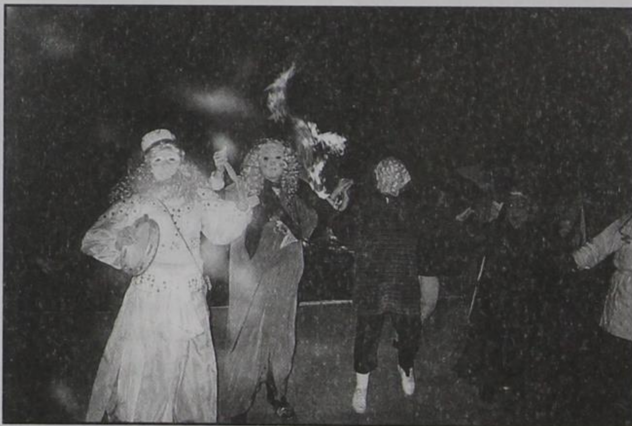
Καίγοντα κέδρα και χορός γυναικών μασκαράδων

Προηγήθηκε όμως της κοινής συνεστίασης, η εκπλήρωση του παλιού μας Κερασοβίτικου εθίμου, που είναι πα-