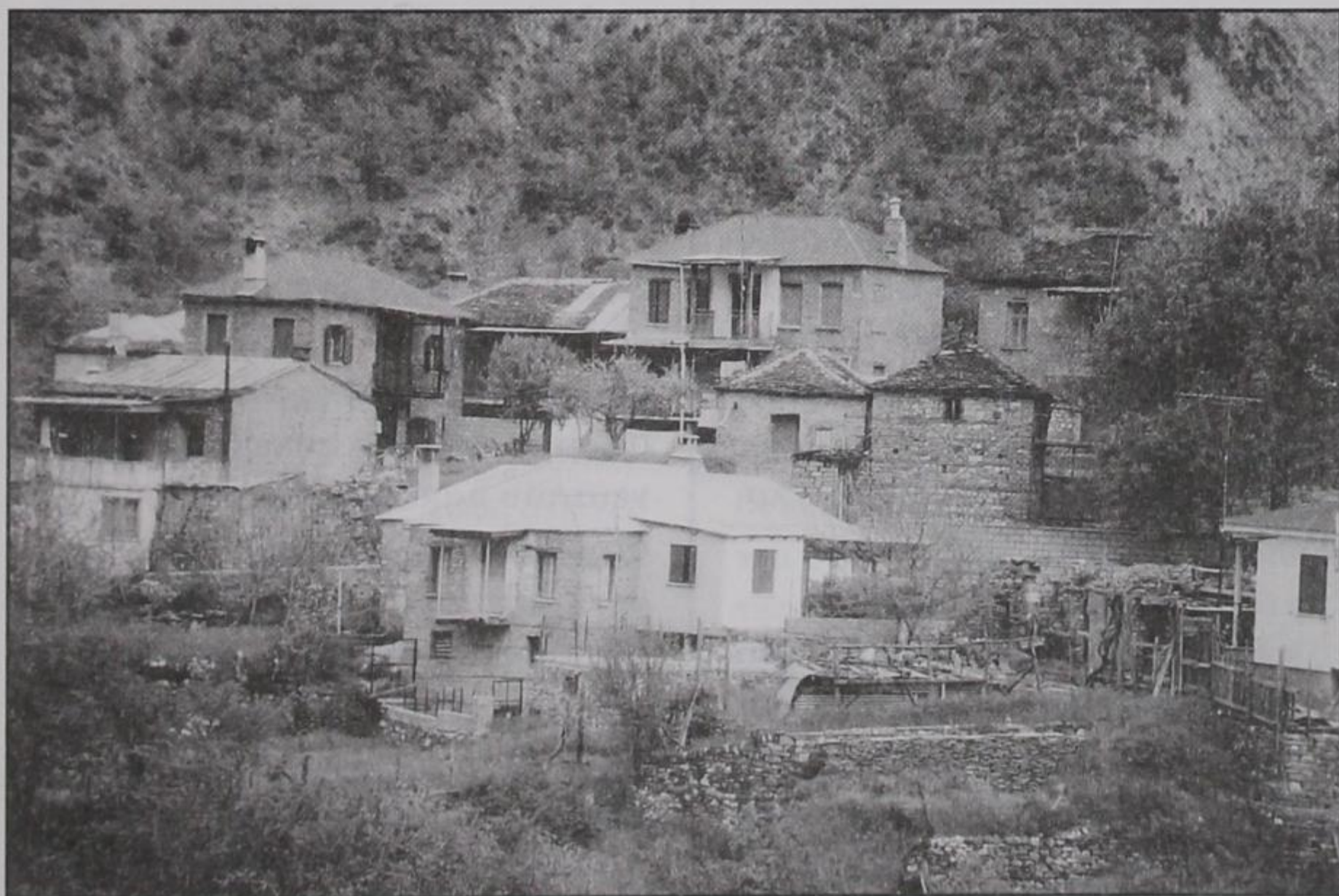
Σπίτια της γειτονιάς και κήποι-χωράφια