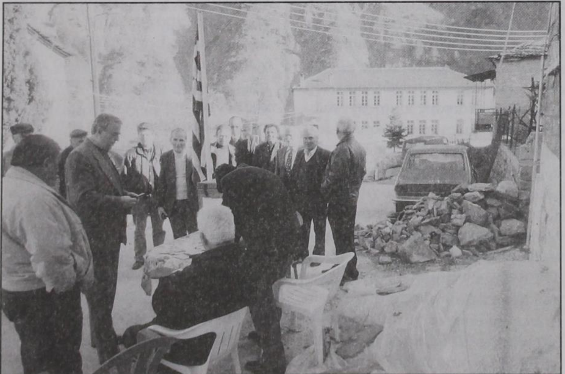
Η ώρα της κάλπης. Κερασοβίτες που ψηφίζουν ΑΠΟΧΗ