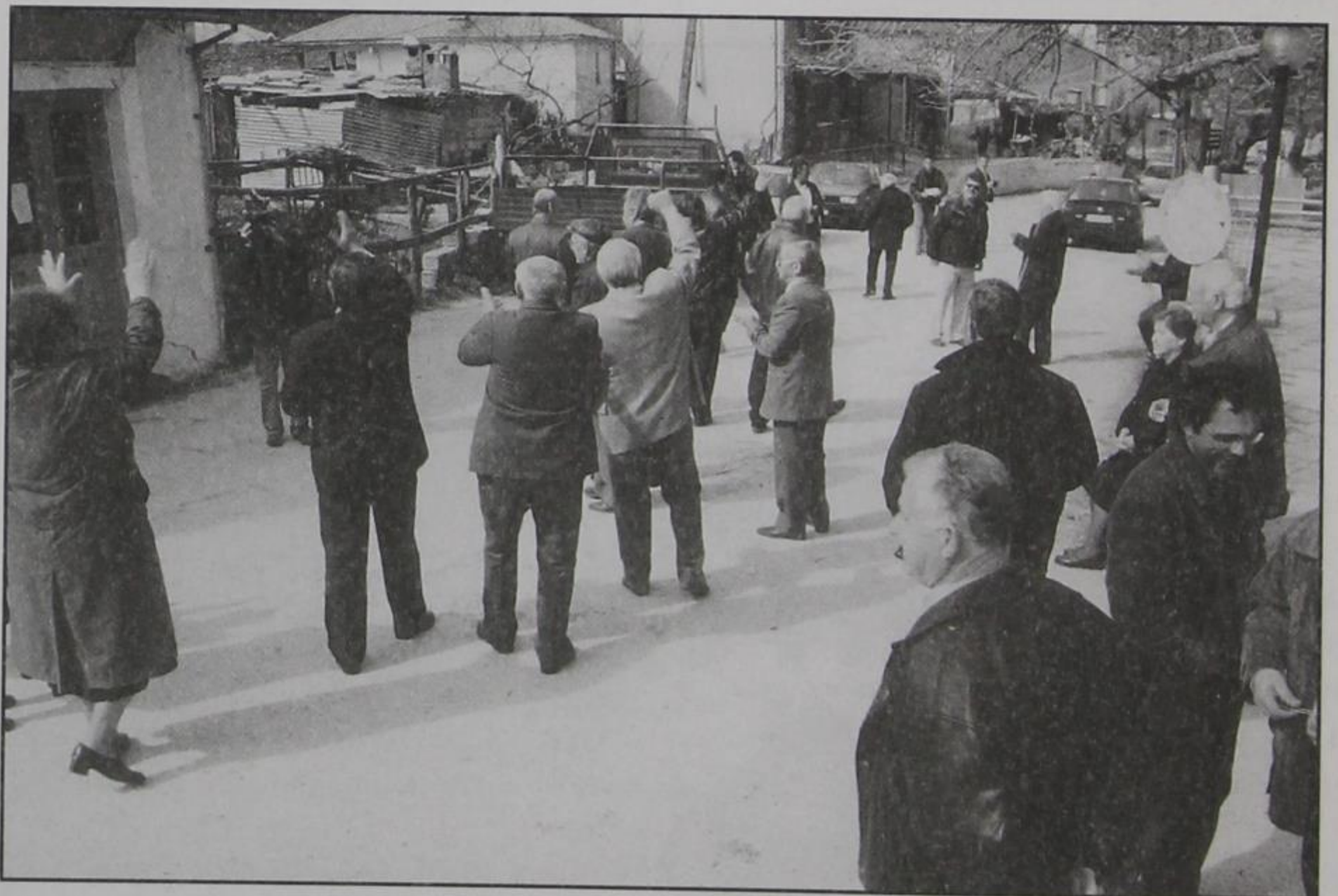
Κερασοβίτες χειροκροτούν την ΑΠΟΧΗ

Με αυτούς τους θαυμάσιους τρόπους αντέδρασαν σ' αυτή τη μεγάλη αδικία οι Κερασοβίτες-τισσες. Το σύνθημα που βροντοφώναζαν ήταν ένα και μοναδικό, «Το Κεράσοβο είναι εδώ, ενωμένο δυνατό». Η επάρατη κατάρα της φυλής μας, η ΔΙΧΟΝΟΙΑ δεν έφτασε, ούτε και θα φτάσει ποτέ στο χωριό μας. Οι όποιες προσπάθειες από ελάχιστους «μικροανθρώπους» του χωριού μας, μόνιμους κατοίκους και ετεροδημότες, που θέλησαν να εσπείρουν ανάμεσά μας, έπεσαν στο βρόντο, στο κενό, δεν εισακούστηκαν. Το Κεράσοβο παραμένει ενωμένο και στην ένωση υπάρχει η δύναμη. Στη φωτιά ατσαλώνει το σίδηρο, γίνεται ρομφαία, σπαθί Δαμασκηνό που δεν λυγίζει ποτέ. Ήδη έχουμε τις πρώτες ενδείξεις. Τα όργανα της Τοπικής Αυτοδιοίκησης Ιωαννίνων, άρχισαν να προβληματίζονται σοβαρά με