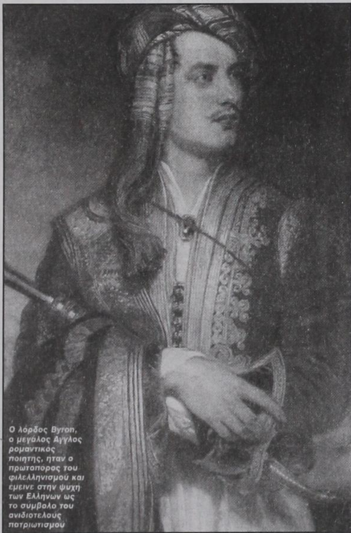
Ο λόρδος Βύρον, ο μεγάλος Άγγλος ρομαντικός ποιητής, ήταν ο πρωτοπόρος του φιλελληνισμού και έμεινε στην ψυχή των Ελλήνων ως το σύμβολο του ανιδιοτελούς πατριωτισμού

Επανάστασης του 1821, αλλά και για τη στάση των μεγάλων δυνάμεων στο εθνικό μας αυτό ζήτημα. Έχει γράψει ένα βιβλίο «Πώς είδαν οι ξένοι την Ελλάδα του '21;». Στο βιβλίο του αυτό είναι αποκαλυπτικός για τον άλλο «φιλελληνισμό», των συμφερόντων των Μεγάλων Δυνάμεων που έβλεπαν ότι εξυπη-