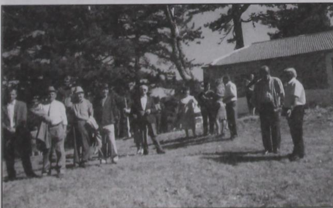
Προσκυνητές στον Προφήτη Ηλία