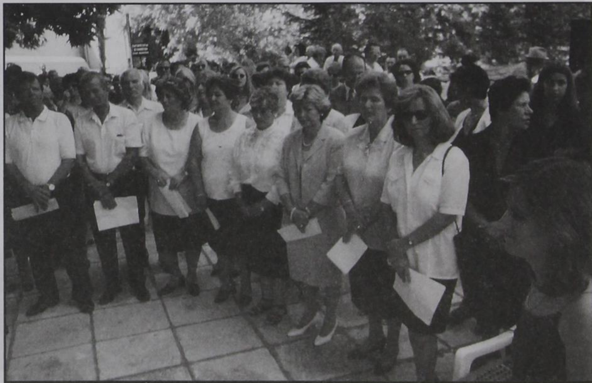
Στιγμιότυπο από τον Όμιλο Τραγουδιών

Μετά το πέρας της θείας λειτουργίας έγινε επιμνημόσυνη δέηση, μπροστά στο βάθρο της γεννήτρας Κερασοβίτισσας Μάνας, υπέρ αναπαύ-