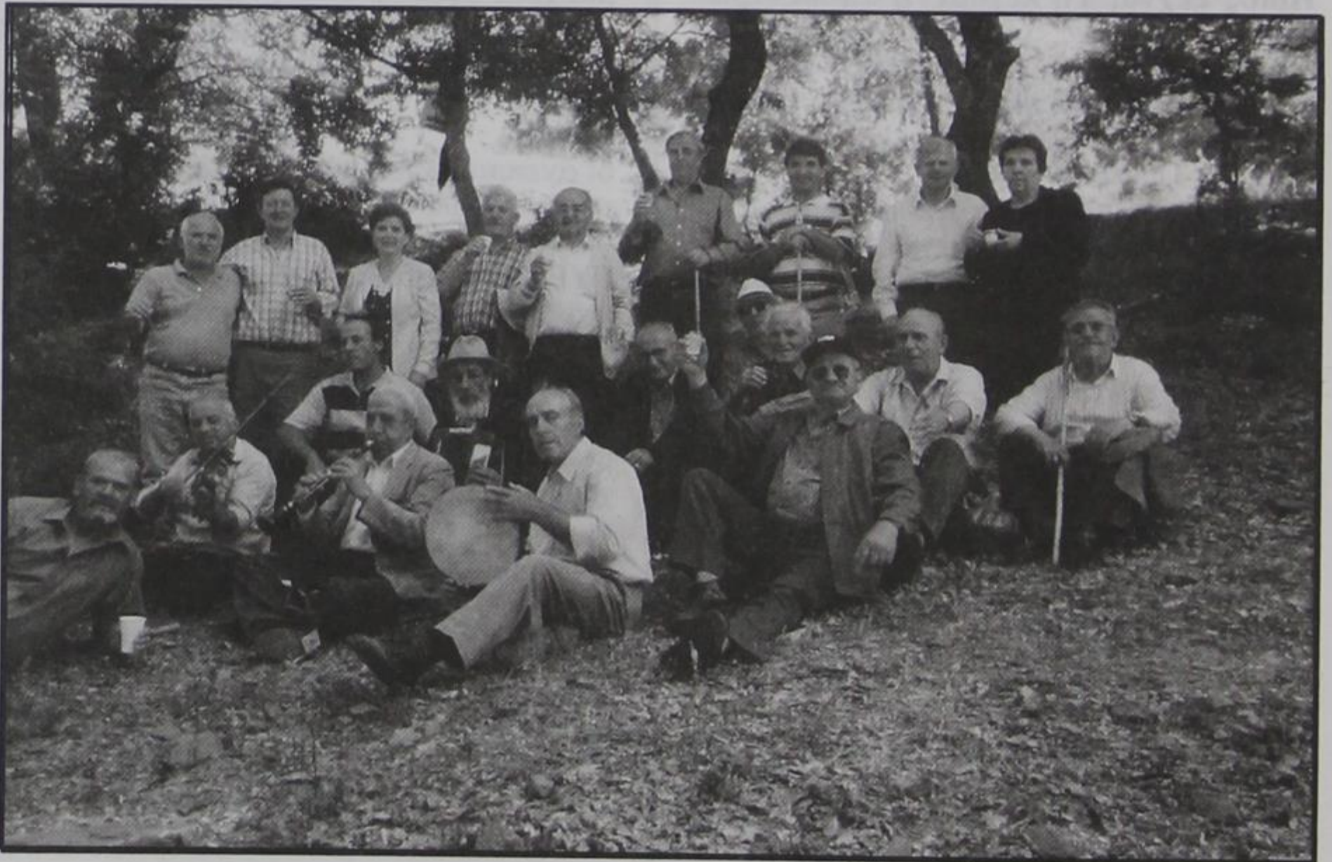
Προσκυνητές στον Άγιο Θεοδόσιο

Αγόρω, είναι οι άνθρωποι που αγαπούν και φροντίζουν ιδιαίτερα το εξωκλήσι. Δεν φείδονται κόπων, μόχθων και εξόδων, χρόνια τώρα. Είναι με λίγα απλά λόγια, «η ψυχή» του μικρού και όμορφου αυτού εξωκκλησιού. Με την επισκευή και συντήρησή του, απόκτησε και μικρό υπνοδωμάτιο με τζάκι, όπως και καμπαναριό. Λείπει όμως η καμπάνα. Η μικρούλα που υπάρχει τώρα, δεν είναι κατάλληλη για το καμπαναριό. Η αυλή πλακοστρώθηκε και ο χορός γίνεται άνετα, χωρίς χώματα και σκόνες. Τα παλιά χρόνια, εδώ γίνονταν το πρώτο μικρό πανηγύρι (πανηγυρόπουλο) του χωριού μας. Ήταν πρόδρομος του μεγάλου πανηγυριού που γίνεται στις 26 Ιουλίου στη μνήμη της Μεγαλομάρτυ-