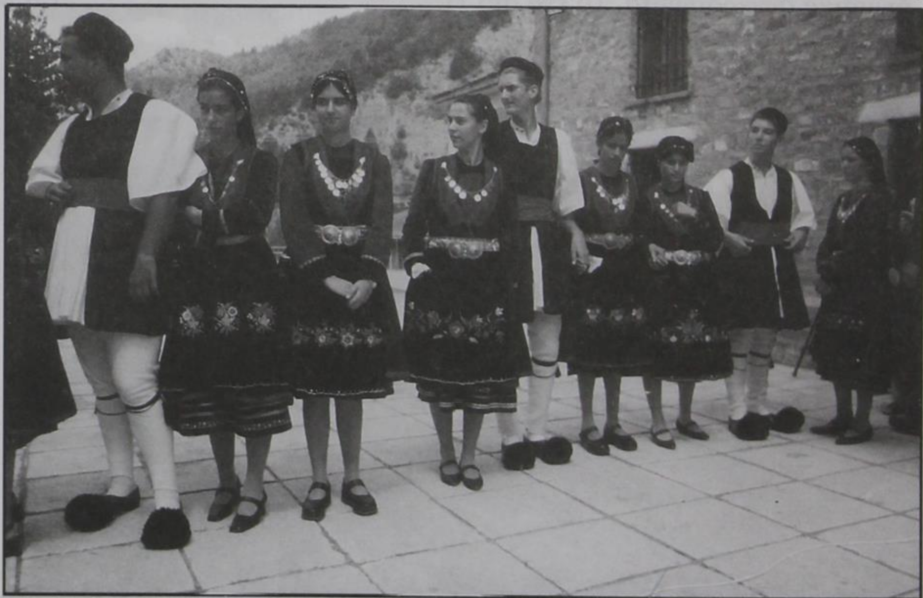
Η νεολαία του χωριού μας

Ο Πρόεδρος της Αδελφότητάς μας, με σειρά άρθρων του στο Κερασοβίτικο περιοδικό με τίτλο, «Αφιέρωμα στις τελευταίες μάνες τρανές και στις γυναίκες μάνες του χωριού μας», είχε επισημάνει ότι η Κερασοβίτισσα Μάνα ήταν, ανά τους αιώνες που πέρασαν, η αφανής ηρωίδα της πατρίδας, της θρησκείας, της οικογένειας και της κοινωνικής ζωής του τόπου μας, του χωριού μας. Και επομένως εμείς