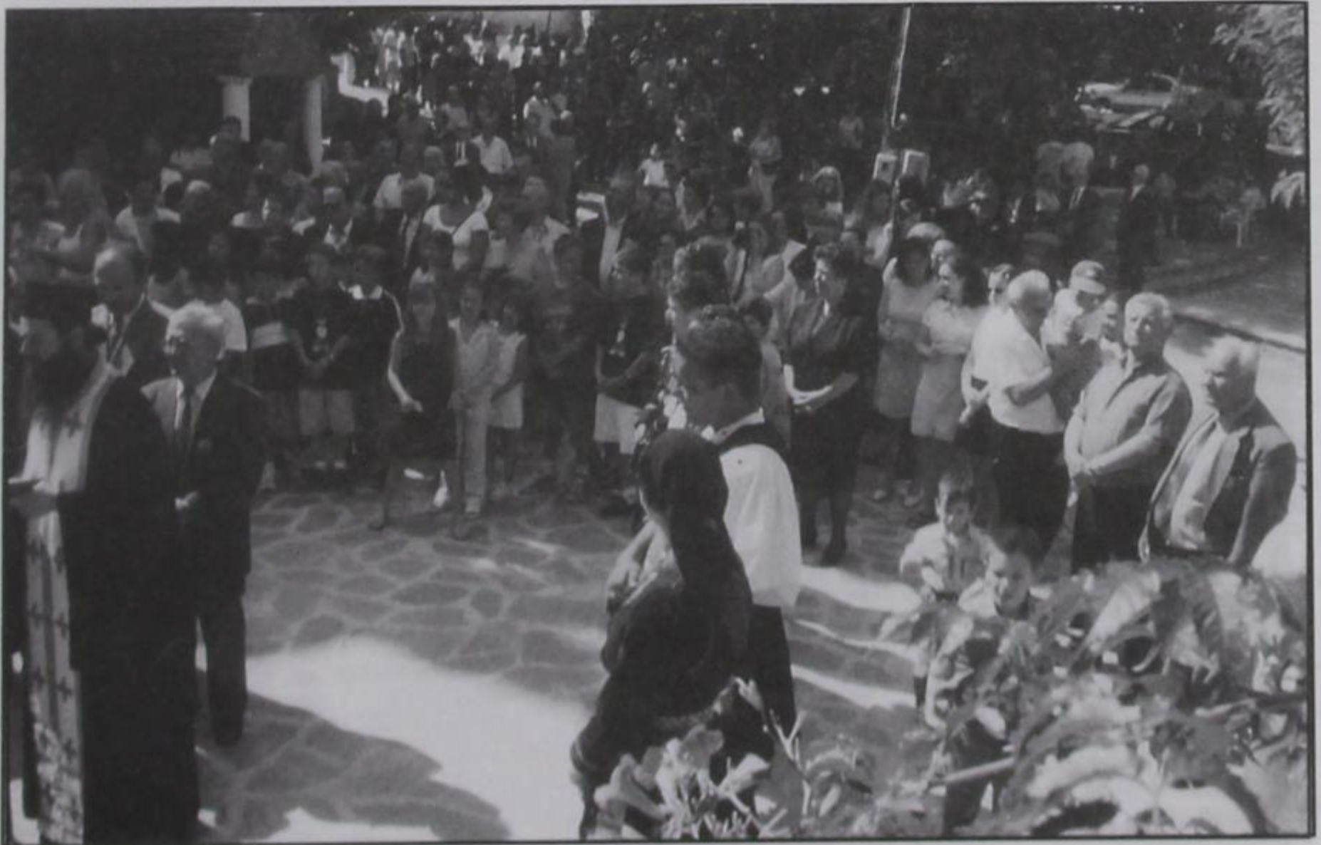
Στιογμιότυπο από τα αποκαλυπτήρια