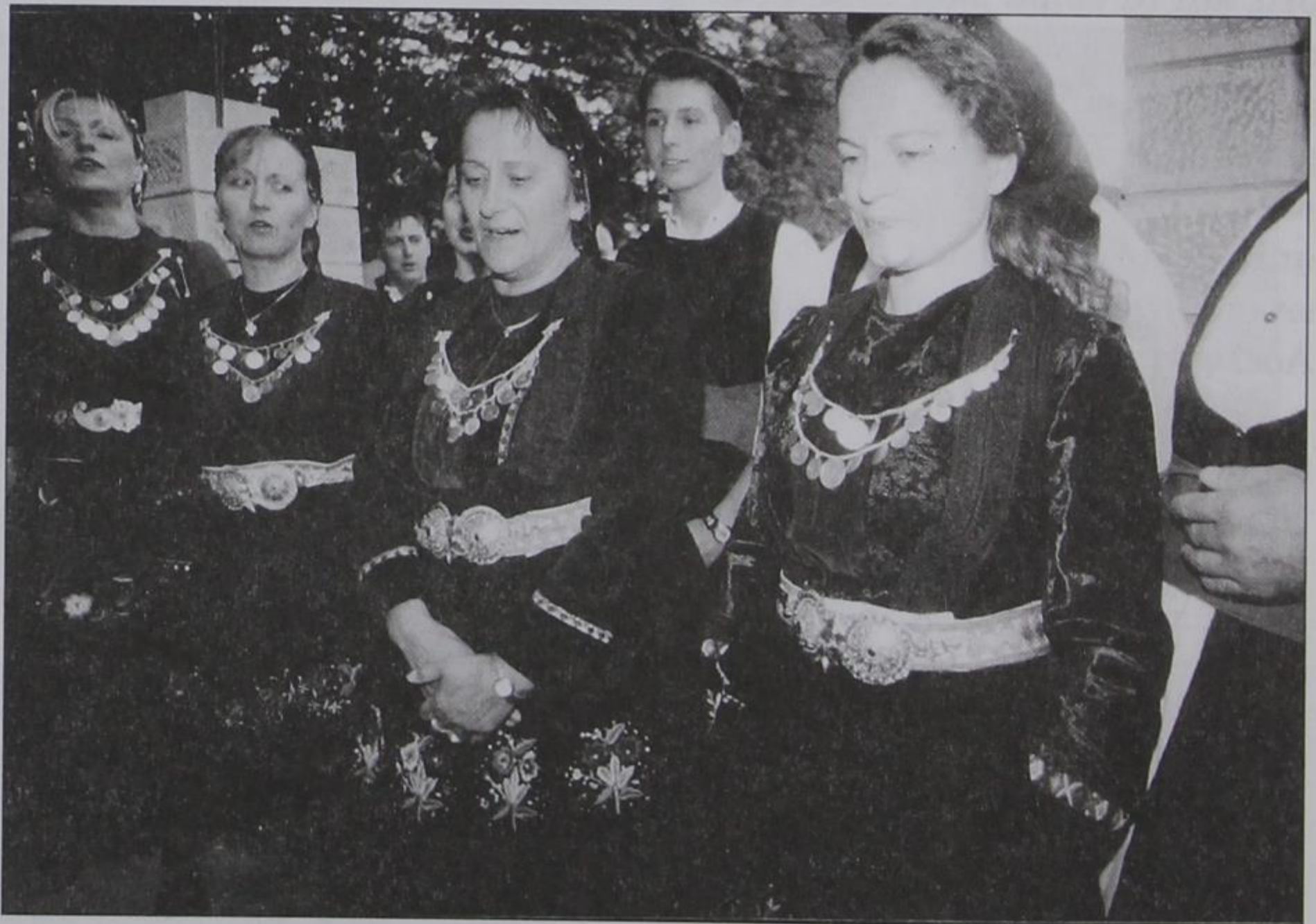
Τραγούδι στη Βρύση της Παναγιάς από γυναίκες του χωριού μας.

Είναι ύψιστο χρέος μας προς όλους αυτούς τους αθανάτους