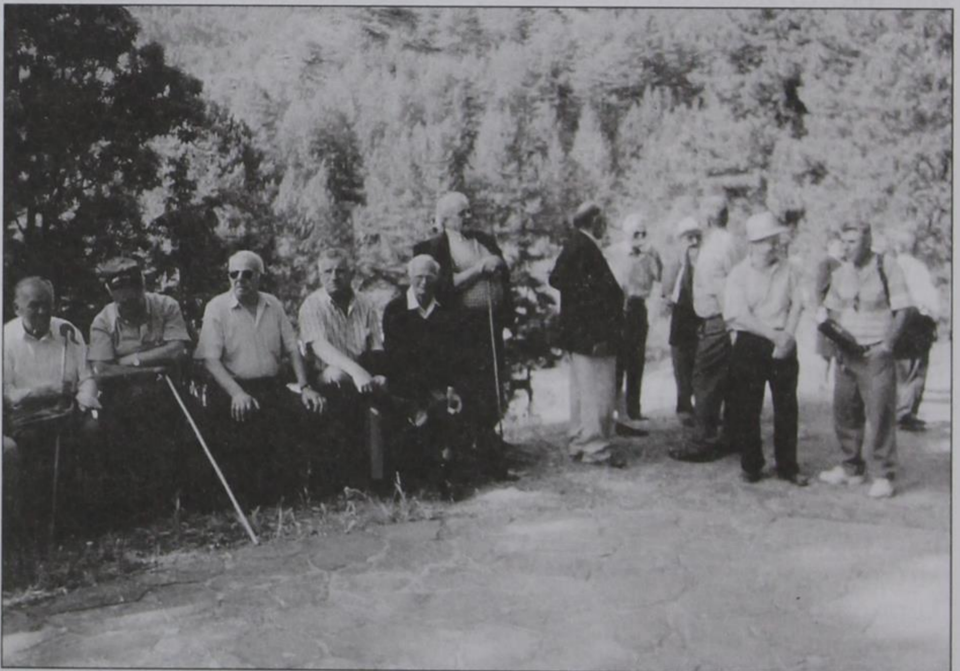
Προσκυνητές στον Προφήτη Ηλία.

Όλα καλά και ωραία γίνονται, πλην της πρόωρης αναχώρησης των προσκυνητών από τον προφήτη Ηλία. Είναι κρίμα και άδικο να