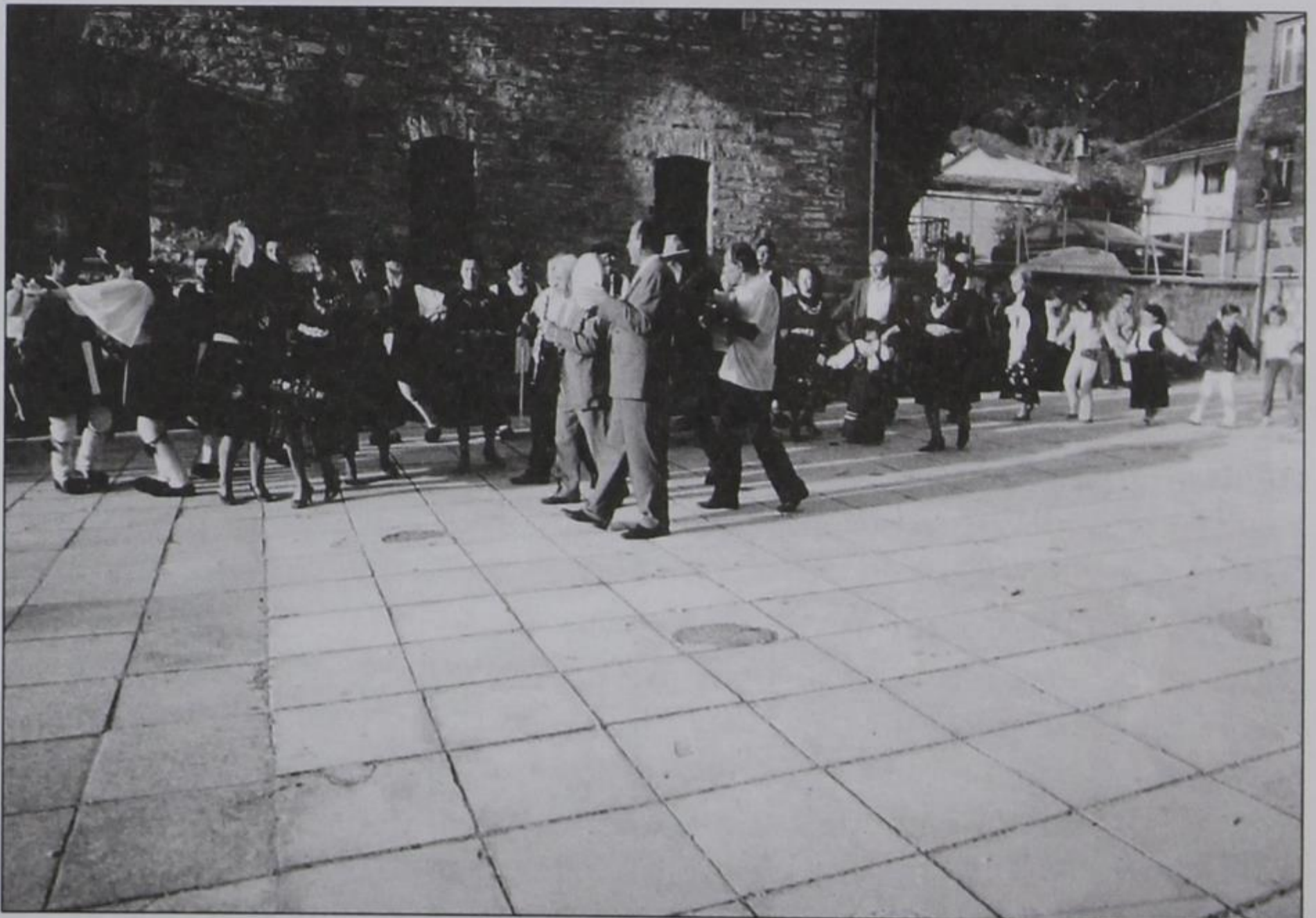
Χορός από άντρες-γυναίκες με Κιρασοβίτικες φορεσιές.

– Έτσι και έγινε. Διπλός χορός, απ' έξω οι άντρες και μέσα οι γυναίκες. Χάρμα οφθαλμών, οι Κι-