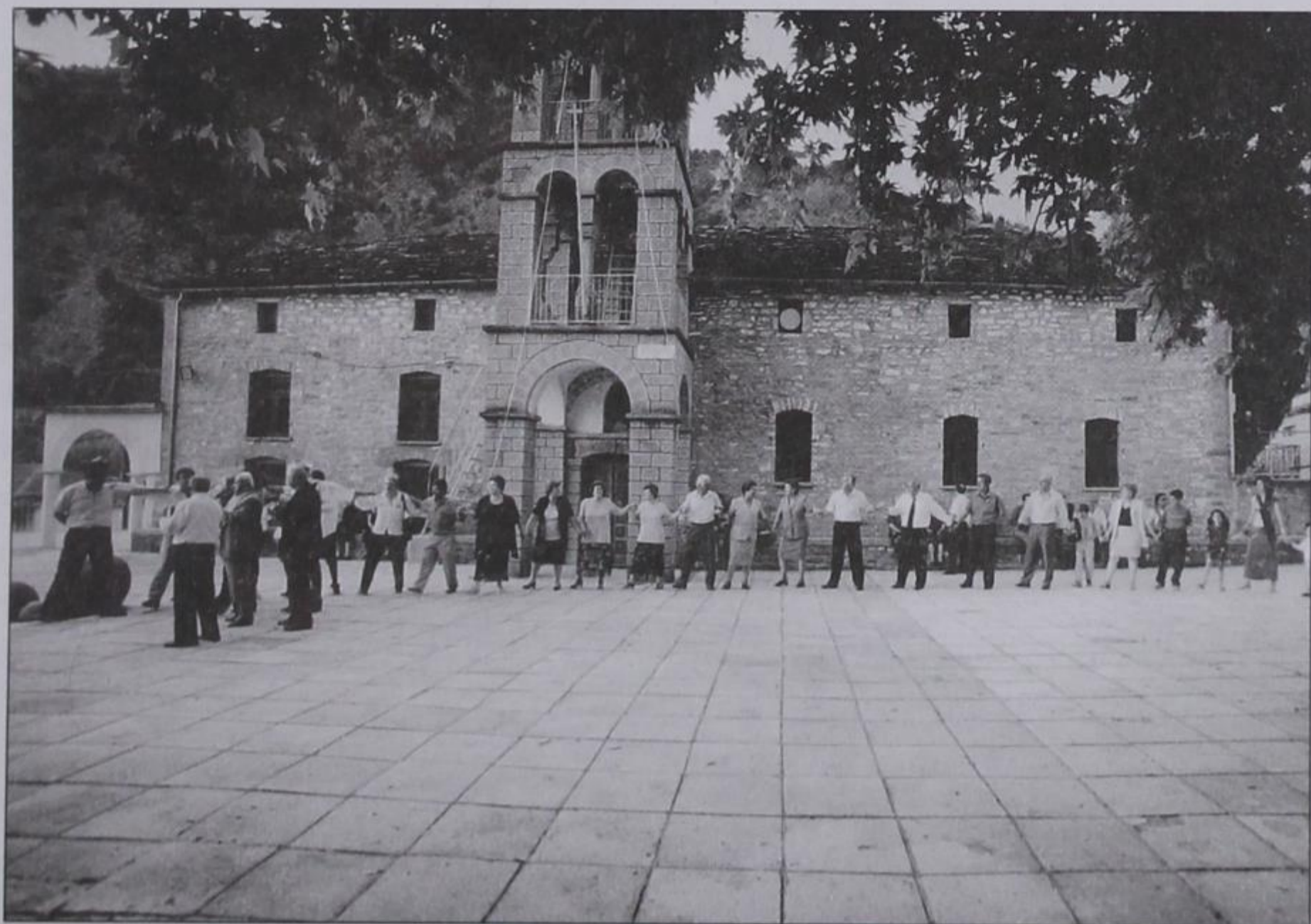
Πανηγύρι 2001. Χορός στο μεσοχώρι.

Την παραμονή της γιορτής τελέστηκε Μέγας Εσπερινός, μετά αροτοκλασίας, στο εκκλησάκι της Αγίας, που τον παρακολούθησε αρκετός κόσμος. Εδώ πρέπει να τονιστεί από όλους μας, και κυρίως από τον παπά μας, ότι πρέπει όλο το χωριό μας να παραβρίσκε-