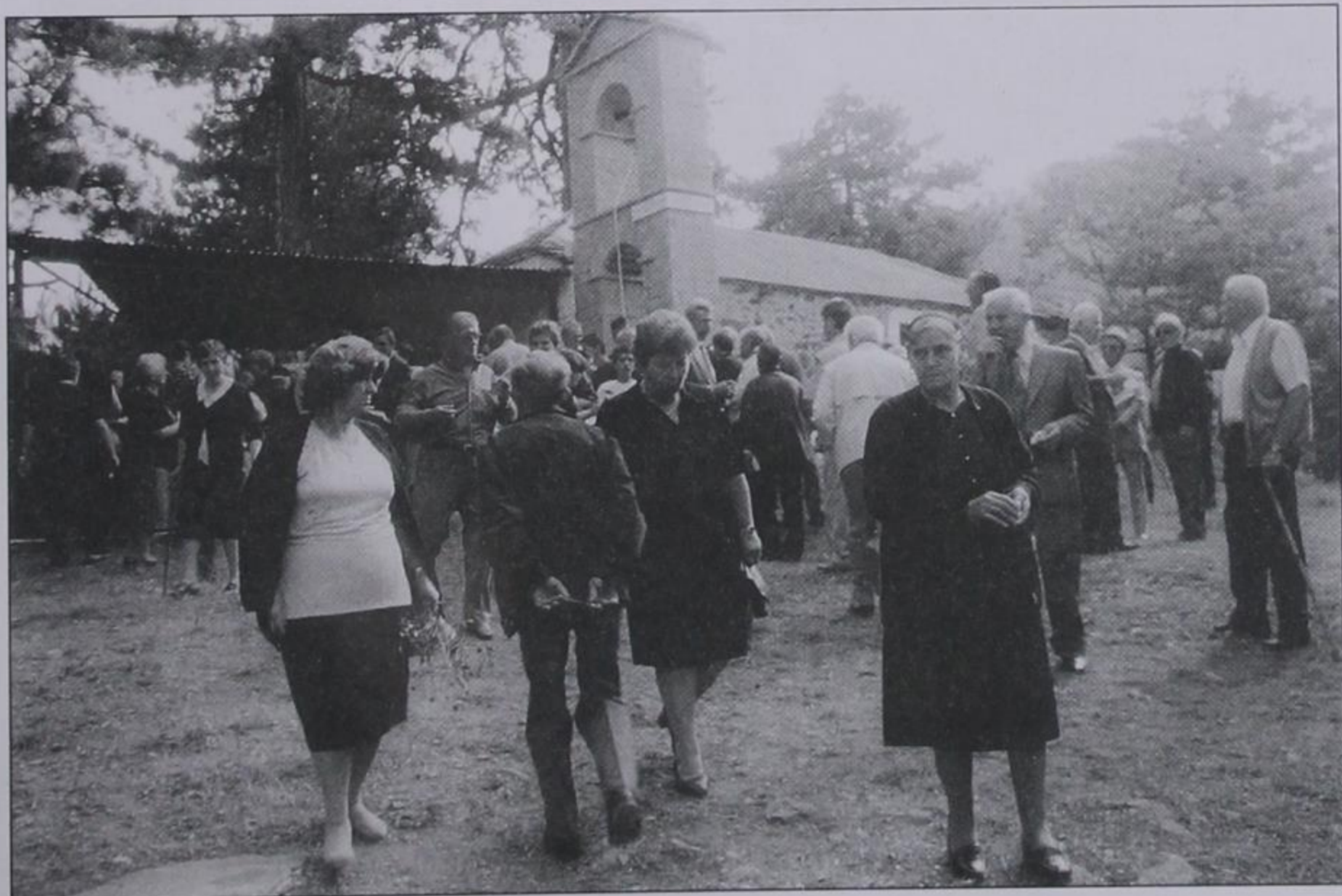
Συγχωριανοί μας στον προφήτη Ηλία.

Ακόμη φέτος, καμαρώσαμε και το νέο καμπαναριό με την γλυκόλαλη καμπάνα του, δωρεά-αφιέρωση του αείμηστου