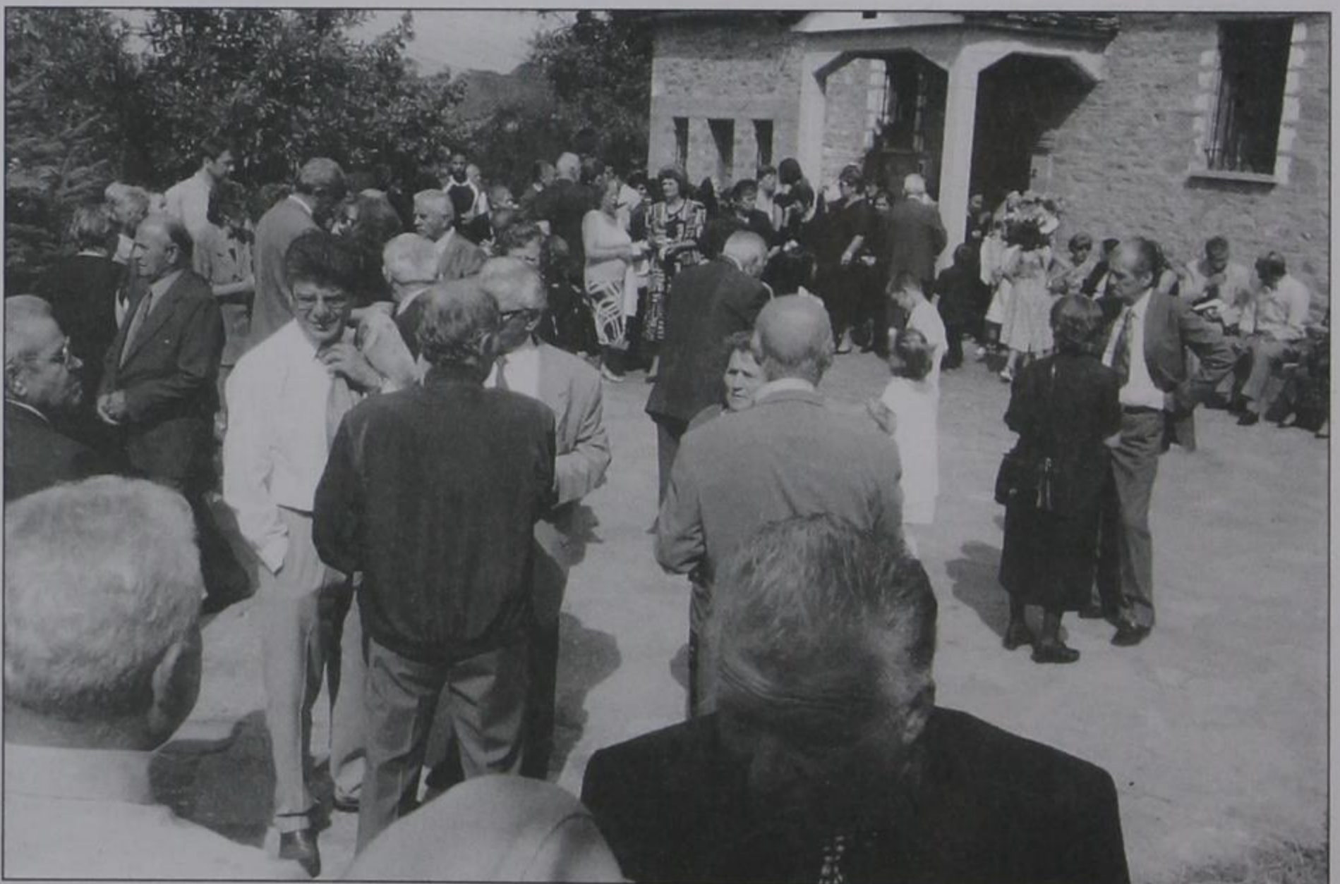
Συγχωριανοί μας στην ώρα λειτουργίας της εκκλησίας στην Αγία Παρασκευή.

Μετά το πέρας της Θείας Λειτουργίας, στο προαύλιο της