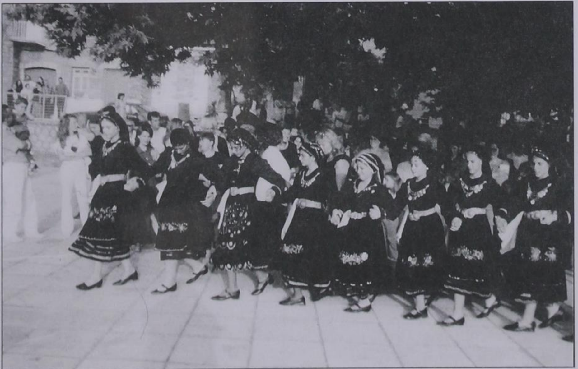
Τα κορίτσια μας χορεύουν στην πλατεία του χωριού μας.

Μετά και από την παρουσίαση αυτή, ακολούθησε το τραγούδι με παραδοσιακό τρόπο από τους άντρες και γυναίκες των Αδελφοτήτων μας. Εκεί κάτω από τον μεγαλειώδη πλάτανο των 109 χρόνων, ακούστηκε και πάλι το παλιό παραδοσιακό Κιρασοβίτικο τραγούδι της