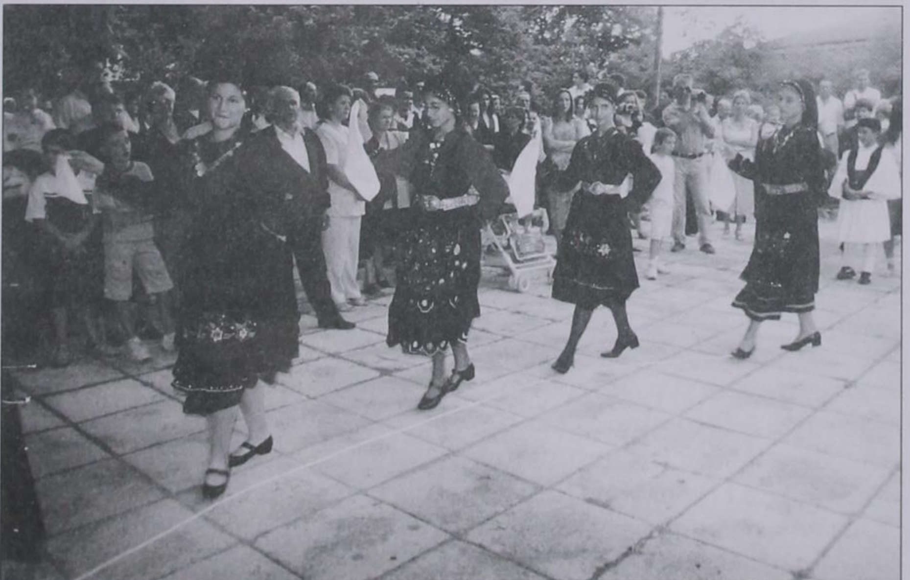
Τα κορίτσια μας σε χορευτικές φιγούρες στην πλατεία μας.