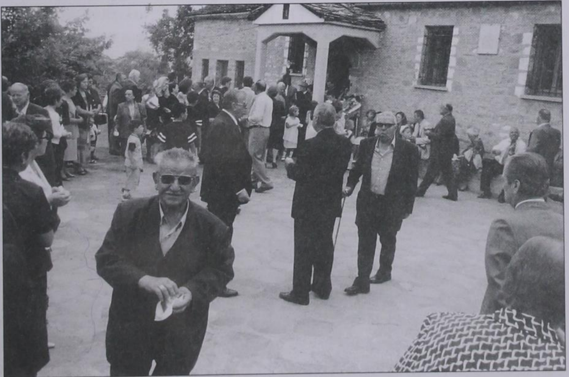
Εκκλησία Αγ. Παρασκευής.

Η λαϊκή κομπανία σε στιγμές που «παίζει» επιτραπέζια τραγούδια (νουμπέτια).