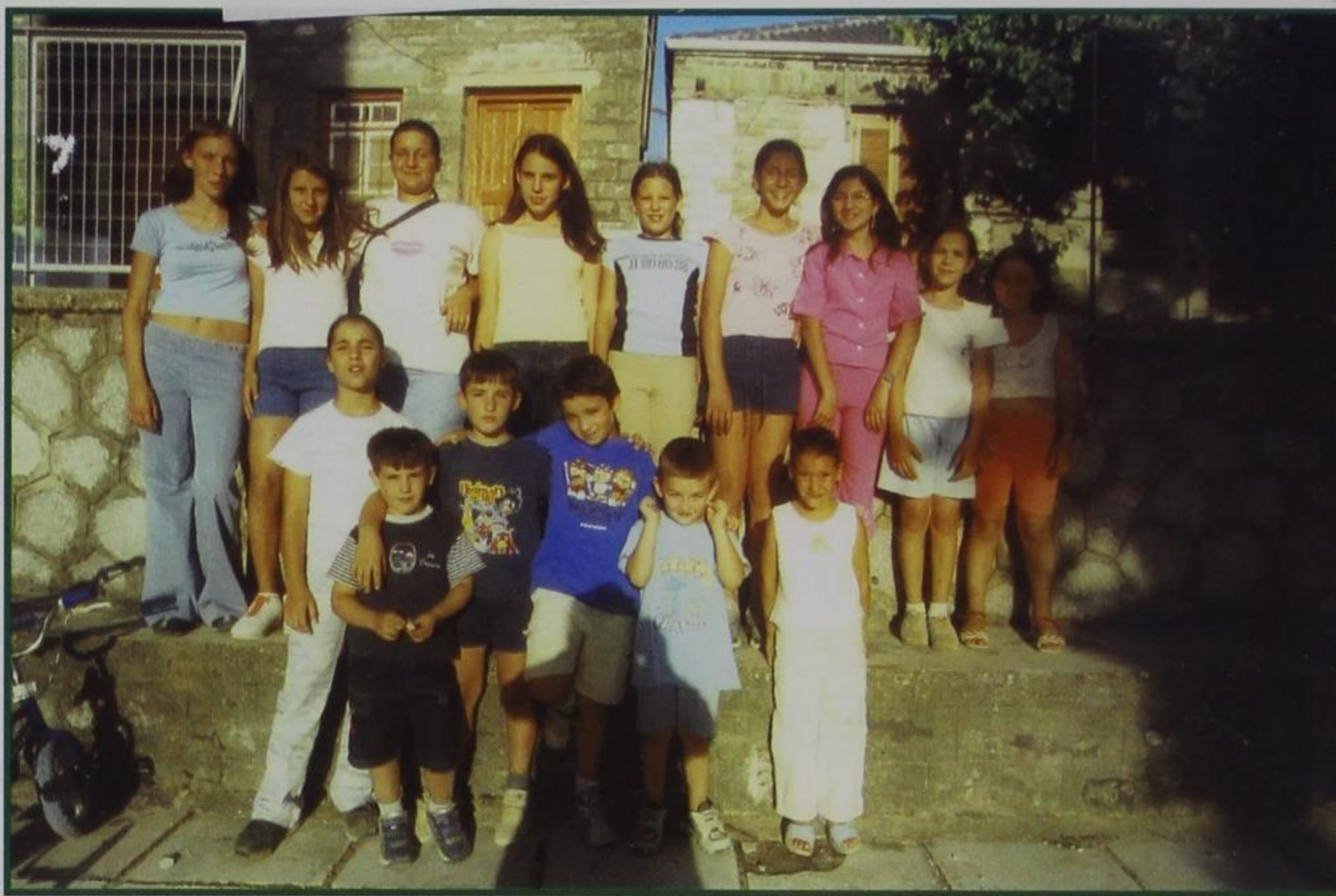
Μια ομάδα από Κιρασοβιτόπουλα τον Ιούλιο μήνα του 2002 στο χωριό μας.