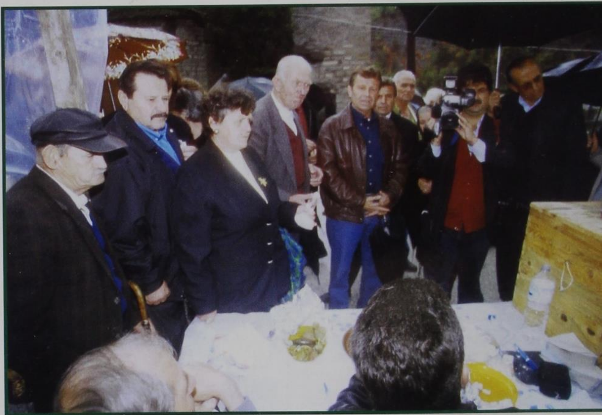
Οι Κιρασοβίτες ψηφίζουν στην ΥΠΑΙΘΡΙΑ ΚΑΛΠΗ την ΑΠΟΧΗ.

ΠΑΝΕΠΙΣΤΗΜΙΟ ΙΩΑΝΝΙΝΩΝ ΦΙΛ. ΣΧΟΛΗ - ΛΑΟΓΡΑΦ. 453 32 ΙΩΑΝΝΙΝΑ