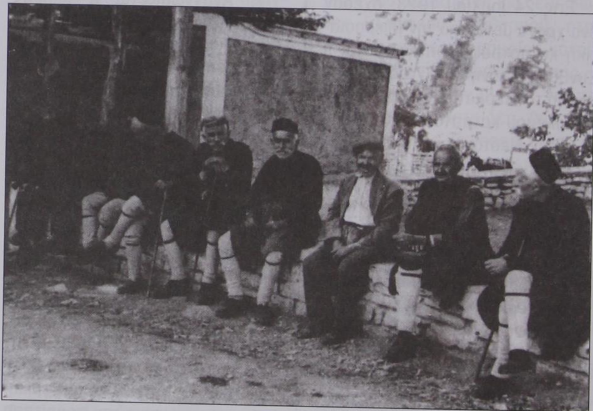
Οι εικονιζόμενοι γέροι του χωριού μας, το 1922 ήταν μαχητές στην Μ. Ασία.