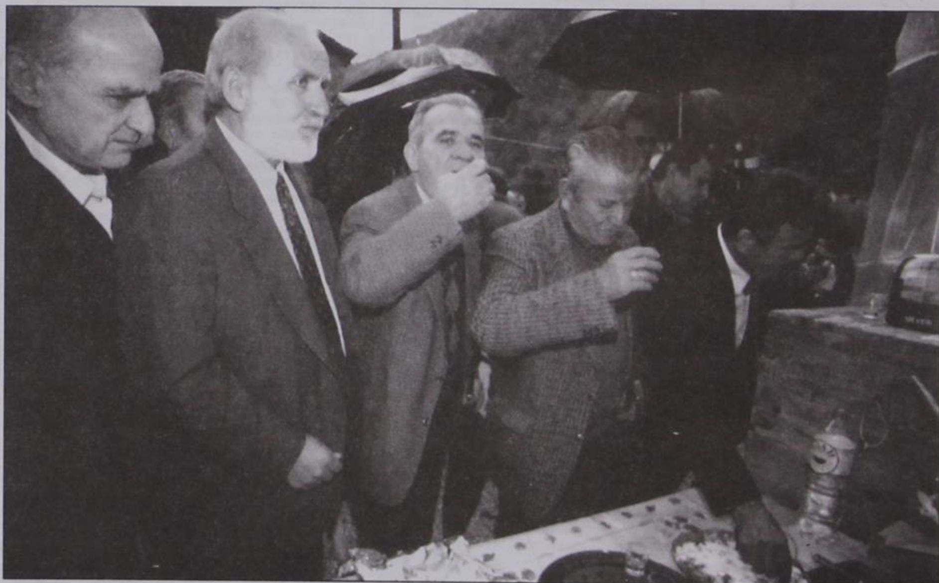
Φωτό: Κερασοβίτες πανηγυρίζουν την ΑΠΟΧΗ.

Το πιο δυνατό και ξεκάθαρο μήνυμα αυτών των εκλογών το έδωσε το Κεράσοβο και από την πρώτη Κυριακή. Επί 1.000 εγγεγραμμένων ψηφοφόρων, σημειώθηκε αποχή 99%.