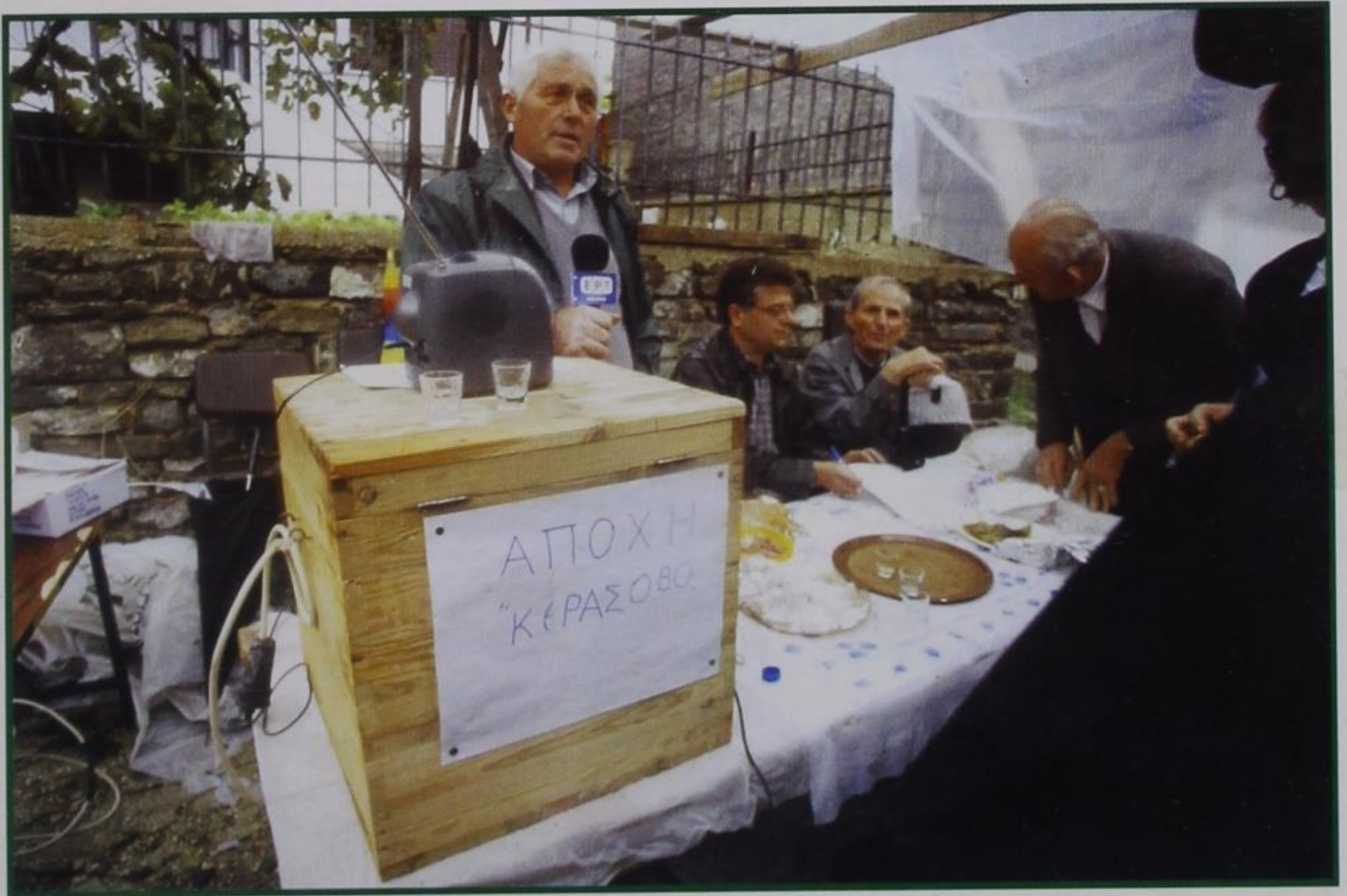
Δημοτικές-Νομαρχιακές Εκλογές 13 Οκτωβρίου 2002. ΑΠΟΧΗ ΚΕΡΑΣΟΒΙΤΩΝ, ΥΠΑΙΘΡΙΑ ΚΑΛΠΗ.

ΠΕΡΙΟΔΙΚΗ ΕΚΔΟΣΗ ΤΗΣ ΑΔΕΛΦΟΤΗΤΑΣ ΑΓΙΑΣ ΠΑΡΑΣΚΕΥΗΣ ΚΟΝΙΤΣΗΣ-ΙΩΑΝΝΙΝΩΝ ΤΕΥΧΟΣ 84 - ΟΚΤΩΒΡΙΟΣ-ΝΟΕΜΒΡΙΟΣ-ΔΕΚΕΜΒΡΙΟΣ 2002 ΓΡΑΦΕΙΑ: Οδός Κ. ΦΛΩΡΗ 3-5, 113 62 ΑΘΗΝΑ, ΤΗΛ.-FAX: 210-88.27.296