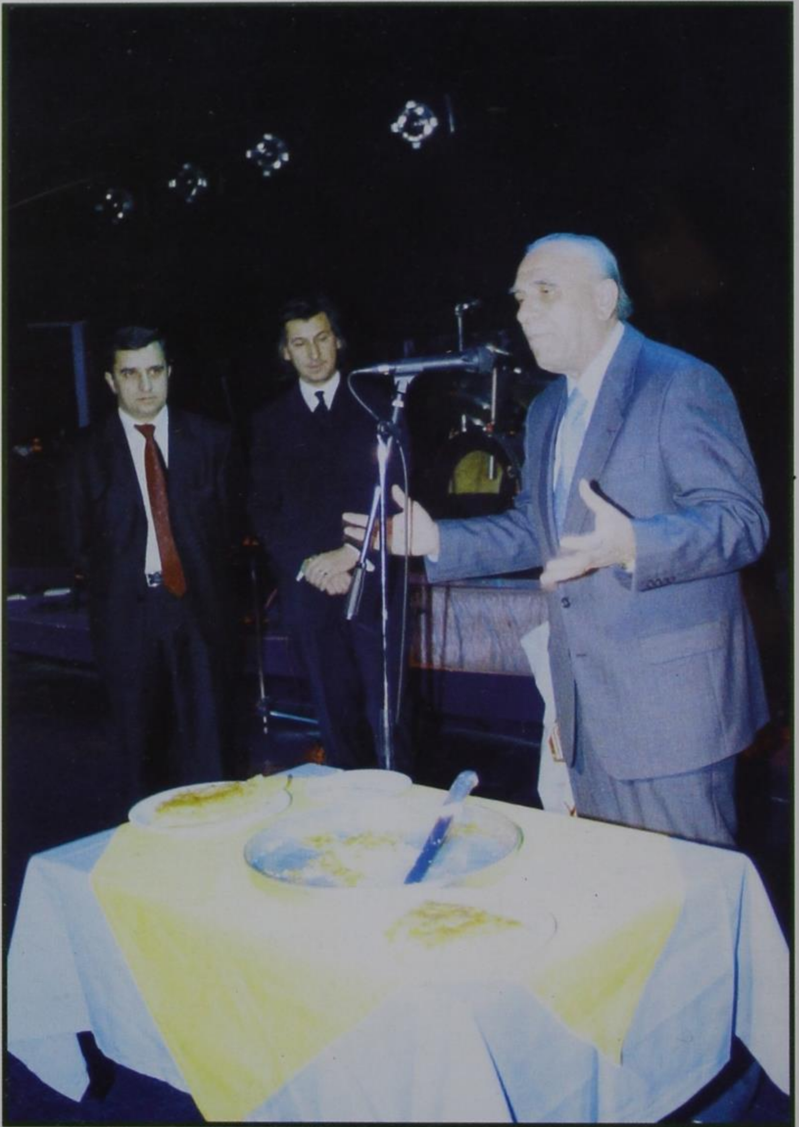
Χαιρετισμός τέως Προέδρου Δ. Σαμαρά στην κοπή της πίτας, και Πρόεδρος - Αντιπρόεδρος Β. Γκούτσιος - Γ. Παπανικολάου.