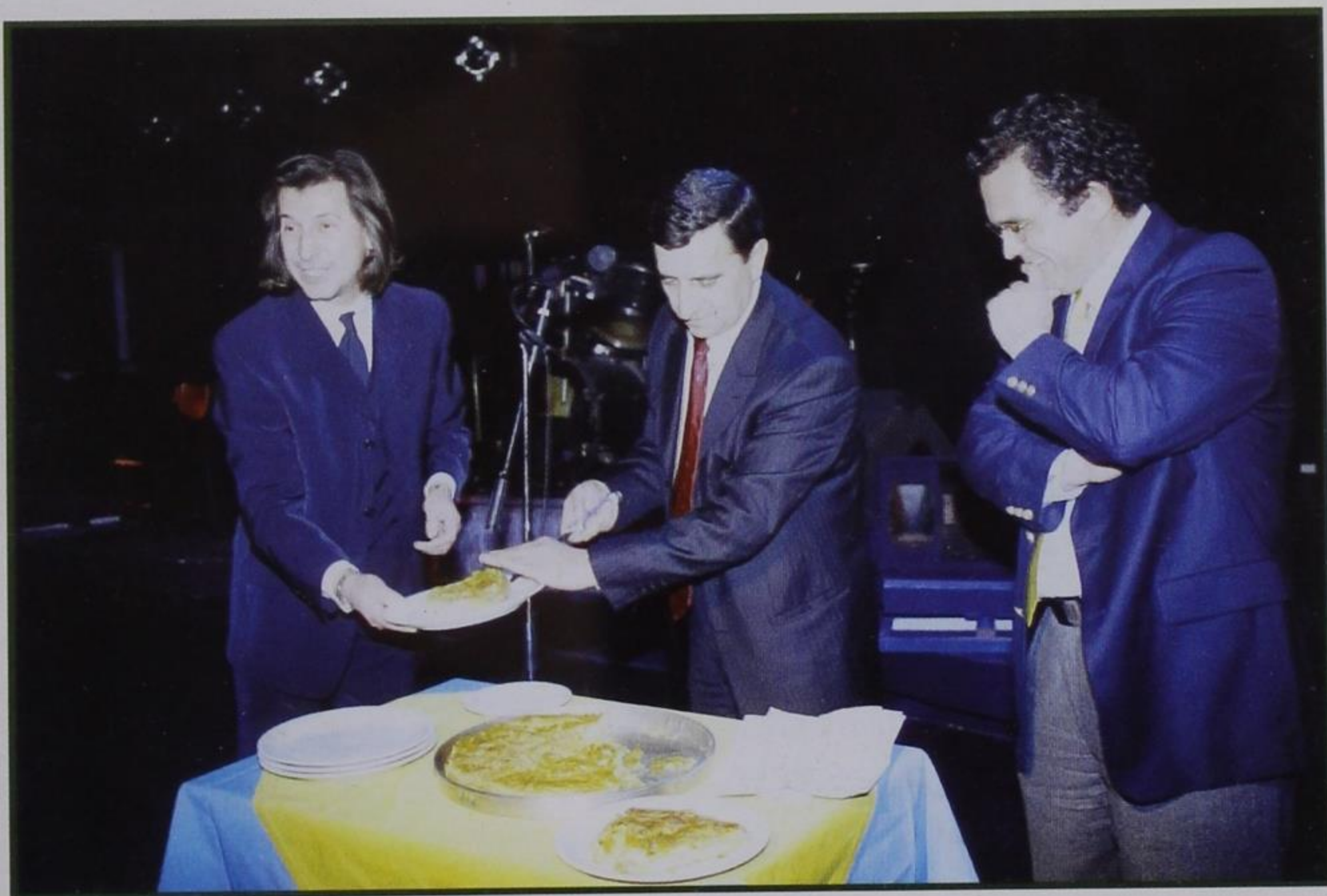
ΚΟΠΗ ΠΙΤΑΣ - ΧΟΡΟΕΣΠΕΡΙΔΑ ΑΔΕΛΦΟΤΗΤΑΣ 2003

ΠΕΡΙΟΔΙΚΗ ΕΚΔΟΣΗ ΤΗΣ ΑΔΕΛΦΟΤΗΤΑΣ ΑΓΙΑΣ ΠΑΡΑΣΚΕΥΗΣ ΚΟΝΙΤΣΗΣ-ΙΩΑΝΝΙΝΩΝ ΤΕΥΧΟΣ 85 - ΙΑΝΟΥΑΡΙΟΣ-ΦΕΒΡΟΥΑΡΙΟΣ-ΜΑΡΤΙΟΣ 2003 ΓΡΑΦΕΙΑ: Οδός Κ. ΦΛΩΡΗ 3-5, 113 62 ΑΘΗΝΑ, ΤΗΛ.-FAX: 210-88.27.296