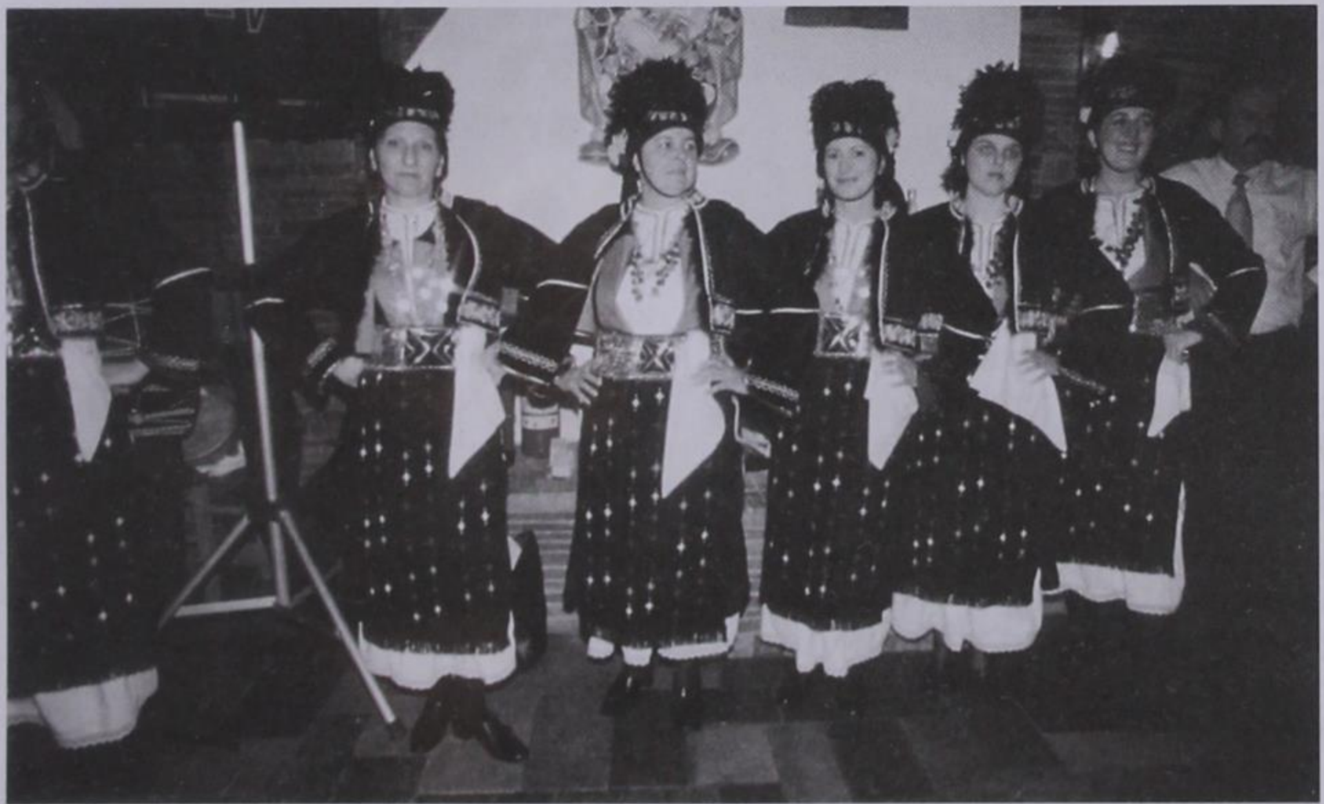
Γυναίκες του χορευτικού της Φραντζής με τοπικές ενδυμασίες