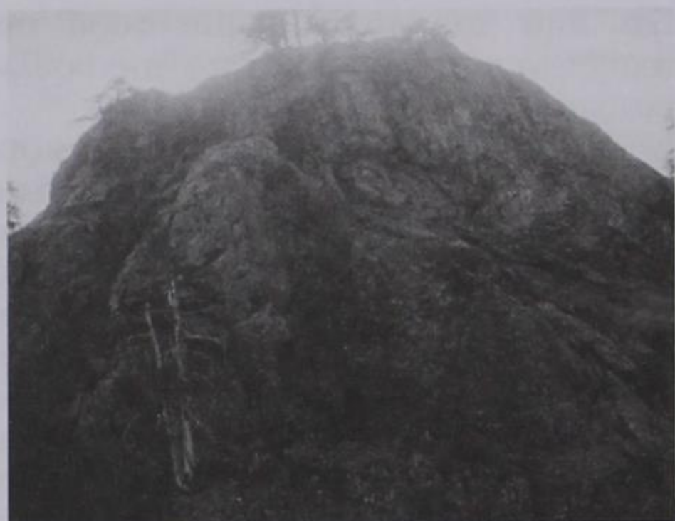
Ο γκροϊζόμαυρος Σμολινγκίσιος βράχος στη θέση Στρούγγες Ζηκιάων. (17/07/2003)