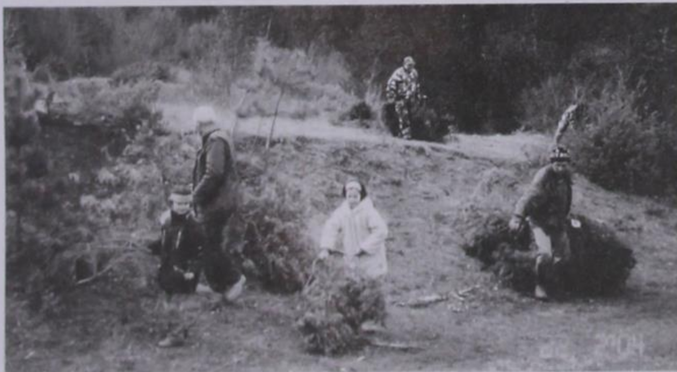
Κοπή των κέδρων στο δάσος για την μεγάλη αποκριάτικη φωτιά.