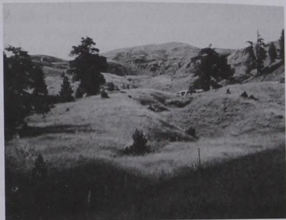
Λιβάδεια ψηλά στο Σμόλινγκα. (17/07/2003)