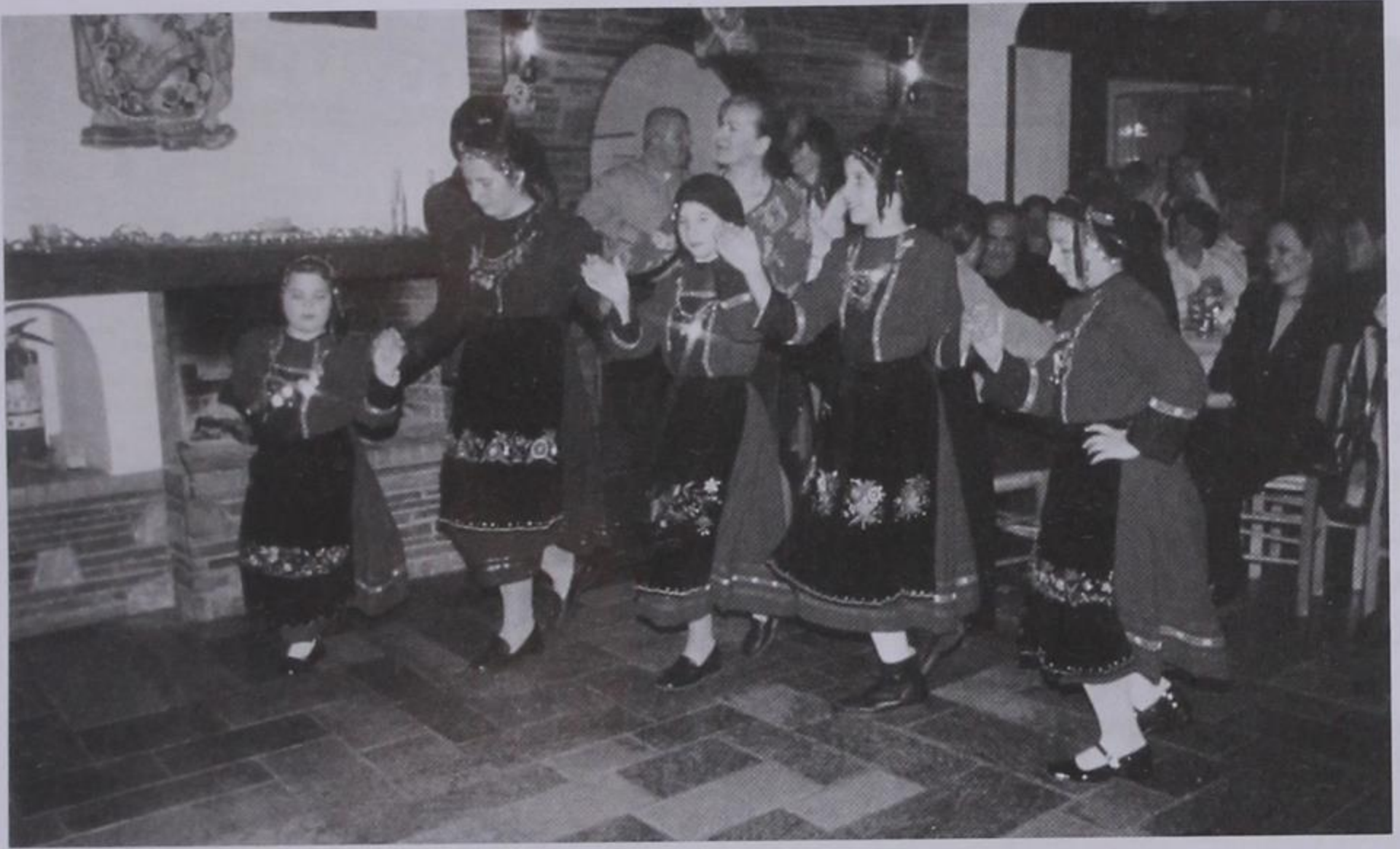
Κορίτσια του χωριού μας χορεύοντας παραδοσιακούς χορούς