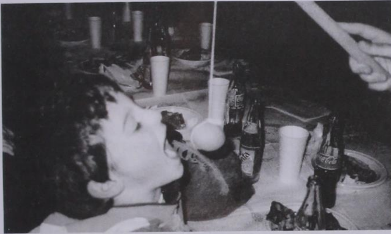
Το βραστό αυγό την ώρα του «χάσκα».