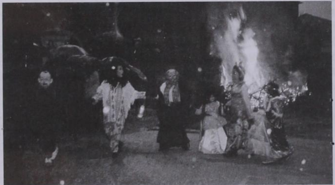
Καρναβάλια χορεύουν μπροστά στη φωτιά της αποκριάς.