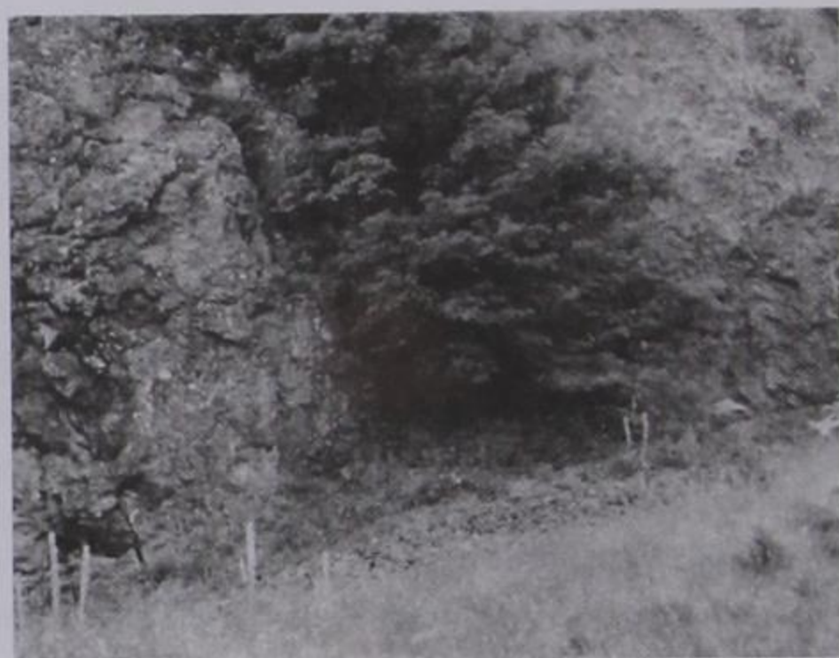
Εδώ που υπάρχει το δέντρο και μπροστά αμμοχάλικο, ήταν η είσοδος στο λημέρι των Κοιμπαίων ληστών. (17/07/2003)