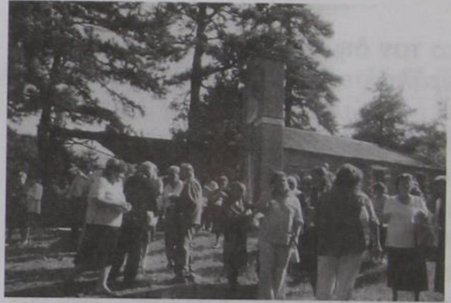
Προφήτης Ηλίας. Χωριανή μας μετά την θεία λειτουργία.