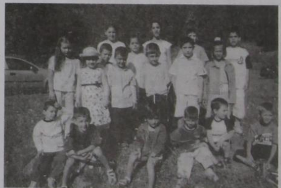
Παιδιά του χωριού μας. Καμαρώστετα.