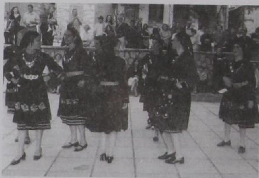
Οι καπέλες του χωριού μας σε χορευτική φιγούρα.