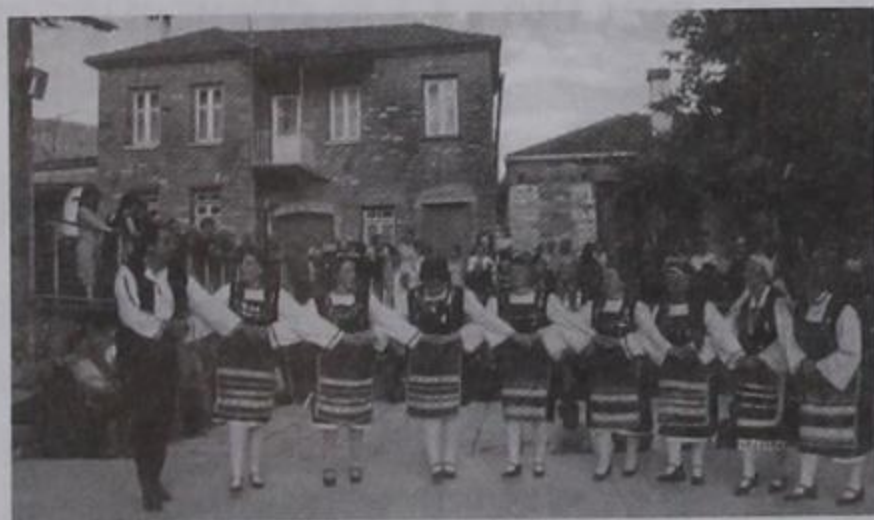
Στιγμιότυπο από τον όμορφο χορό της Ανατολικής Θράκης.