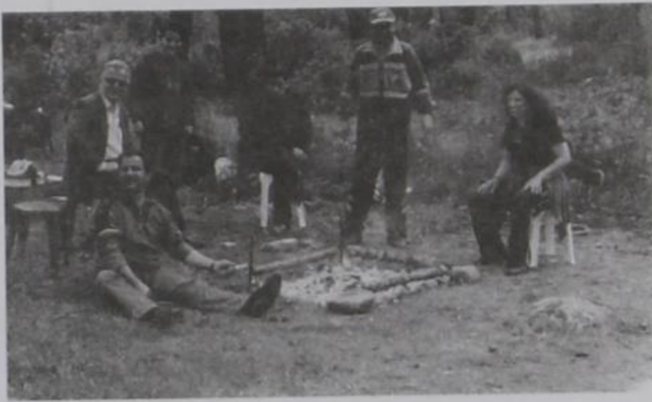
Μάης 2004 «Ώρα για κοκορέτσι».

Λόγω πληθώρας επικαίρου ύλης δεν δημοσιεύσαμε και άλλες φωτό απο την πρω- τομαγιά αυτή. Αυτό κάνουμε τώρα για να μη δημιουργούνται παράπονα απο τα μέλη μας, κυρίως τα εκλεκτά μας.