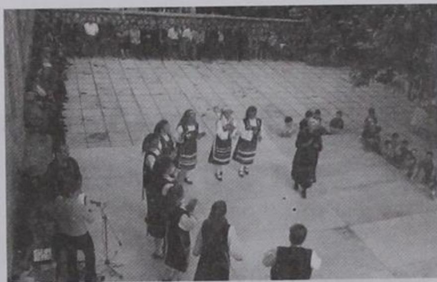
Ο γυναικείος όμιλος να χορεύει και οι Κιρασοβίτες να παρακολουθούν καθισμένοι γύρο-γύρο στη πλατεία του χωριού μας