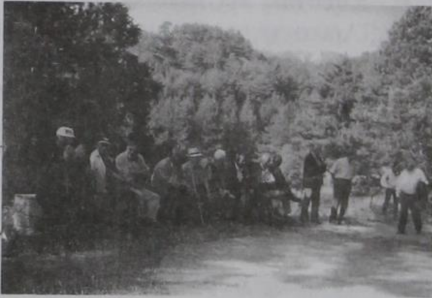
Προφήτης Ηλίας. Χωριανή μας καθισμένη στο προαύλιο της Εκκλησίας.