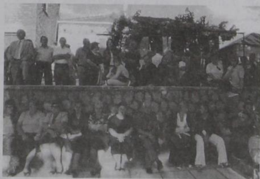
Κιρασοβίτες-τισσες παρακολουθούν τους χορούς στο Μεσοχώρι.