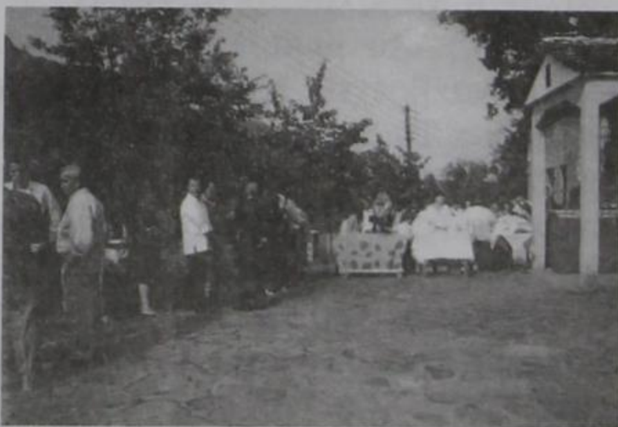
Αγία Παρασκευή. Οι χωριανοί μας στο προαύλιο της Εκκλησίας.