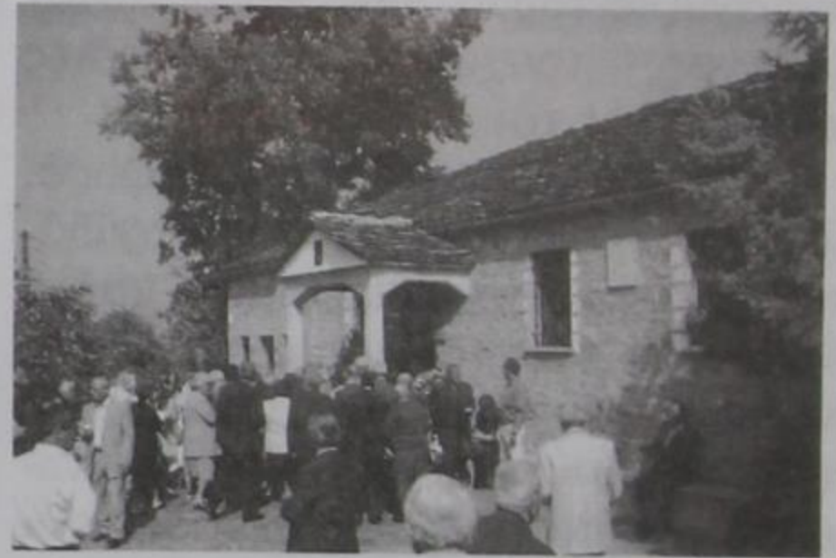
Αγία Παρασκευή. Οι χωριανοί μας παρακολουθούν την θεία λειτουργία.