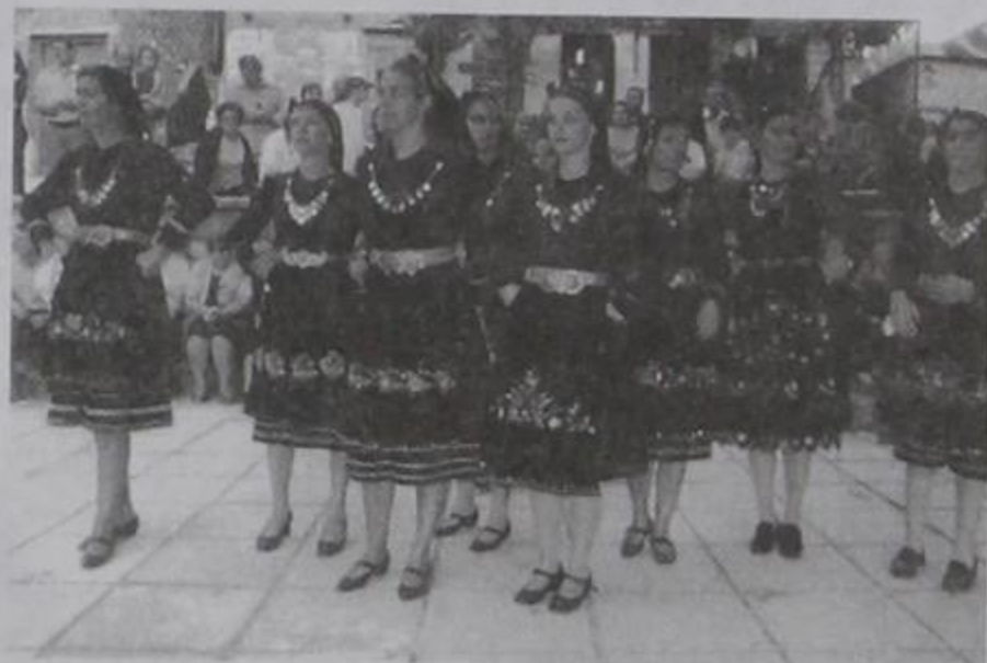
Οι κοπέλες του χωριού μας με τις πανέμορφες Κιρασοβίτικες στολές χορεύουν στο Μεσοχώρι.