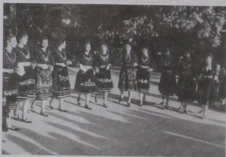
Οι κοπέλες μας χορεύουν Κιρασοβίτικο χορό στο Μεσοχώρι.