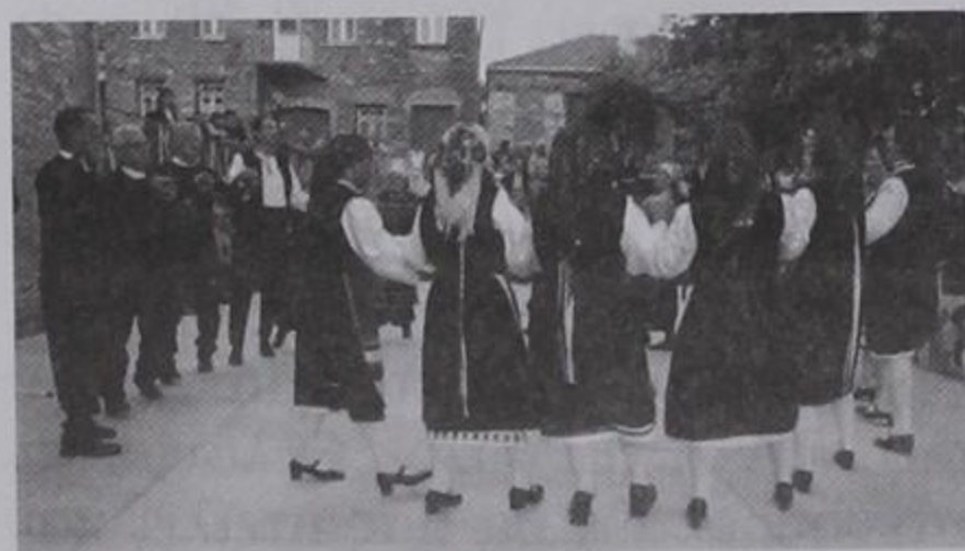
Οι Ποντιακοί Συλλόγοι χορεύοντας στο Μεσοχώρι μας.