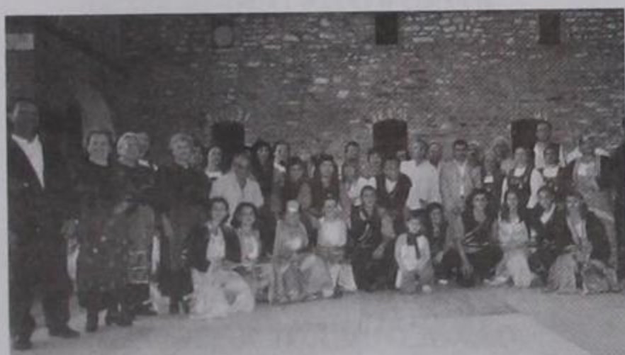
Τα ποντιακά σωματεία σε αναμνηστική φωτογραφία με Κιρασοβίτες-τισσες