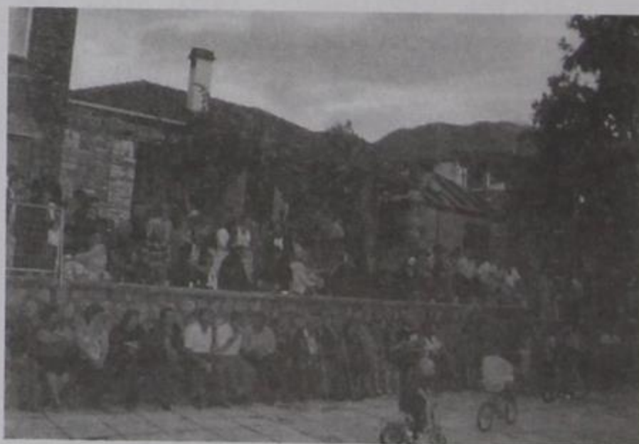
Όλο το χωριό μας παρακολουθεί και καμαρώνει τα παιδιά που χορεύουν.