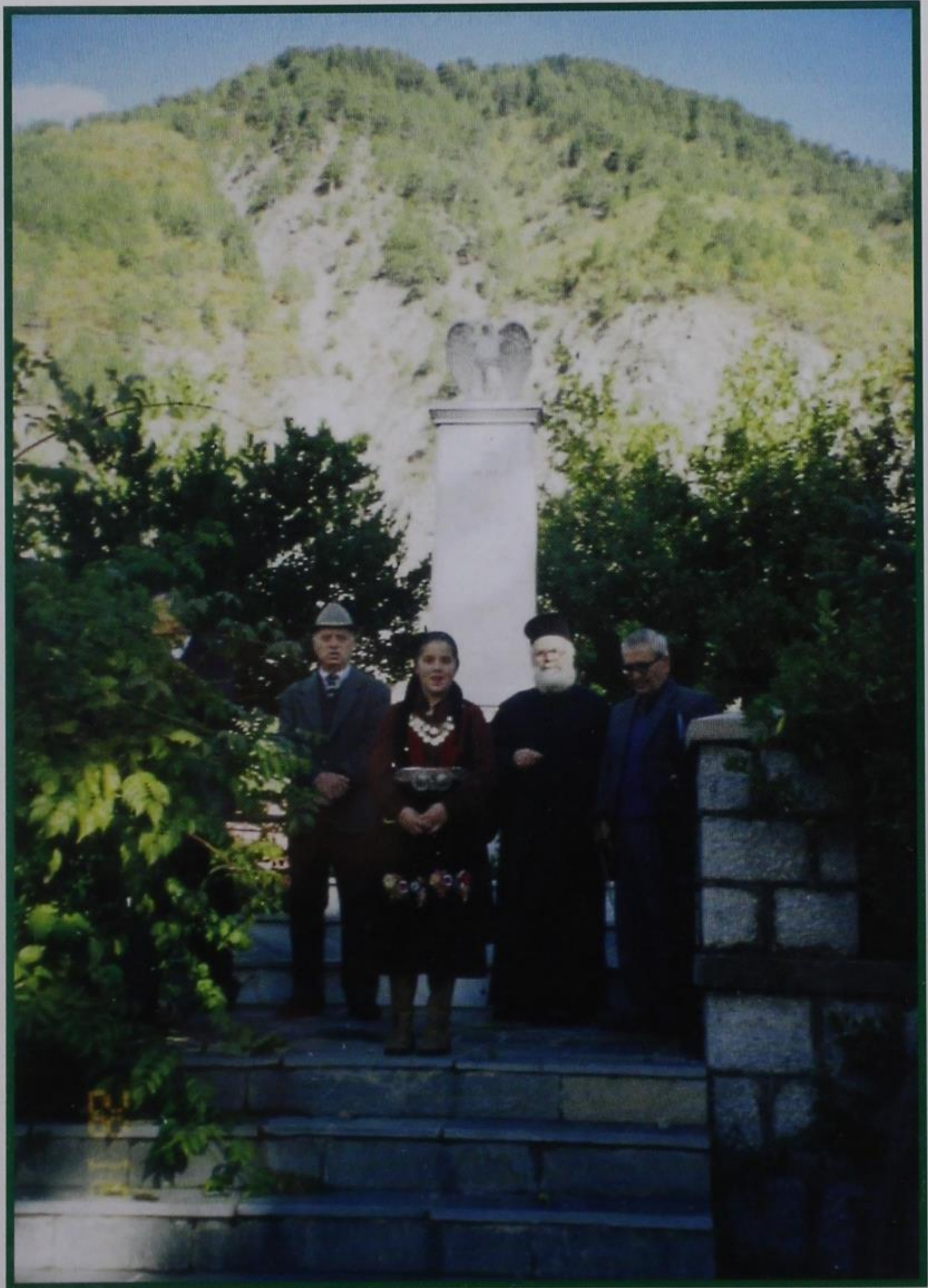
ΜΝΗΜΕΙΟ ΗΡΩΩΝ ΤΟΥ ΧΩΡΙΟΥ ΜΑΣ

ΠΕΡΙΟΔΙΚΗ ΕΚΔΟΣΗ ΤΗΣ ΑΔΕΛΦΟΤΗΤΑΣ ΑΓΙΑΣ ΠΑΡΑΣΚΕΥΗΣ ΚΟΝΙΤΣΗΣ-ΙΩΑΝΝΙΝΩΝ Τ Ε Υ Χ Ο Σ 92 - ΟΚΤΩΒΡΙΟΣ - ΝΟΕΜΒΡΙΟΣ - ΔΕΚΕΜΒΡΙΟΣ 2004 ΓΡΑΦΕΙΑ: Οδός Κ. ΦΛΩΡΗ 3-5, 113 62 ΑΘΗΝΑ, ΤΗΛ.-FAX: 210-88.27.296