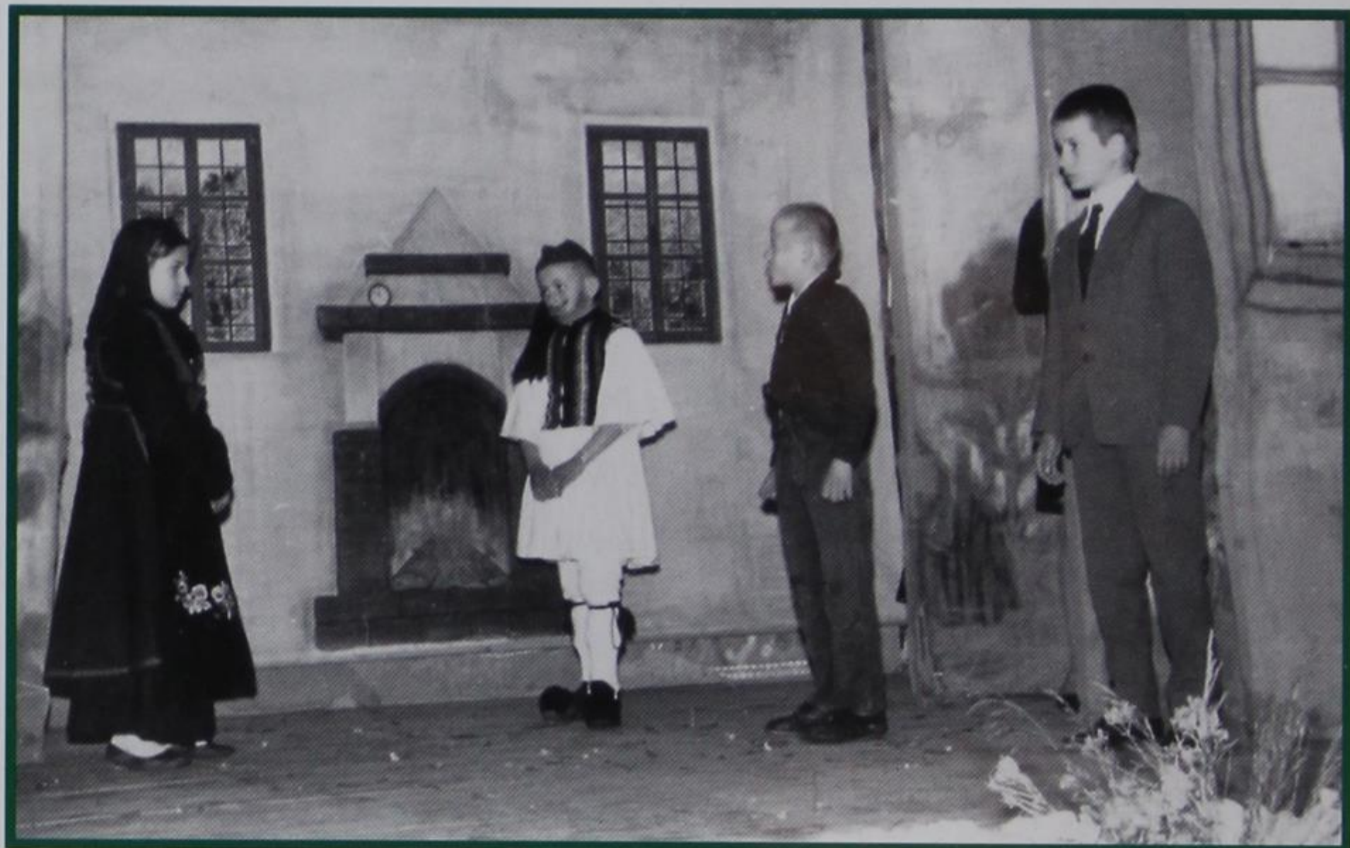
ΑΠΟ ΠΑΙΔΙΚΗ ΠΑΡΑΣΤΑΣΗ ΣΤΟ ΣΧΟΛΕΙΟ ΜΑΣ ΤΑ ΠΑΛΙΑ ΧΡΟΝΙΑ

ΠΑΝΕΠΙΣΤΗΜΙΟ ΙΩΑΝΝΙΝΩΝ ΦΙΛ. ΣΧΟΛΗ-ΛΑΟΓΡΑΦ. 453 32 ΙΩΑΝΝΙΝΑ