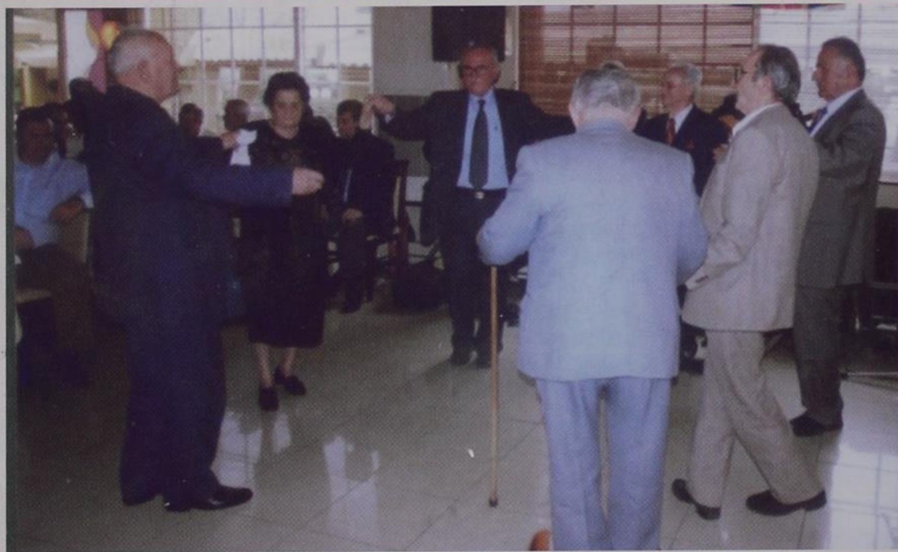
Οι γέροντες του χωριού μας πάντα λεβέντες. Χορός 2007.

ΤΕΥΧΟΣ 101 ● ΙΑΝΟΥΑΡΙΟΣ - ΦΕΒΡΟΥΑΡΙΟΣ - ΜΑΡΤΙΟΣ 2007