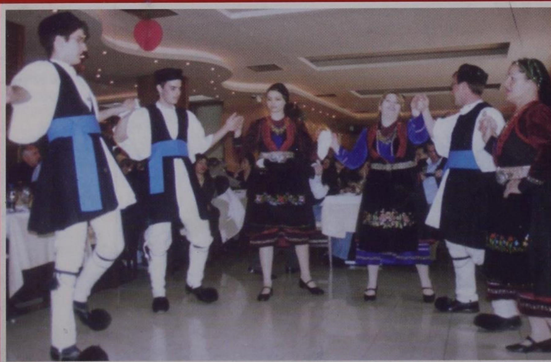
Το χορευτικό των μεγάλων παιδιών στο χορό της Αδελφότητας 2007.