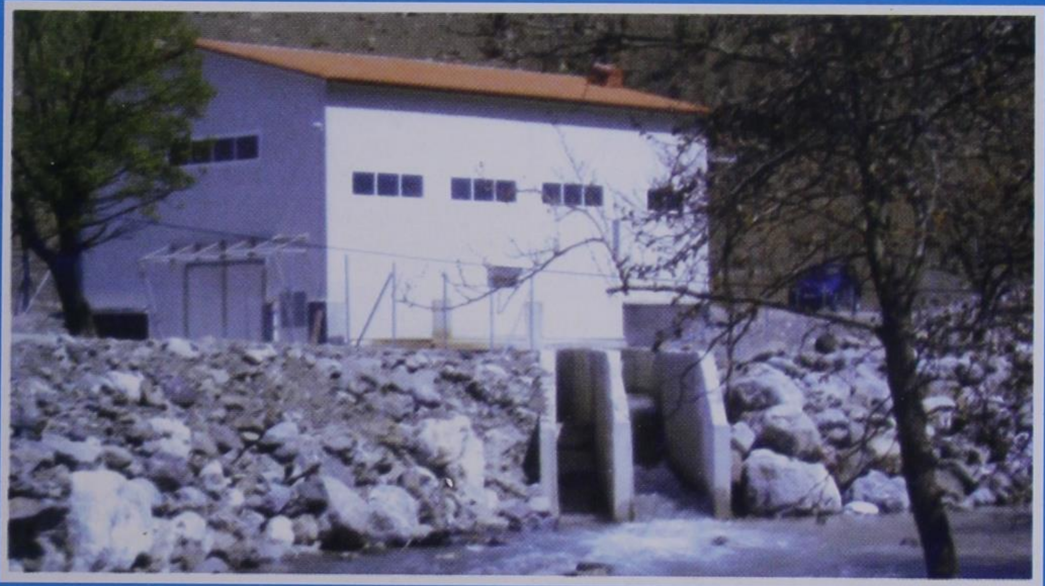
Το υδροηλεκτρικό εργοστάσιο Κερασόβου.

ΤΕΥΧΟΣ 102 ● ΑΠΡΙΛΙΟΣ & ΜΑΪΟΣ - ΙΟΥΝΙΟΣ 2007