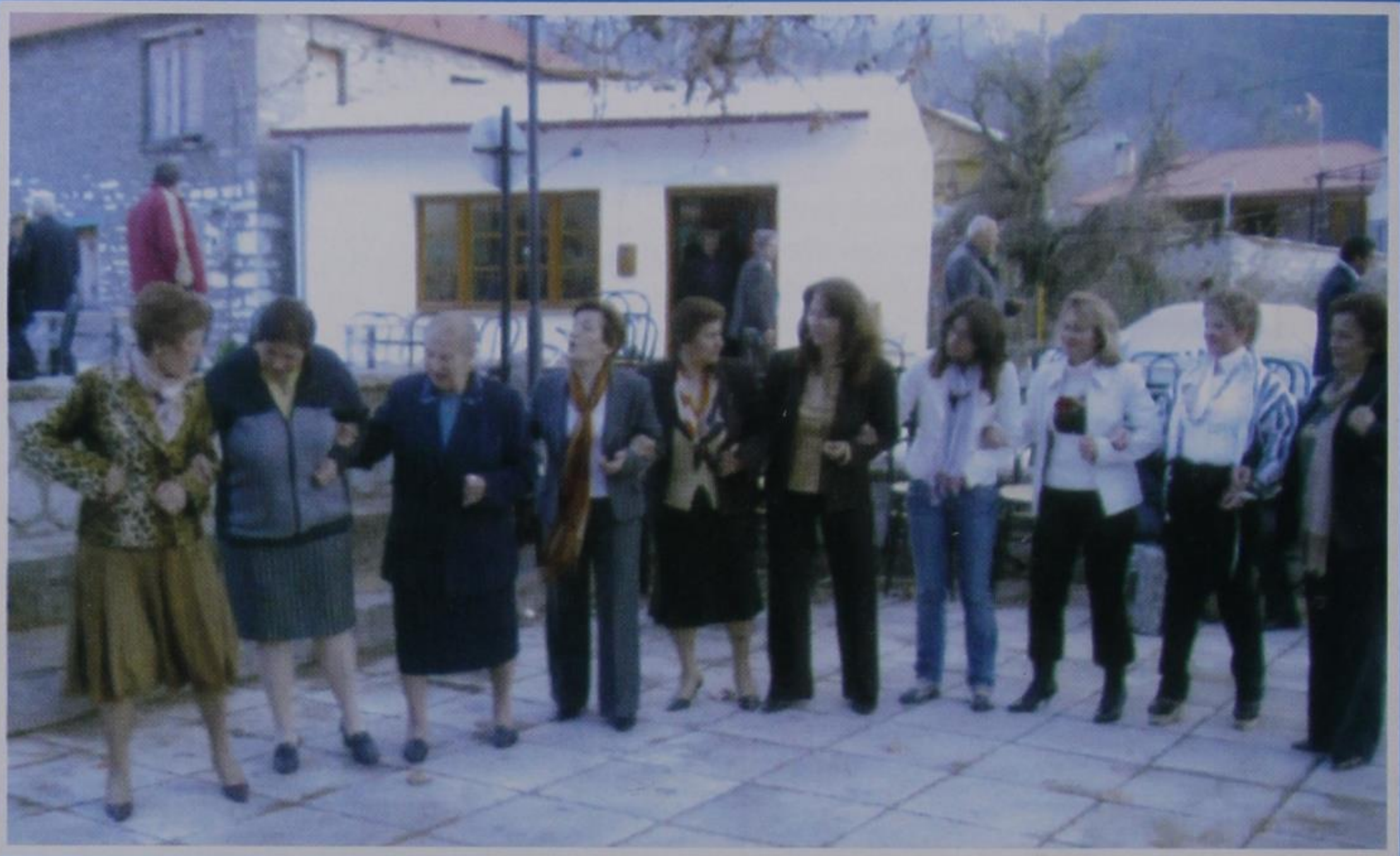
Πάσχα στο χωριό.