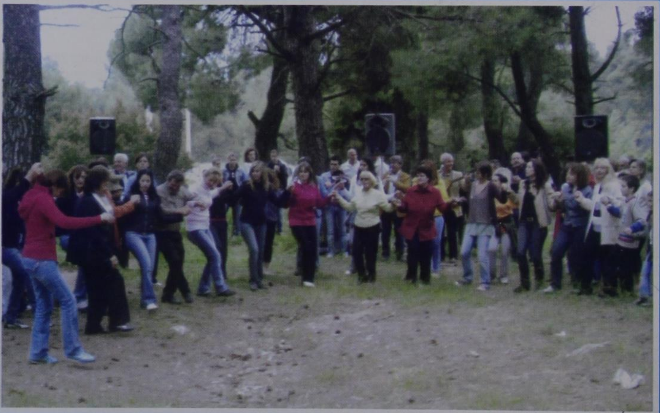
Πρωτομαγιά της Αδελφότητας στον Διόνυσο Αττικής