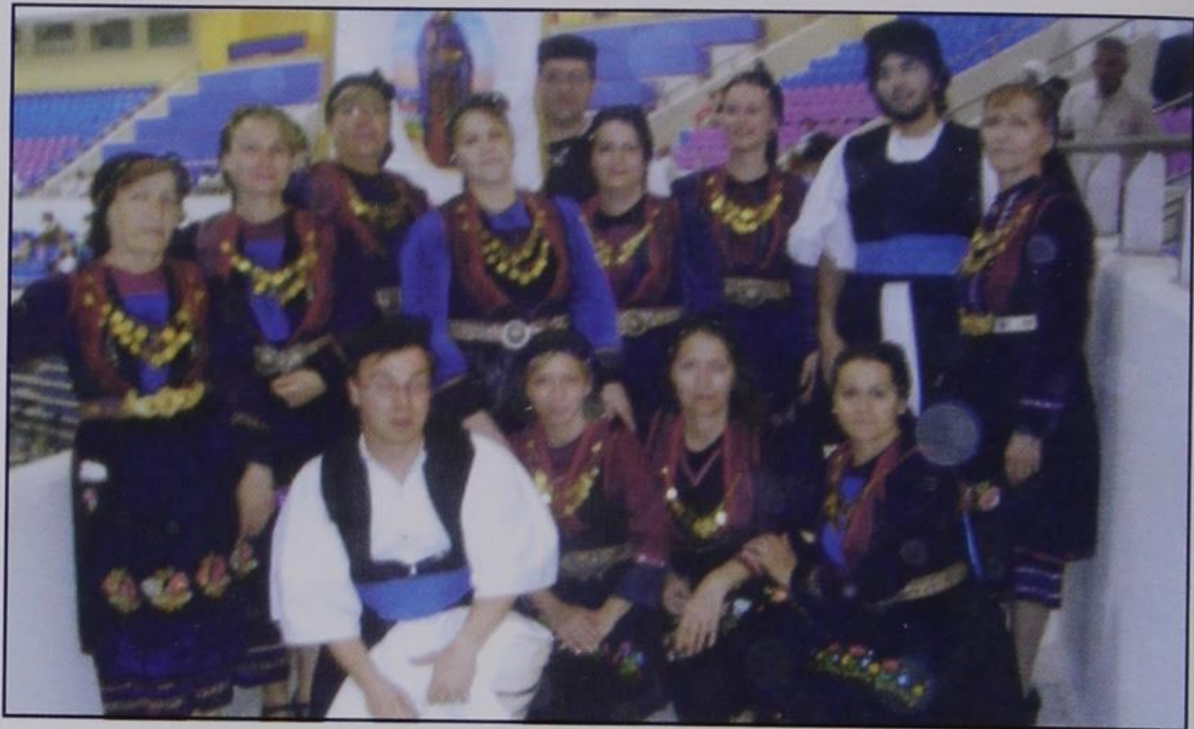
Το χορευτικό μας συγκρότημα στη Γιορτή της Unesco.

Ήταν μια μεγαλειώδης εκδήλωση, πλούσια σε χρώματα και μουσικές. Όταν άρχισε η παρουσίαση των χορευτικών συγκροτημάτων πλημμύρισε η αίθουσα με νέα παιδιά ντυμένα με κάθε λογής παραδοσιακές φορεσιές: Ηπειρώτες, Μακεδόνες, Ρωμυλία, Πελοπόννησος, Ρούμελη, Πόντος, Κρήτη και Μικρά Ασία. Ξετυλίχτηκε μπροστά μας το μεγαλείο μιας άλλης Ελλάδας, της Ελ-