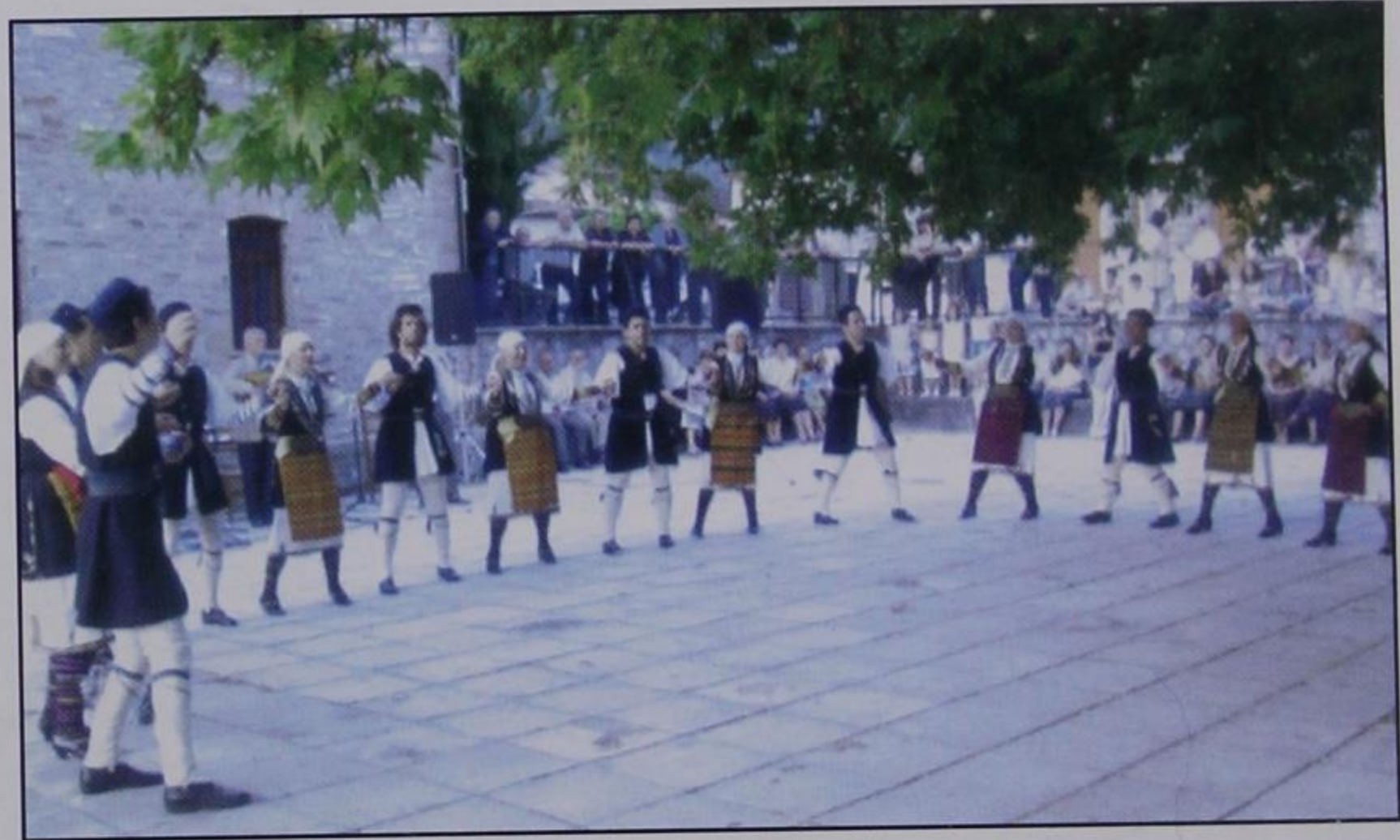
Το χορευτικό των Καλαρρυτών.

τος από τους Καλαρρυίτες Ιωαννίνων . Ένα χωριό μικρό σε πληθυσμό, αλλά με τεράστια προσφορά στην παράδοση. Οι επιβλητικές φορεσιές του και η ακρίβεια στις χορευτικές του κινήσεις, άφησαν τις καλύτερες εντυπώσεις στους θεατές.