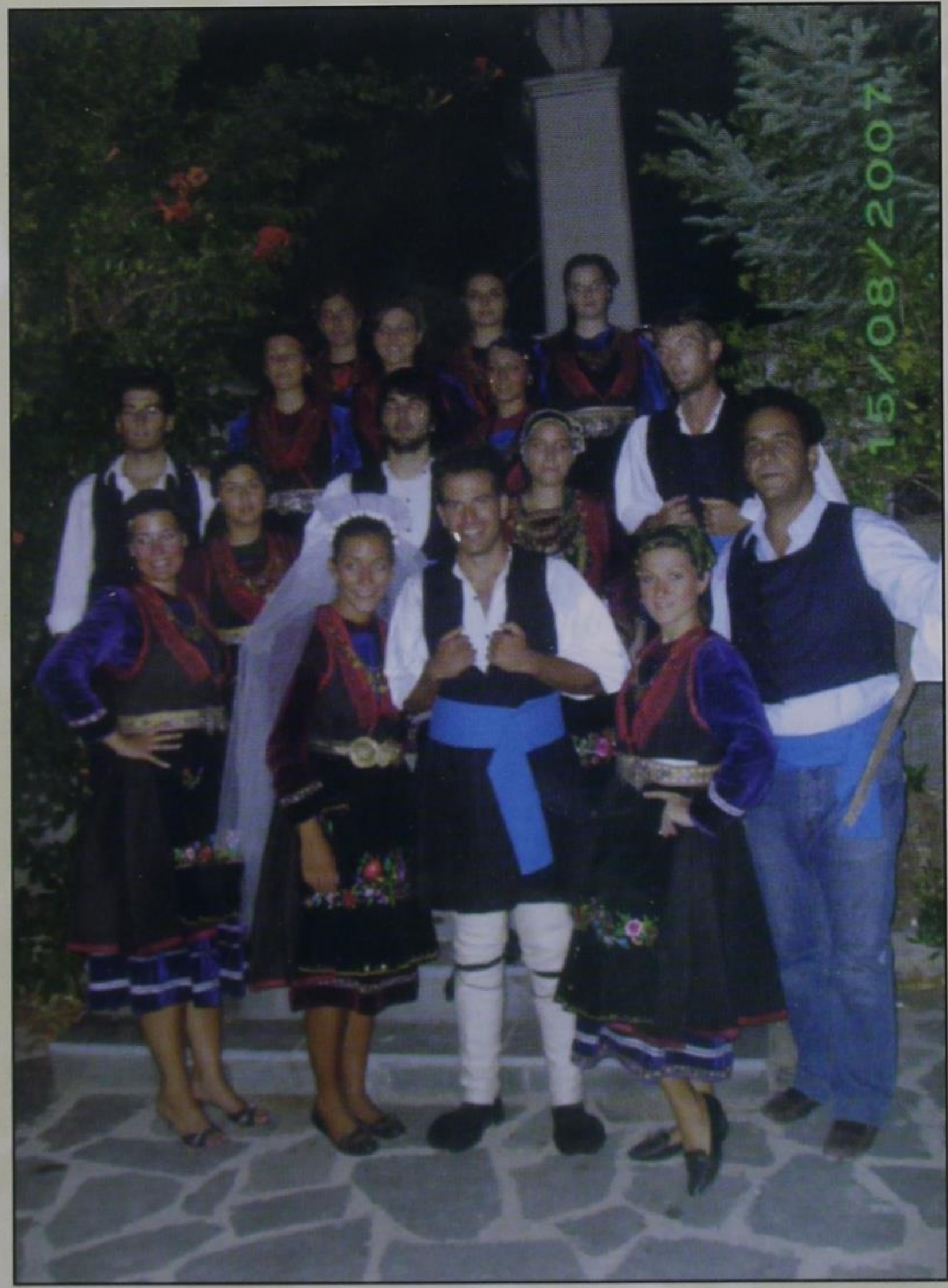
Οι νέοι του χωριού μας που αναπαράστησαν με ιδιαίτερο κέφι και ζωντάνια τον παραδοσιακό Κερασοβίτικο γάμο το καλοκαίρι που μας πέρασε στο χωριό.

ΤΕΥΧΟΣ 103 ● ΙΟΥΛΙΟΣ - ΑΥΓΟΥΣΤΟΣ - ΣΕΠΤΕΜΒΡΙΟΣ 2007