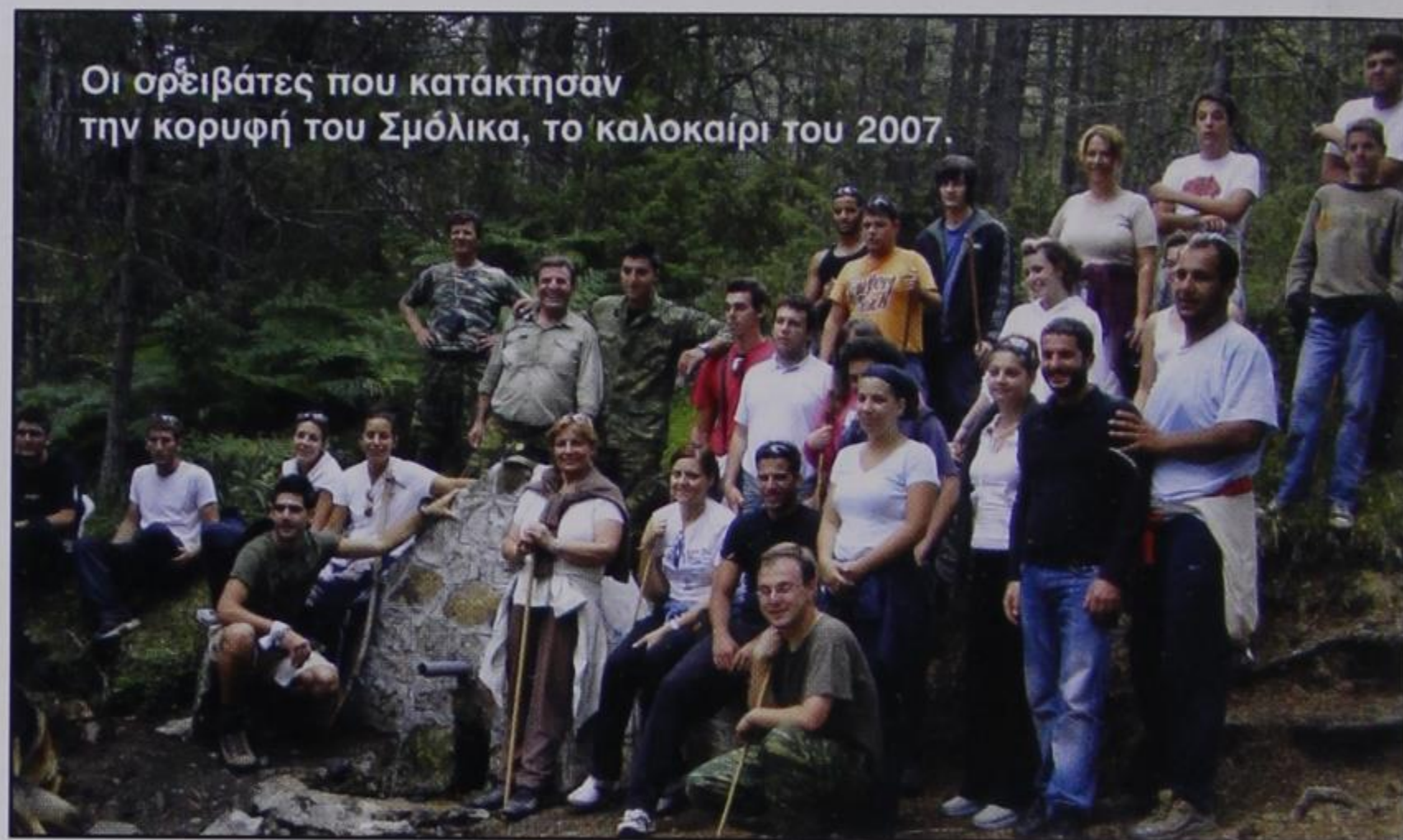
Οι ορειβάτες που κατάκτησαν την κορυφή του Σμόλικα, το καλοκαίρι του 2007.

Φουσκωμένος, λοιπόν, σαν κοκόρι, κάθομαι στο τραπέζι του καφεενείου και πριν καν μιλήσω, τρώω την πρώτη «σφαλιάρα». Από την κουβέντα, γρήγορα αποκαλύφθηκε ότι, πριν είκοσι χρόνια, μία ομάδα χωριανών, αρκετοί εκ των οποίων συγγενείς μου, οργάνωσαν εκδρομή στη Δρακολίμνη. Ξεκινώντας από τη Δροσοπηγή , ανέβηκαν στον Προφήτη Ηλία Φούρκας , κινήθηκαν προς Σαμαρίνα και από κει, αφού χάθηκαν, ύστερα από τις οδηγίες κάποιου βλάχου βοσκού, βρέθηκαν στη Δρακολίμνη. Διανυκτέρευσαν εκεί, καθώς έφτασαν αργά το απόγευμα και μάλιστα πολύ χαρακτηριστικά