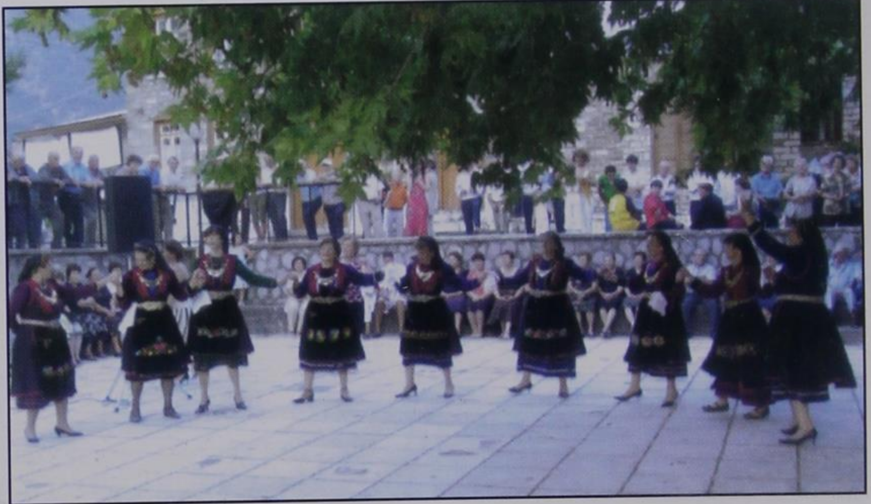
Το χορευτικό του χωριού μας.

Ιδιαίτερο χρώμα και ύφος έδωσε φέτος στο πανηγύρι μας η παρουσία 20μελούς χορευτικού συγκροτήμα-