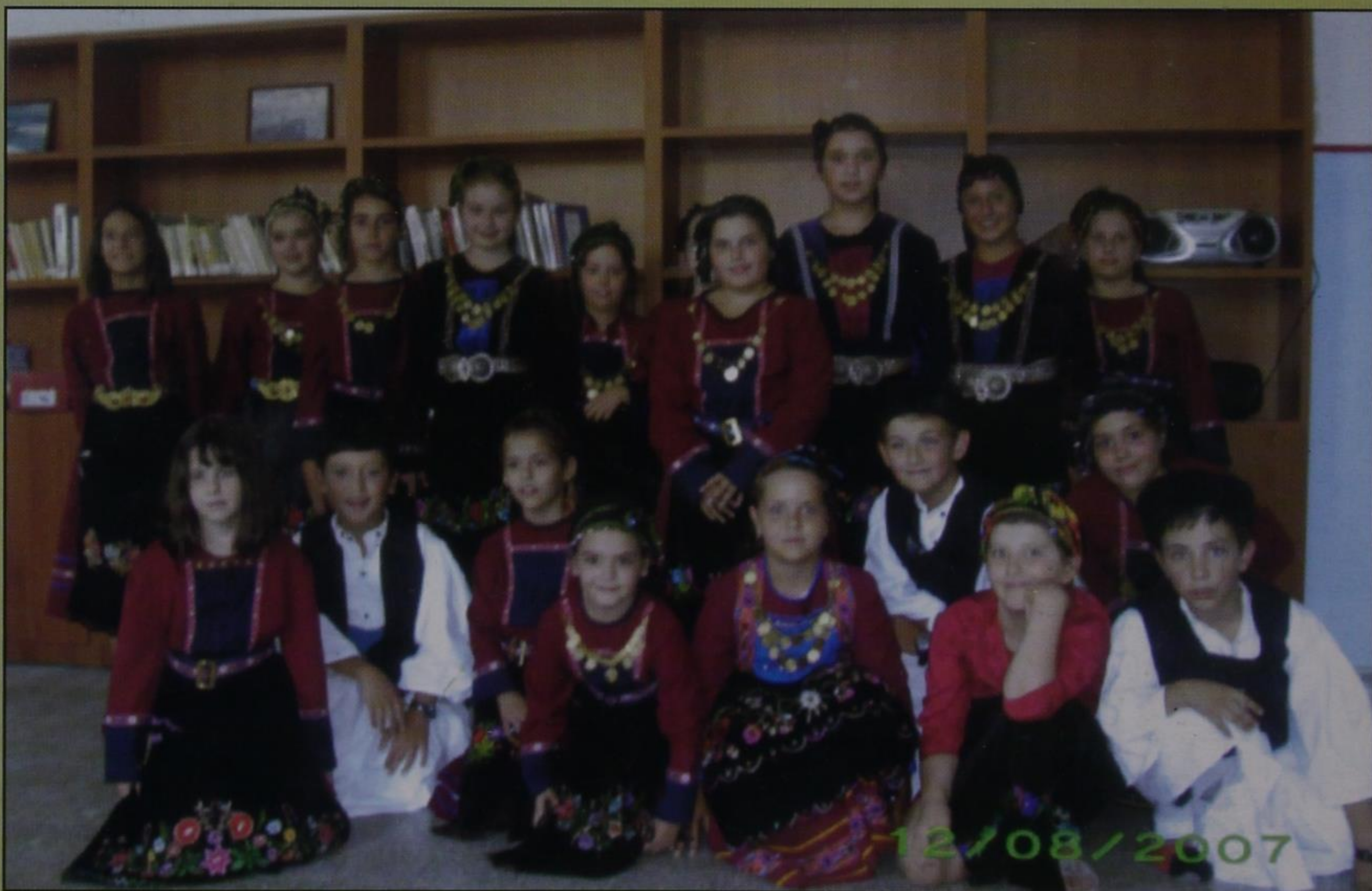
Το παιδικό Χορευτικό Τμήμα του χωριού μας, που πήρε μέρος στις εκδηλώσεις «Κερασοβίτικα 2007».