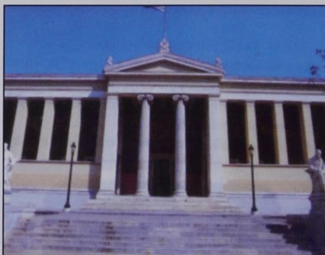
Η πρόσοψη του Εθνικού Καποδιστριακού Πανεπιστημίου Αθηνών.

Στην Αθήνα της εποχής εκείνης με τους λίγους κατοίκους, ελάχιστα ήταν τα κτίρια που περιστοίχιζαν τον ιερό βράχο της Ακροπόλεως, περί 800 τον αριθμό. Ένα από αυτά στην Πλάκα, στην οδό Θόλου (σήμερα μουσείο της ιστορίας του Πανεπιστημίου Αθηνών) ήταν κτίριο τριώροφο, 1816 τεκτονικών πήξεων, που μισθώνεται από τον ιδιοκτήτη του αρχιτέκτονα Κλεάνθη, από το κράτος για να