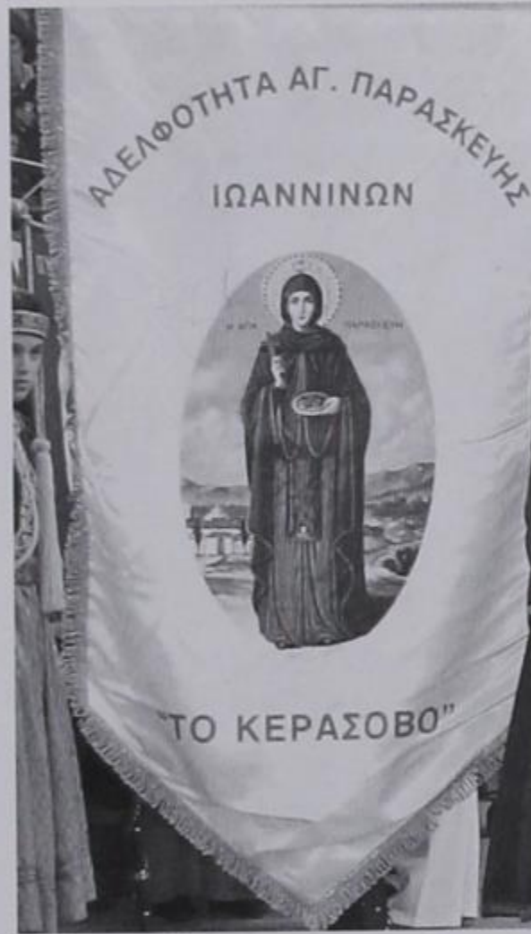
Το λάβαρο της Αδελφότητας.

Και στο θέμα της διατήρησης του λαϊκού μας πολιτισμού και της παράδοσης, η Αδελφότητα έχει να επιδείξει αυτά τα 50 χρόνια τεράστιο έργο. Τα χορευτικά τμήματα, με τις γνήσιες παραδοσιακές φορεσιές, δίνουν πάντα το παρών σε μεγάλες εκδηλώσεις, διασώζοντας έτσι την παράδοσή μας από γενιά σε γενιά. Η καταγραφή και η αναβίωση των εθίμων, των παιχνιδιών, του τρόπου ζωής των προγόνων μας, οι θρύλοι και τα τραγούδια μας, διασώθηκαν μέσα από πρωτοβουλίες της