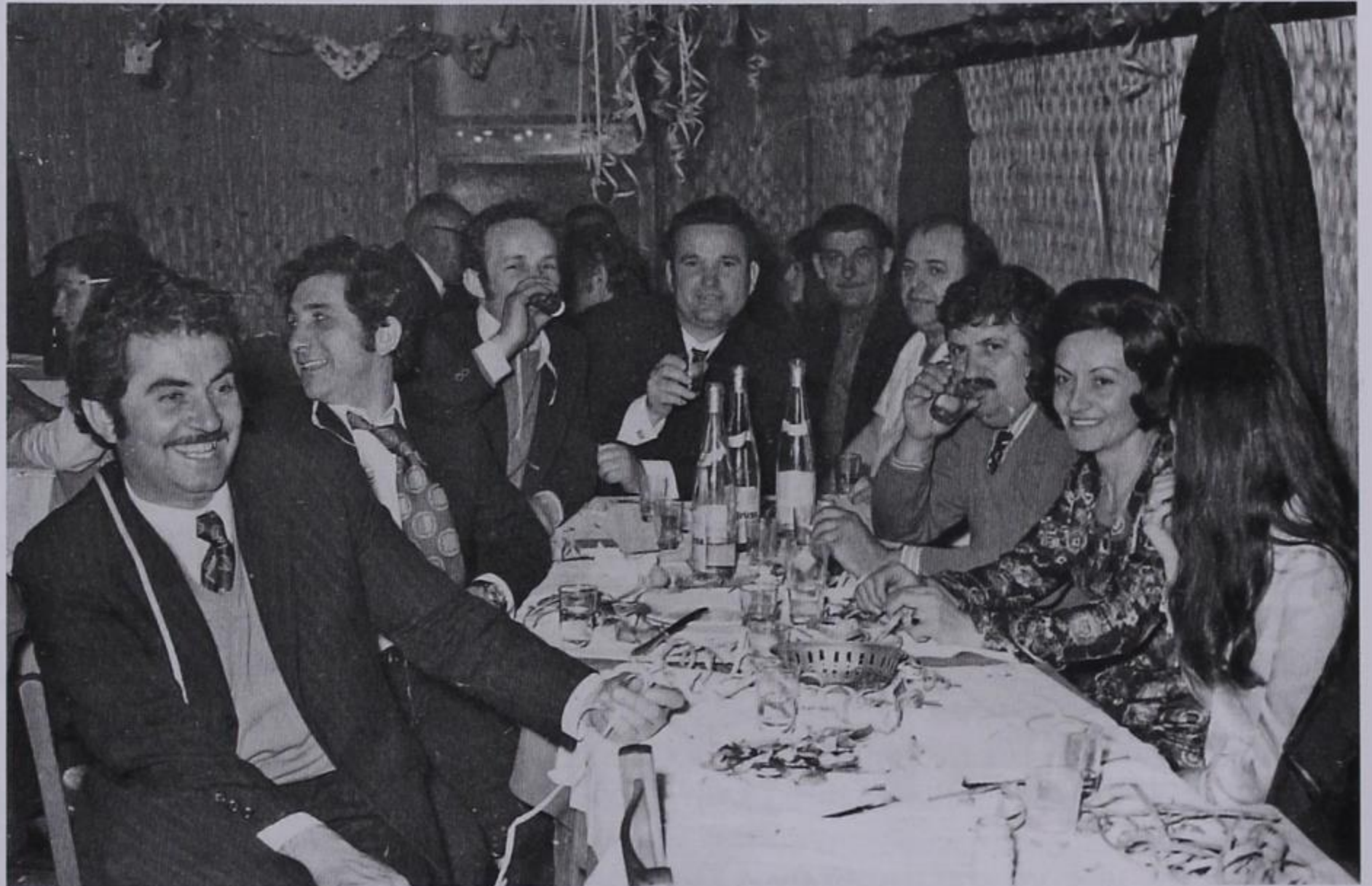
Στιγμιότυπο από τον χορό της Αδελφότητας το 1960.

Τίποτα δεν ήταν απλό κι' εύκολο μήτε υπάρχουν ομοιότητες και συγκρίσεις με το σήμερα. Χρειάστηκε αγώνας και απαιτήθηκαν κόποι και θυσίες απ' τους πρωταγωνιστές. Η παθολογική αγάπη για το Κεράσοβο, ήταν η δύναμη σκέψης, καρδιάς και απόφασής τους, ο φάρος και η πυξίδα τους. Τους ανήκει κάθε ΤΙΜΗ και στους συνεχιστές ΕΥΘΥΝΗ να τους μοιάσουν και να τους ξεπεράσουν. Να γράψουν τη δική τους ιστορία να ΕΚΕΙΝΩΝ τα χρυσά γράμματα!