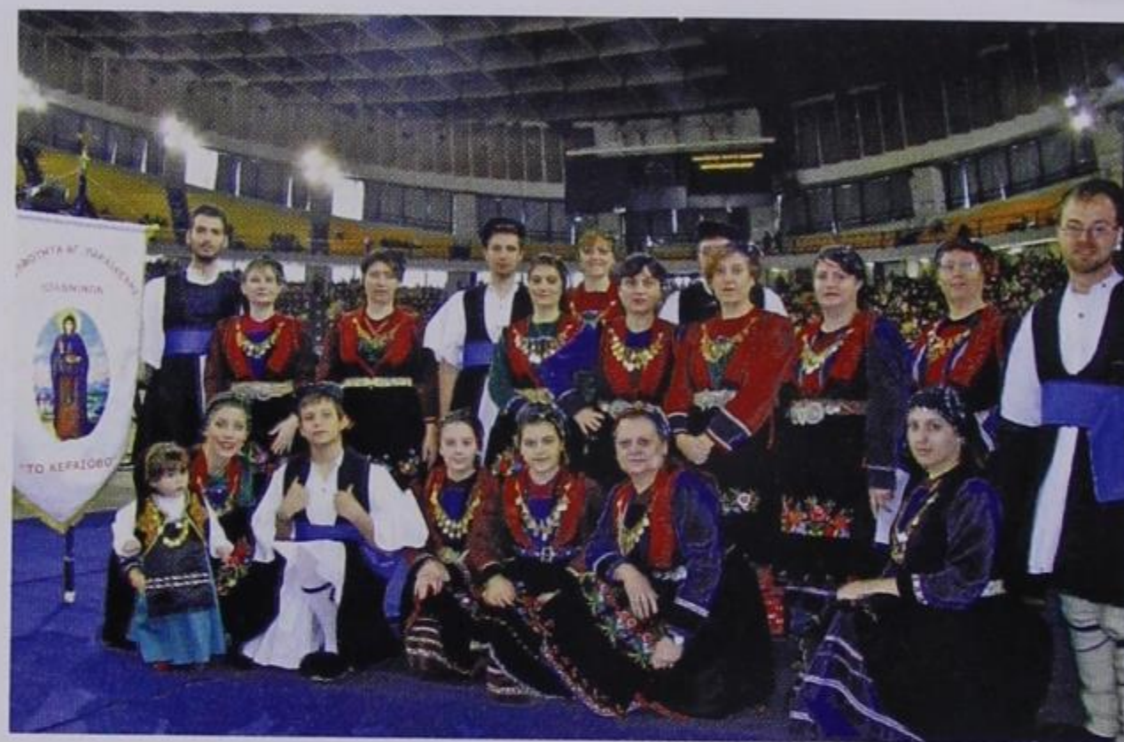
Το χορευτικό της Αδελφότητας.

Όσο για την Πανηπειρωτική είναι νομίζω καιρός να αφήσουν τις μεμφιμοιρίες και να προχωρήσουν σε πρωτοβουλίες που θα αναβαθμίσουν το ρόλο της. Είναι ντροπή για μια οργάνωση με την εμβέλειά της και να μην έχει έναν ραδιοφωνικό σταθμό ή ένα περιοδικό ή ένα κτήριο στο οποίο θα στεγάσει τις Αδελφότητες της Ηπείρου. Δ. Τέλλης