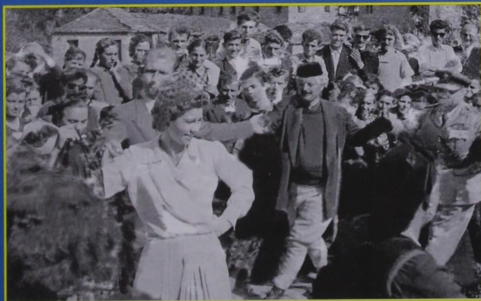
Πάνω: Παιδιά του χωριού μας, πολιτικοί πρόσφυγες στη Ρουμανία (1950).