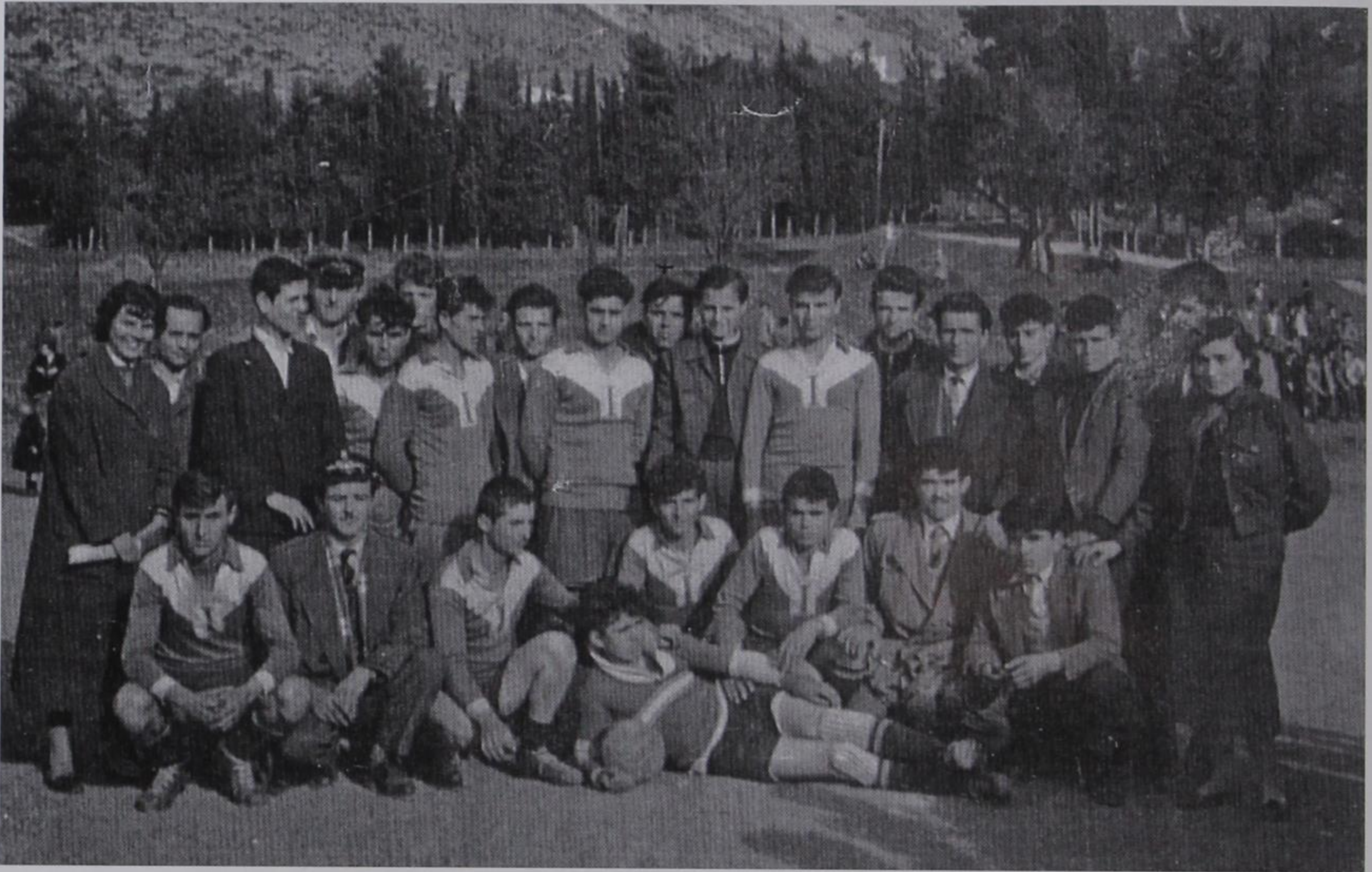
Η ποδοσφαιρική ομάδα του χωριού μας το 1957. "Ο φόβος και ο τρόμος" της περιοχής. (Αρχείο Ευαγγέλου Τζίνα).