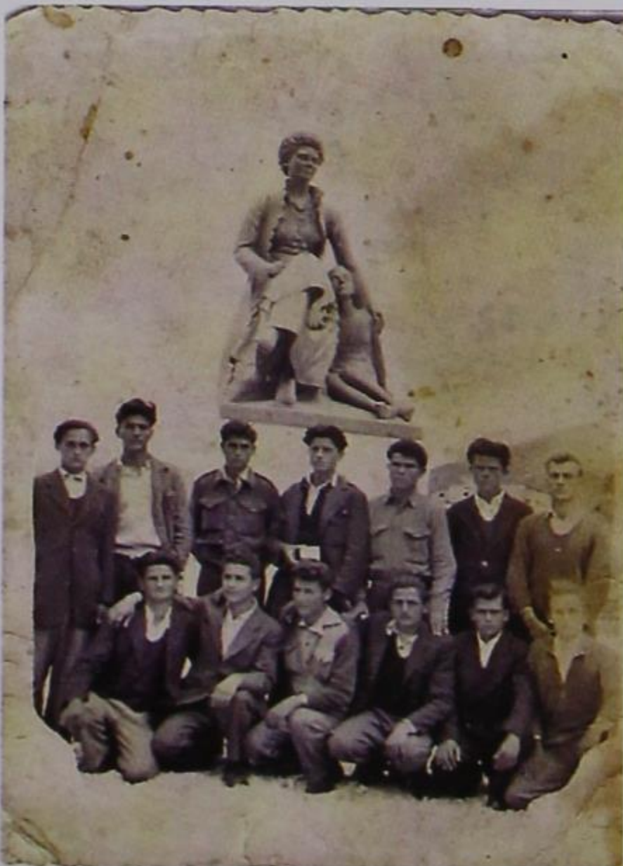
Παιδιά του χωριού μας το 1953, φωτογραφίζονται κάτω από το άγαλμα της Φρειδερίκης, στην πλατεία της Κόνιτσας.