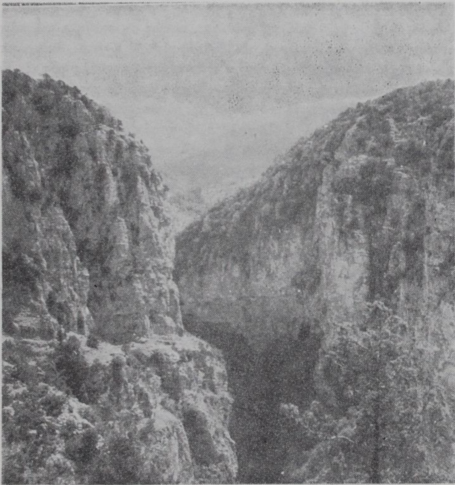
Ὁ Βίκος (Βικάκης) ἀπὸ τὸ Ρογκοβὸ

Ἵστερα ἀπ' αὐτὸ τὸ τμήμα («Βικάκη») ποὺ τελειώνει καθὼς σημειώθηκε κοντὰ στὴ Μπάγια, ἢ χαράδρα, τὴν ὁποία διαδρέχει τὸ ὁμώνυμο ποτάμι, παρουσιάζει πολὺ διαφορετικὴ ὄψη καὶ σύσταση. Λείπουν ἐδῶ τὰ πολὺ ἔντονα καὶ συνεχούμενα χαρακτηριστικὰ γνωρίσματα τῆς ἀρχῆς («Βικάκη») καὶ τοῦ ἄλλου τμήματος πρὸς τὸ τέλος τῆς χαράδρας. Τὸ τμήμα αὐτὸ ποὺ ἀναλο-