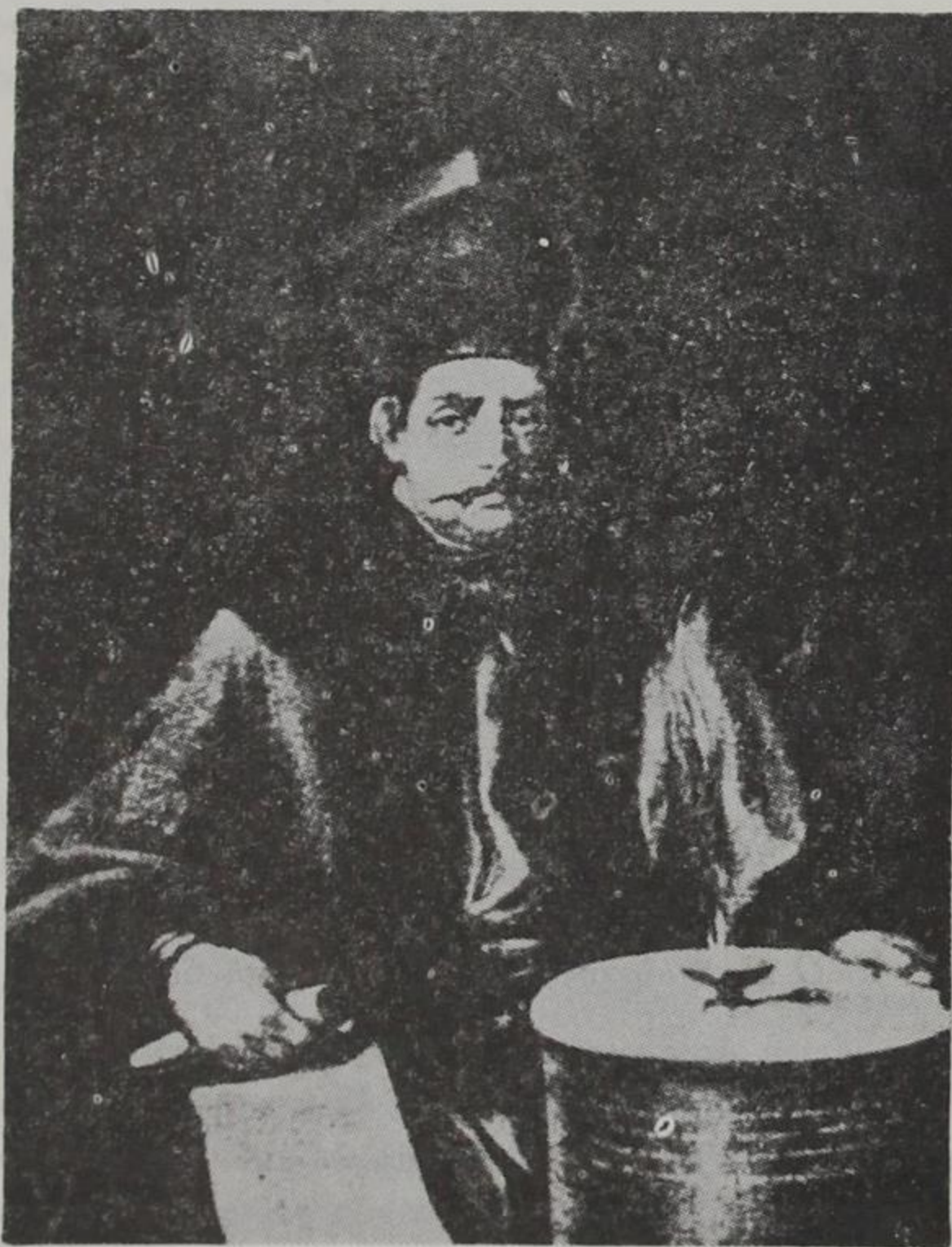
Προσωπογραφία του Παναγιώτη Χατζηνίκου (1709—1796)

γ) Τò γεγονός ότι έξω άπό τά Γιάννινα, ό Π. Χατζηνίκου, άφησε και στήν Κόνιτσα κληροδοτήματα, όπως θά δοϋμε παρακάτω (όπως κι ό Ζώης Κα-