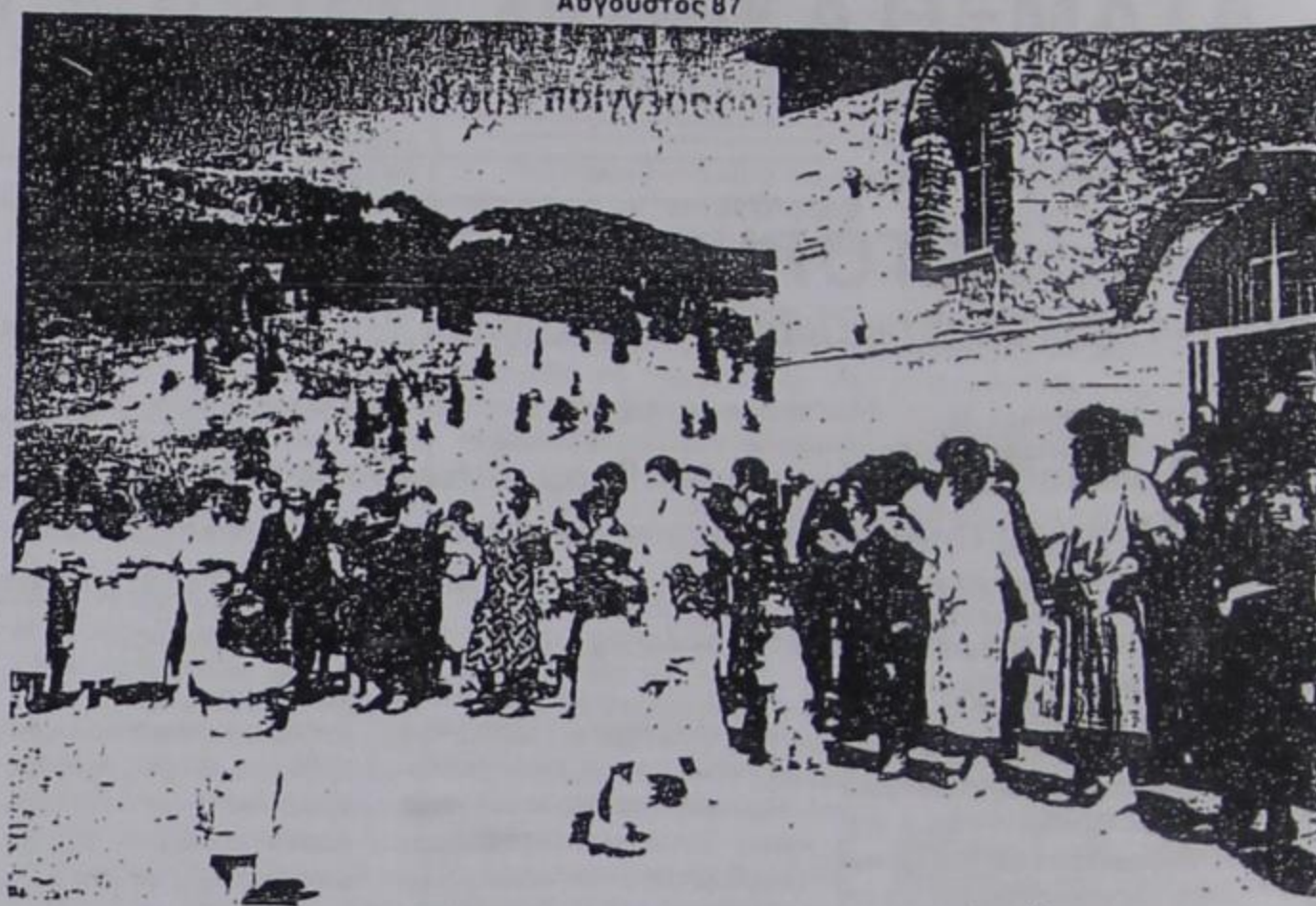
Από τον μεγάλο χορό στην εκκλησία της Παναγίας (πρώτη μ. ρα)

Αυτές οι σχέσεις υπογραμμίζουν βασικά την αποδοτικότητα που έχουν στη μάθηση τα γνωστικά κίνητρα, και τα κίνητρα αυτοεκφρασης και αυτοεκτίμησης. Τα παιδιά προσπαθούν να ικανοποιούν αυτά τα κίνητρα που υποκινούνται από ορισμένες εσωτερικές ανάγκες και άμεσα, με φιλικές διαπροσωπικές σχέσεις, και έμμεσα με αποδοτικές προσπάθειες για βελτίωση της σχολικής επίδοσης.