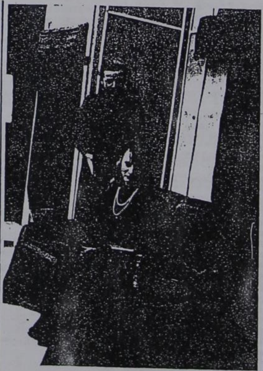
Από την θεατρική παράσταση που δόθηκε την 2η μέρα το απόγευμα στην πλατεία.