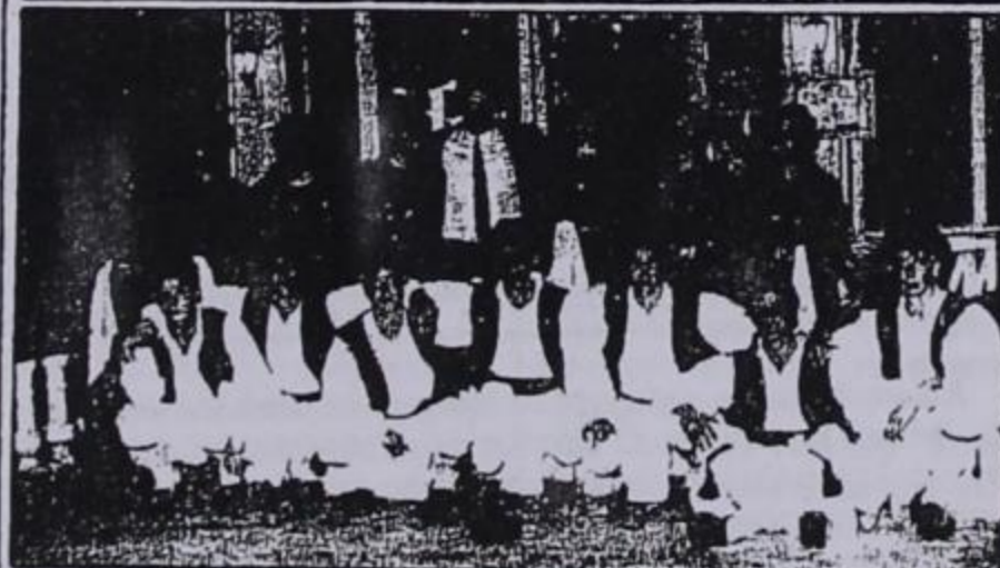
Το συγκρότημα του Συλλόγου Λάρισας

Παρακαλούνται όσοι μπορούν να βοηθήσουν να επικοινωνήσουν με το τηλέφωνο 041 - 229910.