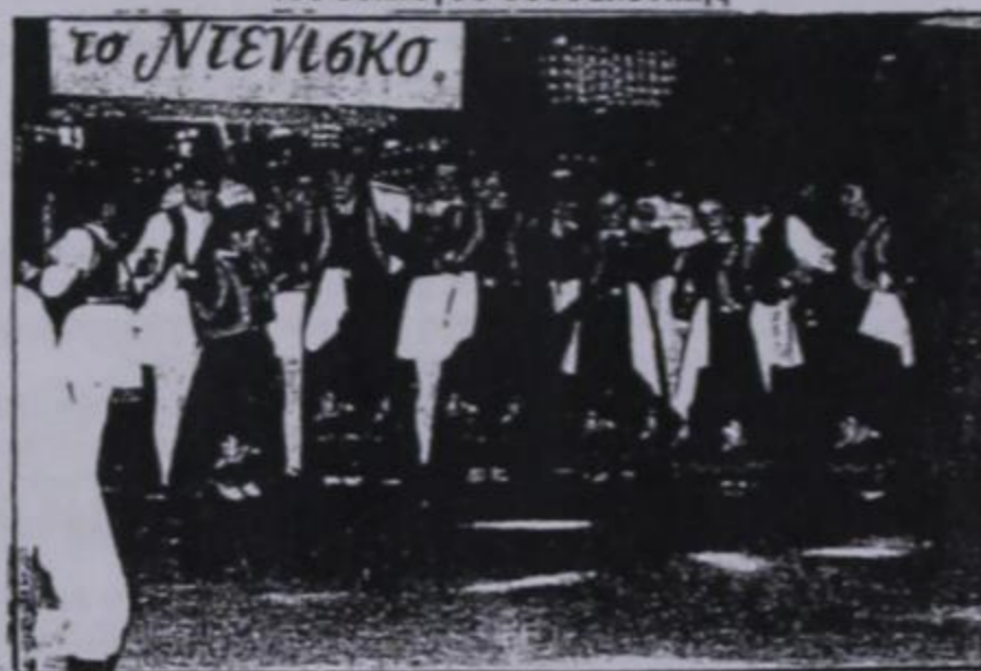
Από την εμφάνιση του μικρού χορευτικού στη Νέα Χαλκηδόνα