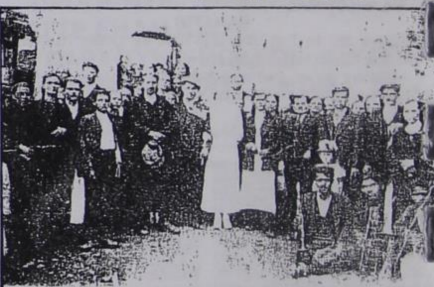
1938 ΣΤΕΦΑΝΑ ΣΤΟ ΝΤΕΝΙΣΚΟ. Όσοι γνωρίζουν το γάμο να μας στείλουν ποιο είναι το ζευγάρι