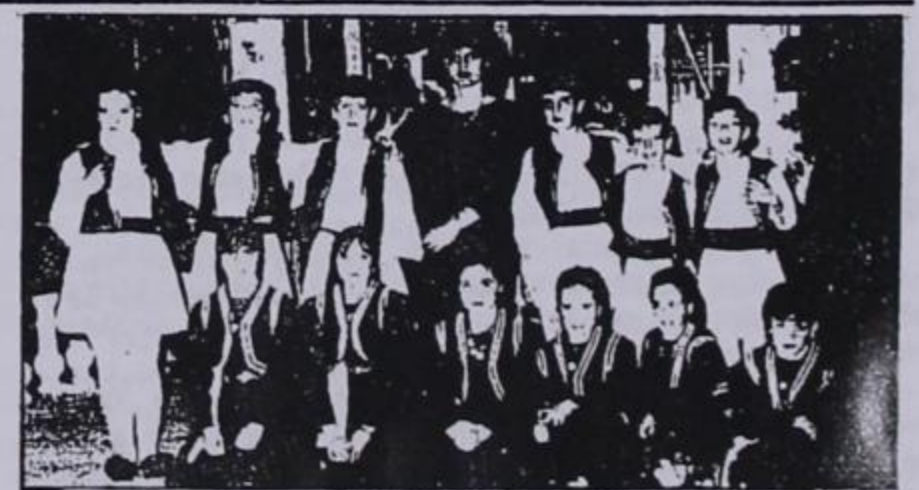
Το μικρό χορευτικό του Συλλόγου Θεσσαλονίκης όπως εμφανίστηκε στη Λάρσα