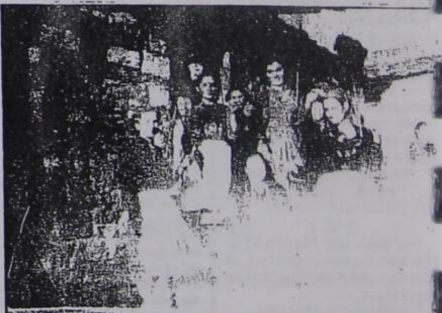
ΓΝΕΣΙΜΟ ΜΕ ΤΗ ΡΟΚΑ. Λίγες μέρες μετά το γάμο τους οι νιόπαντρες συγκεντρώνονταν όλες μαζί διαδοχικά στα σπίτια τους για να γνέσουν και να κουβεντιάσουν.