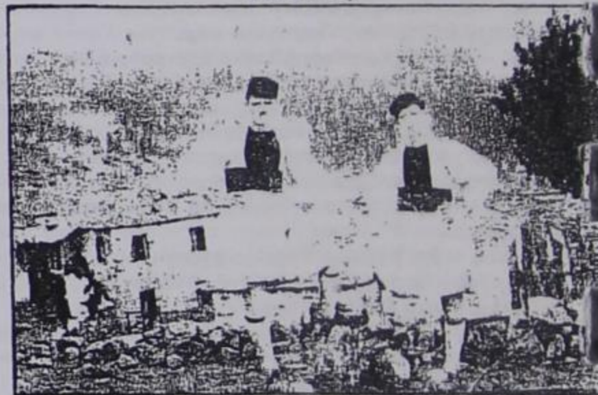
Νέοι με τοπικές ενδυμασίες (φωτογραφία του 1925)

Συνεχίζουμε τη δημοσίευση παλιών φωτογραφιών και παρακαλούμε, όσους έχουν τέτοιες να μας τις στείλουν. Οποιοδήποτε προτεραιότητα θα έχουν οι πιο παλιές από αυτές.