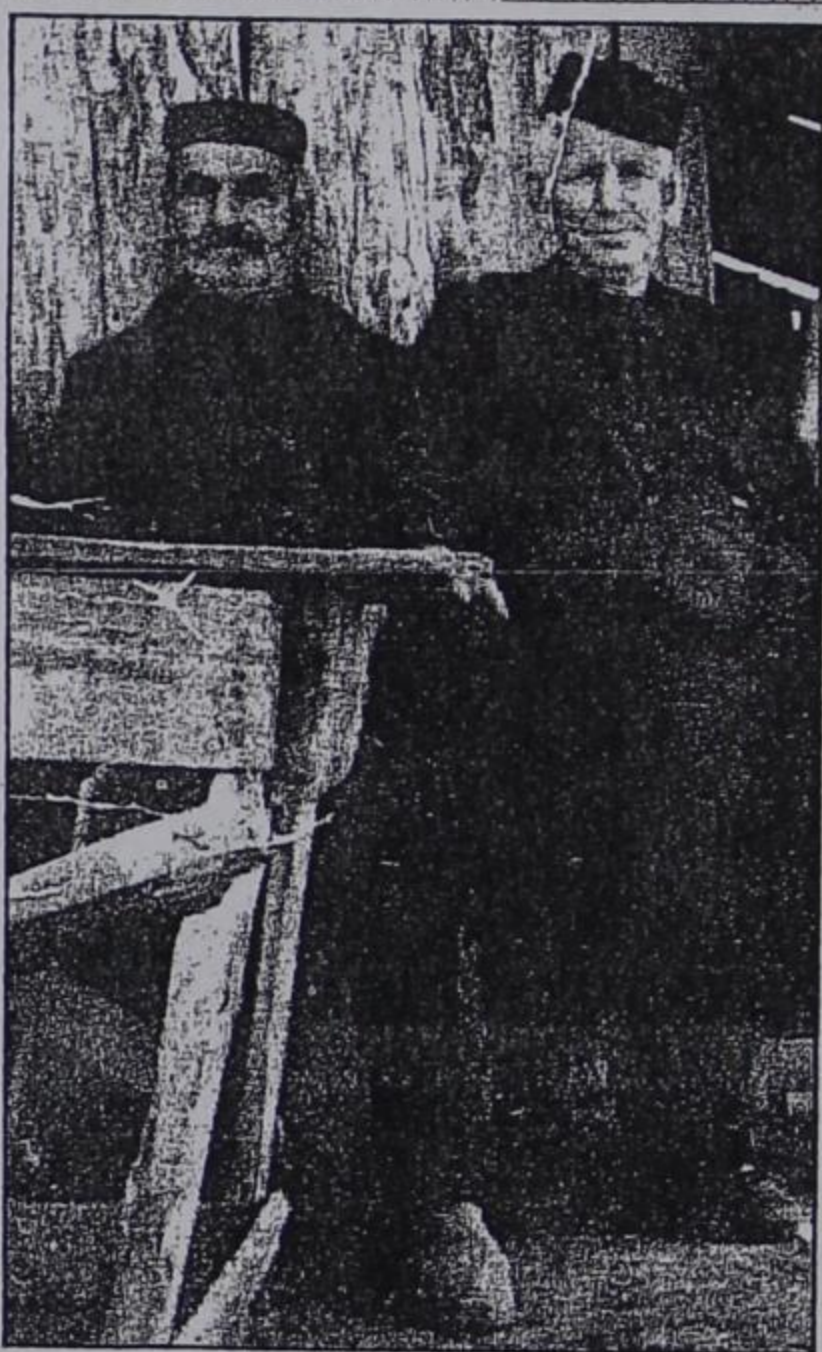
Γέροντες του χωριού μας

χιλίες-δύο δύστροπες σωματοφθόρες και ψυχοθόρες αρρώστιες αποτρέποντας έτσι αυτό που λέμε: γήρας νόσος.