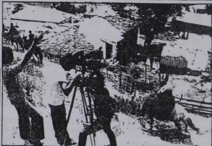
1981: Από το γύρισμα του ντοκιμαντέρ «Γάμος στο Ντένισκο» του Γιάννη Προκόβα

ΣΗΜ.: Το ντοκιμαντέρ «Απ' τ' Αϊβαλί στην Πέργαμο» θα εκπροσωπήσει την Ελληνική Τηλεόραση στο Φεστιβάλ Κινηματογράφου της Θεσσαλονίκης.