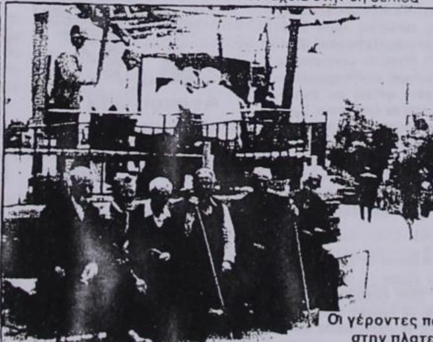
Οι γέροντες παίρνουν τη θέση τους στην πλατεία του χωριού μας