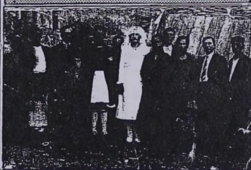
Νεόνυμφοι της δεκαετίας του 1930 με παραδοσιακές ενδυμασίες