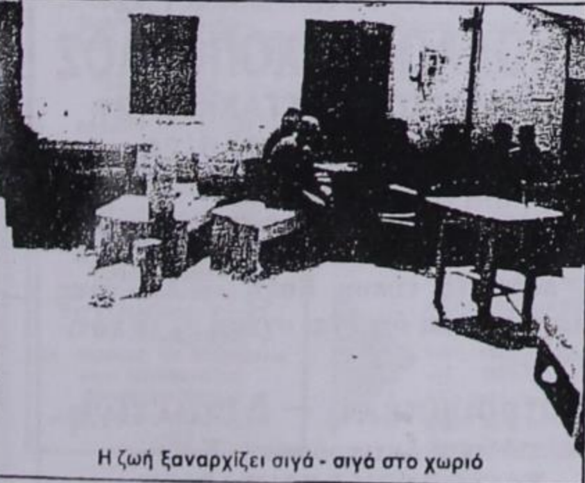
Η ζωή ξαναρχίζει σιγά - σιγά στο χωριό

Η έκδοση αυτή περιέχει 6 σελίδες γιατί προγραμματίστηκε και έκτακτη έκδοση για τον 15Αύγουστο.