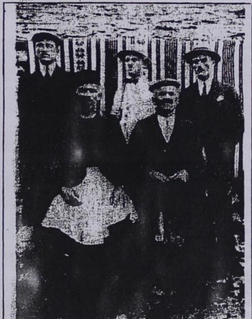
Άνδρες του χωριού μας με τοπικές ενδυμασίες της δεκαετίας του 1920

Περιμένουμε τις απαντήσεις σας για τα πρόσωπα που εικονίζονται στις φωτογραφίες