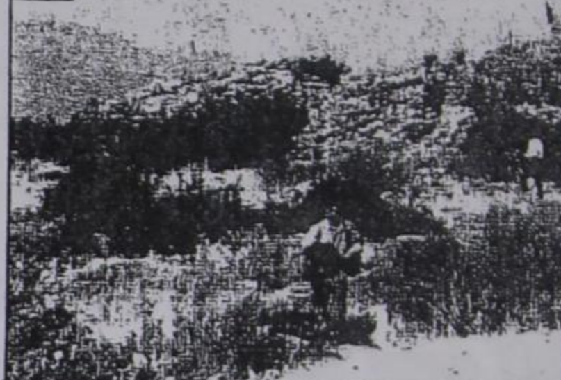
Ο σκηνοθέτης ΓΙΑΝΝΗΣ ΠΡΟΚΟΒΑΣ στην Πέργαμο

Υπενθυμίζουμε ότι τα ντοκιμαντέρ του ίδιου που έχουν προβληθεί μέχρι τώρα είναι: «Αμπελάκια» - «Γάμος στο