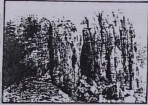
Κιάτρα ντισικάτα (Πέτρα σχισμένη)