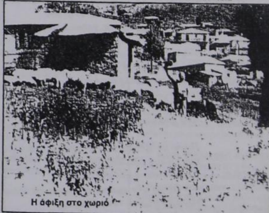
Η άφιξη στο χωριό