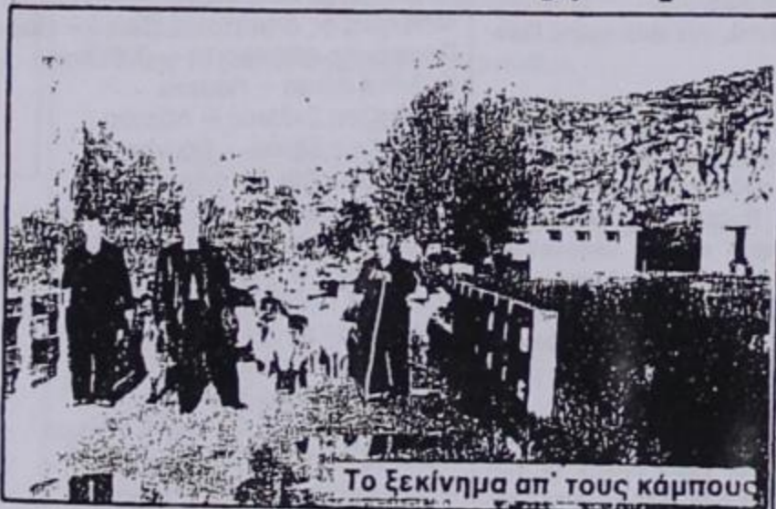
Το ξεκίνημα απ' τους κάμπους

χωριό μας, όπως πάντα, με πρώτους τους κτηνοτρόφους που φέτος είναι λιγότεροι από πέρυσι, όπως και πέραι λιγότεροι από πρόπερσι κλπ.