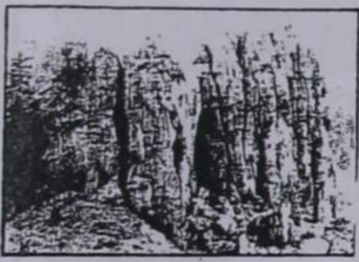
Κιάτρα ντισικάτα (Πέτρα σχισμένη)

Σεπτέμβριος - Οκτώβριος - Νοέμβριος - 1988 ΕΤΟΣ 2ο ΑΡΙΘΜΟΣ ΦΥΛΛΟΥ 8