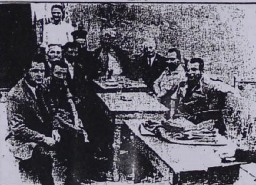
Παλιά γλέντια των Αετομηλιτιστών