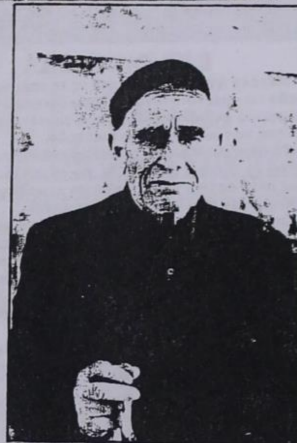
ΠΗΓΑΙΝΕΙ ΠΡΩΤΟΣ ΚΑΙ ΦΕΥΓΕΙ ΠΑΝΤΑ ΤΕΛΕΥΤΑΙΟΣ ΑΠ' ΤΟ ΧΩΡΙΟ

(Απρίλης, Μάης) όταν η βλάστηση είναι κατάλληλη και οι καιρικές συνθήκες ευνοϊκές, τα κοπάδια οδηγούνται σε υπαίθριες βοσκές είτε στις κοινοτικές εκτάσεις ή σε ιδιόκτητα λιβάδια. Τότε γίνεται και ο κούρος. Ο κούρος είναι ένα μείζον κοινωνικό γεγονός στην κτηνοτροφική ζωή που προμηνύει το πέρασμα στη νέα περίοδο και την επιστροφή στο μέρος που οι βλάχοι αποκαλούν «loclu anostu» (τόπος δικός μας).