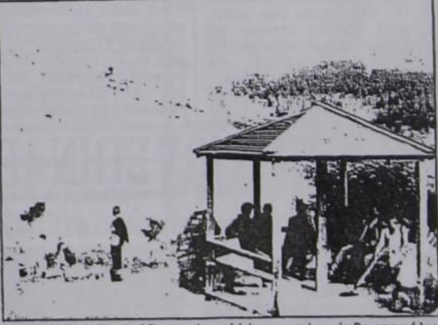
ΣΤΟ ΚΙΟΣΚΙ: Το βράδυ οι νέοι αλλά την ημέρα άνθρωποι όλων των ηλικιών συζητούν για τα προβλήματα του χωριού μας

➤ ΤΙ ΠΗΡΑΜΕ; «Την πλήρωσα και με τα παραπάνω την πίτα» που έφαγα στην Αετομηλίτσα είπε η κ. Νομάρχης, στί συζήτηση που έγινε κατά την επίσκεψή της στο χωριό. Ρωτήσαμε λοιπόν, εννοούσε και μάθαμε ότι όλες τις προηγούμενες επισκέψεις σ' άλλα χωριά έδωσε απ' το αποθεματικό της Νομαρχίας μέχρι 500.000 δρχ. Στην Αετομηλίτσα έδωσε 2.500.000 δρχ. Α είναι έτσι, πράγματι της «πλήρωσε» και καλά έκανε.