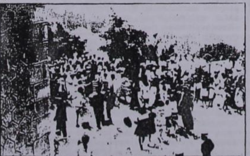
Ο ΜΕΓΑΛΟΣ ΧΟΡΟΣ στην εκκλησία της Παναγίας

Οι εκδηλώσεις μπορούμε να πούμε ότι άρχισαν χωρίς φέτος με τον χορό που έκανε ο σύλλογος Αετομηνιτσιωτών «ΤΟ ΝΤΕΝΙΣΚΟ» = Συνέχεια στην 9η σελίδα =