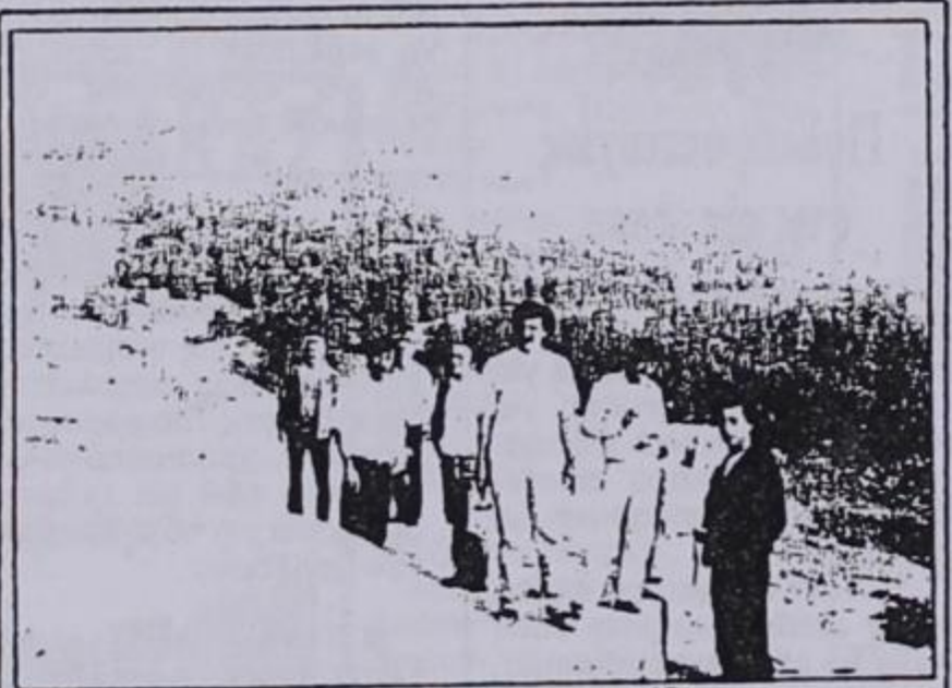
Απ' τη χάραξη των νέων οικοπέδων

ΑΠΑΝΤΗΣΗ: Για το έτος 1991 έχουμε πετύχει να προγραμματίσουμε και ήδη να αποσπάσουμε την έγκριση από το Νομαρχιακό Συμβούλιο πίστωσης ύψους 1.200.000 δρχ. από το πρόγραμμα θελτίωσης βοσκοτόπων για διάνοιξη δρόμων προσπέλασης βοσκοτόπων, κατασκευή στεγάστρων για τα πρόβατα και οικίσκων για τους κτηνοτρόφους. Η πίστωση αυτή αντιπροσωπεύει το 8% της συνολικής πίστωσης που διατέθηκε για τον νομό (12 εκατομ. από τα 150 εκατ. που διατέθηκαν στον νομό). Αν υπολογίσει κανείς ότι ο νομός έχει 314 χωριά θα διαπιστώσει ότι παίρνουμε την μερίδα του λέοντος.