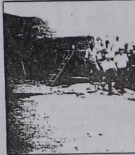
Το παλιό γραφείο την ημέρα της κατεδάφισης

κατηγοριών και σε διάφορες τιμές αποφάσισε να χορηγήσει η Κοινότητα στους Ντενισκιώτες. Έτσι, χωρίς τα οικόπεδα σε τρεις κατηγορίες και με άλλες τιμές για