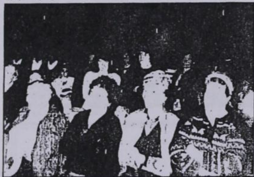
Γυναίκες, άνδρες και παιδιά, παρακολουθούν την ενδιαφέρουσα συζήτηση

Επίσης τόνιστηκε ότι οι αερολιπάνσεις θα συνεχιστούν και την άνοιξη.