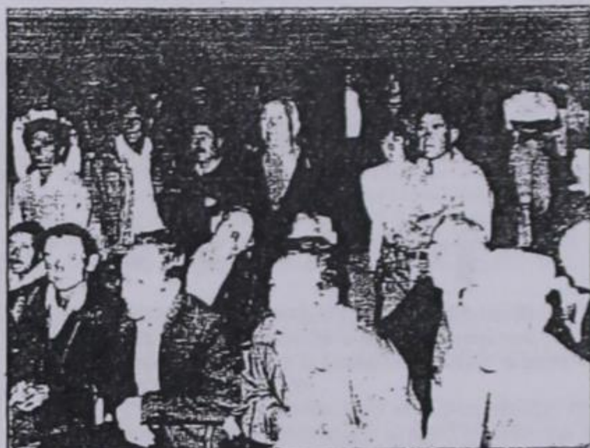
Γυναίκες, άνδρες και παιδιά, παρακολουθούν την ενδιαφέρουσα συζήτηση

Στο δεύτερο θέμα του δρόμου από «Πιστίλιανη» μέχρι και το χωριό, η κ. Νομάρχης, είπε, ότι δίνει επιπλέον 1.500.000 (στο ήδη εγκριθέν άλλο τόσο ποσό) για τη χαλικόστρωση, τη διάνοιξη σε ορισμένα σημεία και την κατασκευή της γέφυρας στη «Μισουλάκια» και μερικών άλλων τεχνικών.