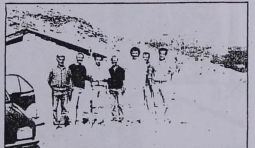
Απ' τη χάραξη των νέων οικοπέδων

Μεγάλη ζήτηση παρατηρείται τελευταία στα οικοπέδα από Ντενισκιώτες κάθε γωνιάς της χώρας μας, που ξαναγυρίζουν στο χωριό. Για τον παραπάνω λόγο η Κοινότητα βρέθηκε στην ανάγκη και πήρε μερικές σημαντικές αποφάσεις ώστε να ικανοποιήσει αμέσως τις αιτήσεις όλων των ενδιαφερομένων.