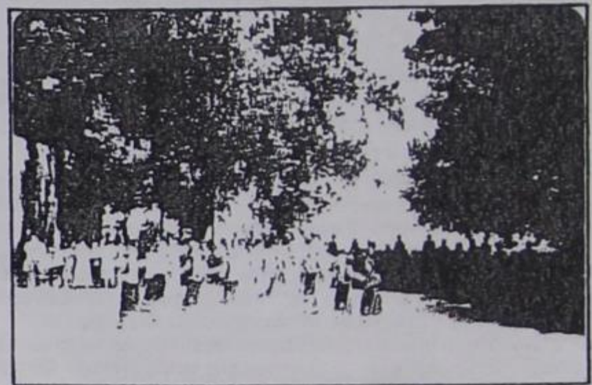
Απ' την εμφάνιση του χορευτικού μας στη Φούρκα στη γιορτή της Γυναίκας της Πίνδου 20 Ιουλίου

Επίσης παρακαλεί όλους τους υπόλοιπους αναγνώστες να τακτοποιηθούν το συντομότερο δυνατό για όλες τις μέχρι και το 1992 συνδρομές στους κατά τόπους αντιπροσώπους μας.