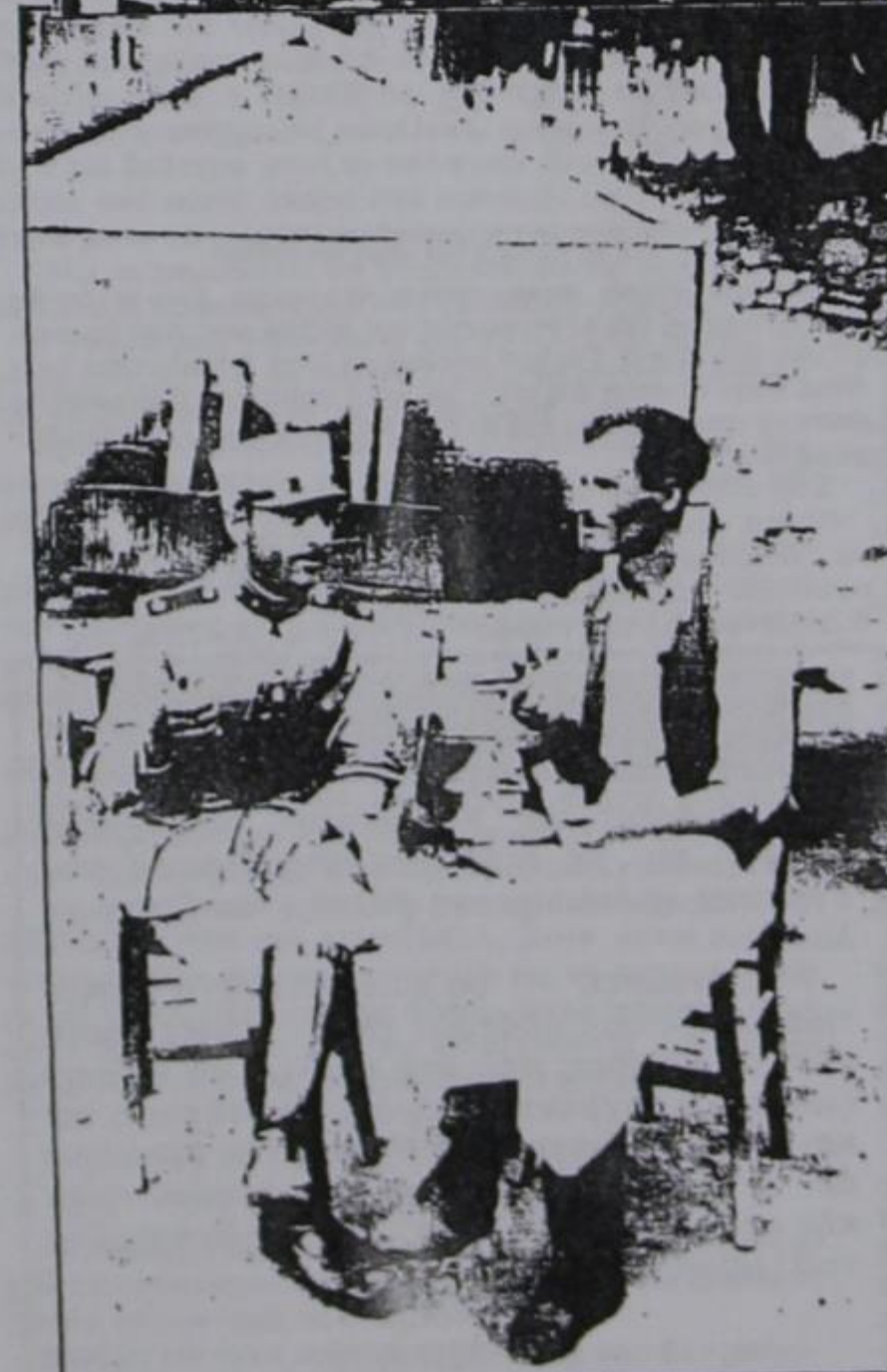
Απ' την υποδοχή και τη φιλοξενία των αρχών κυρίως στρατιωτικών στο παλιό Ντένισκο. (Φωτογραφίες της δεκαετίας του 1930)