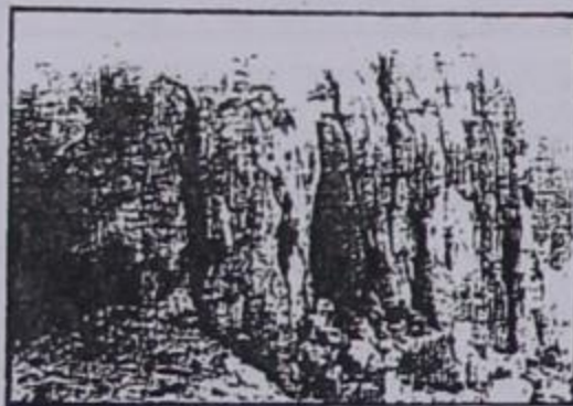
Κιάτρα ντισιάκατα (Πέτρα σχισμένη)

«Όποιος δεν γνωρίζει τον τόπο που γεννήθηκε αισθάνεται πάντα ξένος»