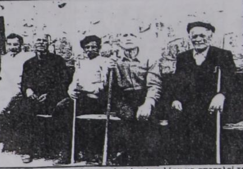
Το παγκάκι του παλιού γραφείου έπαψε πλέον να αποτελεί το στέκι των ανθρώπων κάποιας ηλικίας

κατηγοριών και σε διάφορες τιμές αποφάσισε να χορηγήσει η Κοινότητα στους Ντενισκιώτες. Έτσι, χωρίς τα οικόπεδα σε τρεις κατηγορίες και με άλλες τιμές για