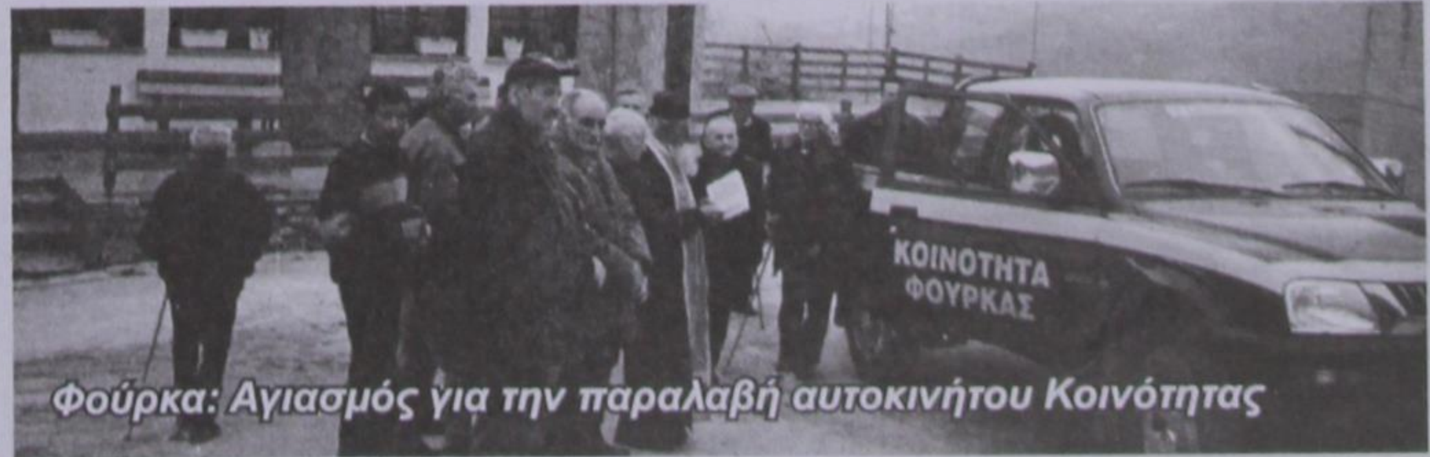
Φούρκα: Αγιασμός για την παραλαβή αυτοκινήτου Κοινότητας