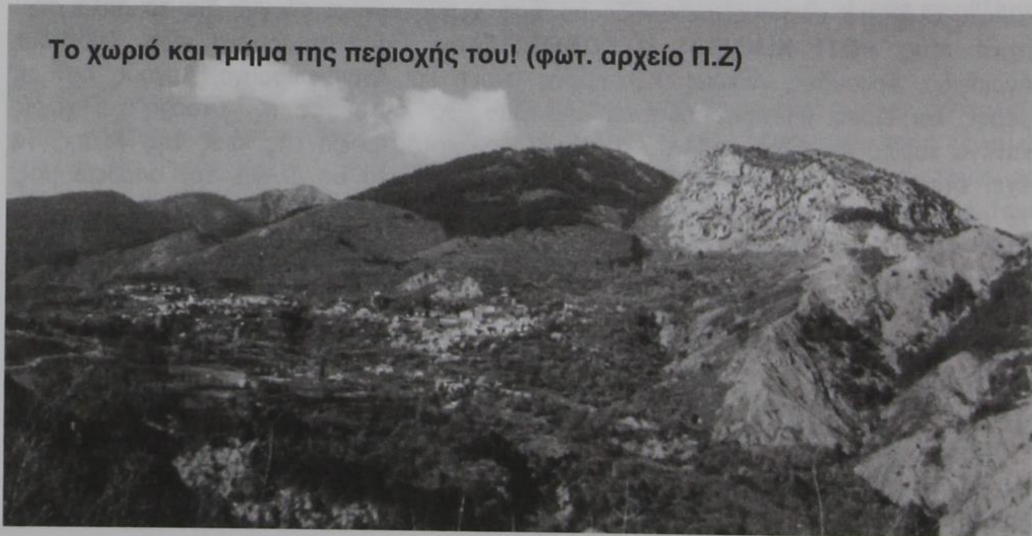
Το χωριό και τμήμα της περιοχής του!