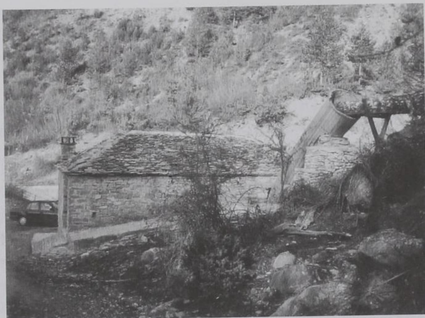
Ο αναπαλαιωμένος νερόμυλος του χωριού.

Το χωριό απελευθερώθηκε, όπως όλη η Ήπειρος το 1912 και αναγνωρίστηκε σαν κοινότητα το 1919 με το όνομα Λούψικο. Το