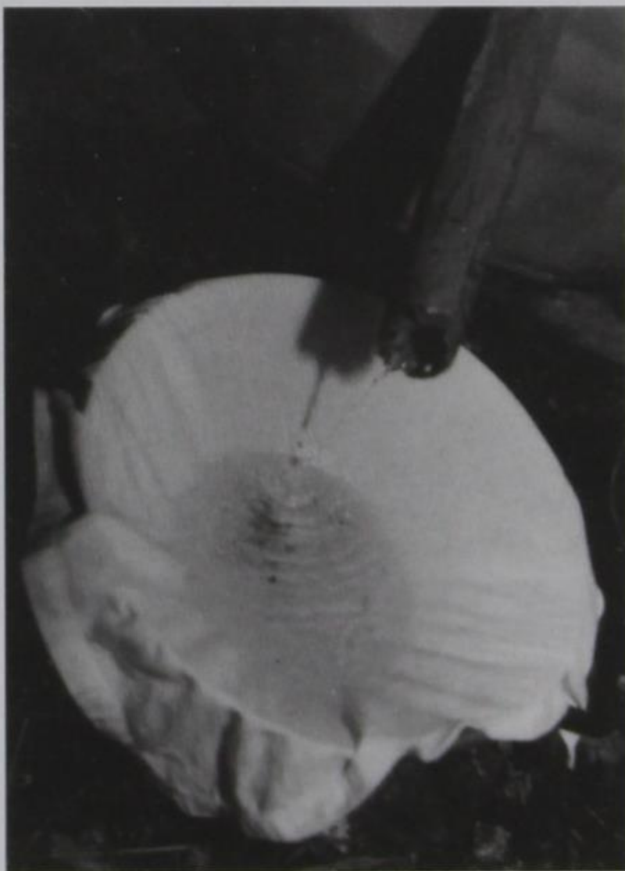
Ο ατμός υγροποιήθηκε από την ψύξη και έγινε το γνωστό και καλό μας τσίπουρο.