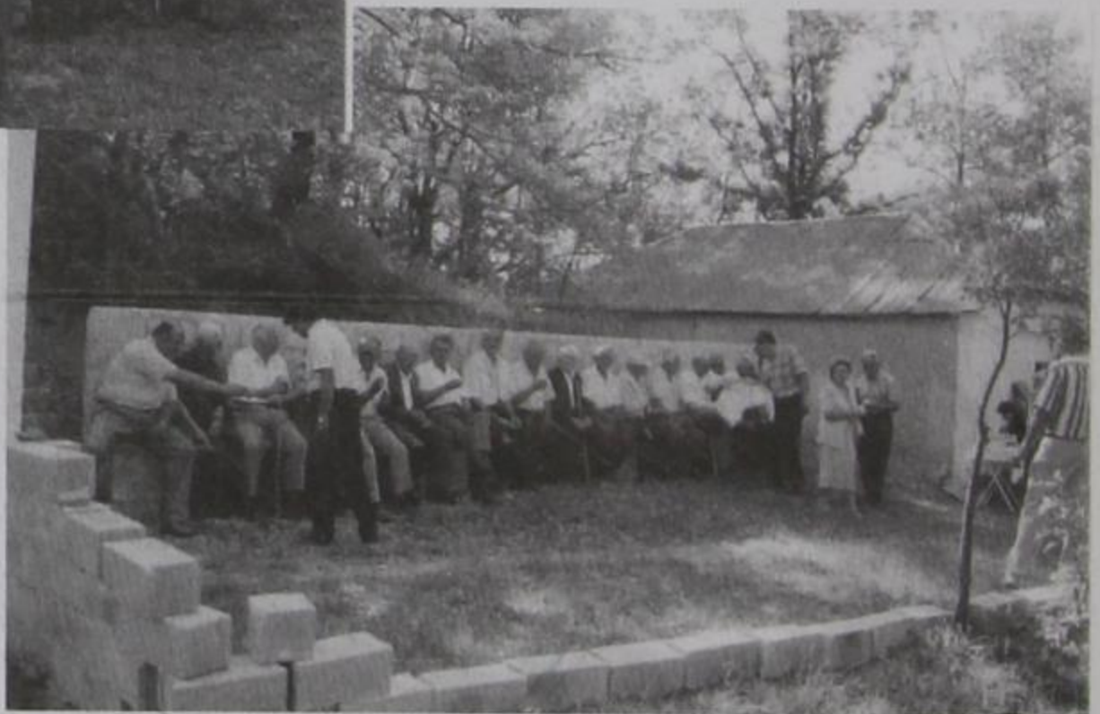
Αγία Παρασκευή 26-7. Ο κ. Παν. Κασιόλας μοιράζει το τσίπουρο και ο κ. Δ. Τζιώτζης μοιράζει το πρόσφορο (Μπαντούσια).