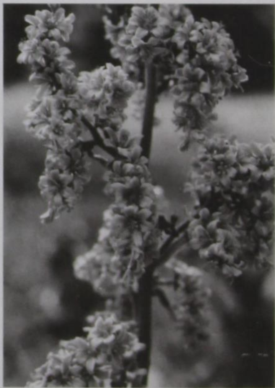
Άνθη του φυτού

φαίνονται το καλοκαίρι με χρώμα ασπριδερό ή πρασινωπό με μικρό κοτσάνι (ποδίσκο). Τα άνθη αυτά στο άκρο του στέλεχους σχηματίζουν ένα είδος τσαμπιού. Εσωτερικώς παίρνεται σε σκόνη 0,03 (τρία εκατοστά γραμ. έως 0,10 εκ.). Εις βάμμα 10-30 σταγόνες. Εξωτερικώς σε σκόνη 0,20 γρ. έως 0,50 σε 30 γραμ. χοιρινό λίπος (axonge). Το λευκό δε συναντάται στην Ελλάδα, συναντάται το Λοβελιανό με ανάλογες ιδιότητες. Απαντάται στα υψηλά βουνά. Χημικώς το φυτό περιέχει τη Βερατρίνη (πολύ τοξική) που βρίσκεται κυρίως στα ριζίδια και στα εξωτερικά στρώματα της ρίζας. Έχει ακόμη “Ζερβίνη” και Ζερβικό οξύ, άμυλο, γκόμμα κλπ. Οι τοξικές ιδιότητες μεταδίδονται και εις το χόρτο προς κτηνοτροφία εάν κατά τύχη βρίσκονται εις αυτά μόριά των. Καλλιερ-