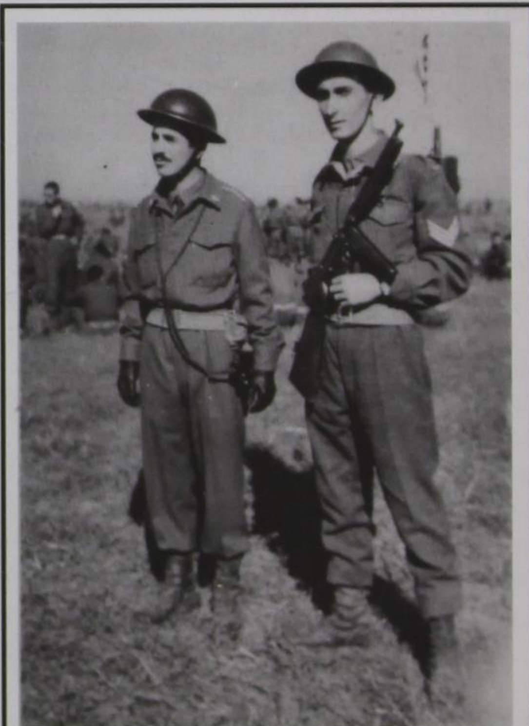
Ποιος μπορεί να γνωρίσει τα άτομα της φωτογραφίας;

Έγιναν και φέτος τα “καζάνια” στο χωριό τις τελευταίες ημέρες του Οκτωβρίου με τη συνηθισμένη διαδικασία χωρίς καμία αλλαγή. Λειτουργήσαν όλα τα ιδιωτικά και εξυπηρέτησαν όσους εκ των προτέρων είχαν δηλώσει με το συμφωνηθέν αντίτιμο, σε ρακί και χρήμα. Με την ευκαιρία αυτή κατέφθασαν κι αρκετοί ξενιτεμένοι και το χωριό για λίγες ημέρες απέκτησε πιο έντονη ζωή. Και του χρόνου να είμαστε καλά και να πάμε περισσότεροι, καλοξοδεμένη να είναι!