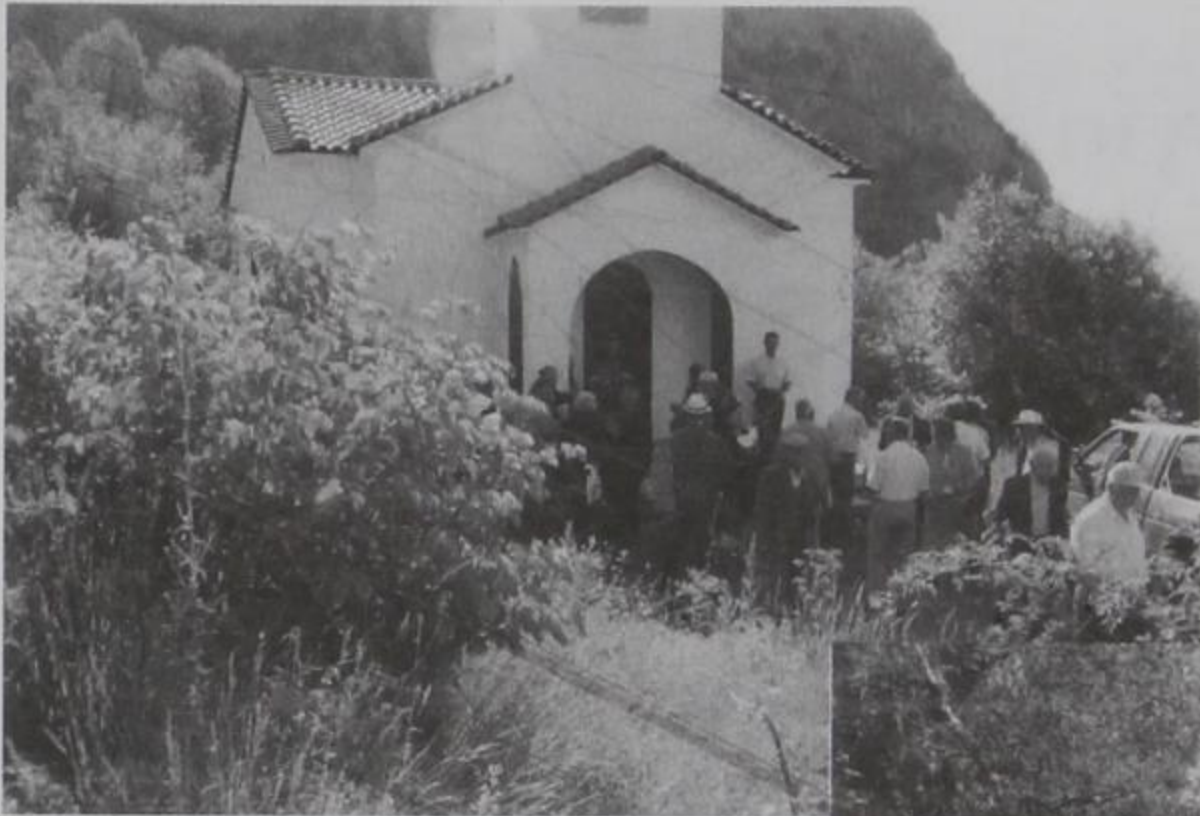
Άγιος Νεκτάριος 30-6.