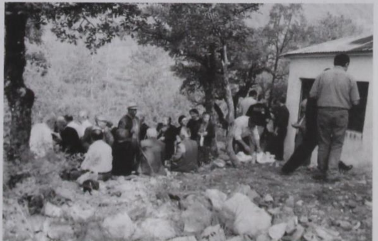
Αγ. Τριάδα - Ιούνιος Πλήθος Αμαραντιωτών.