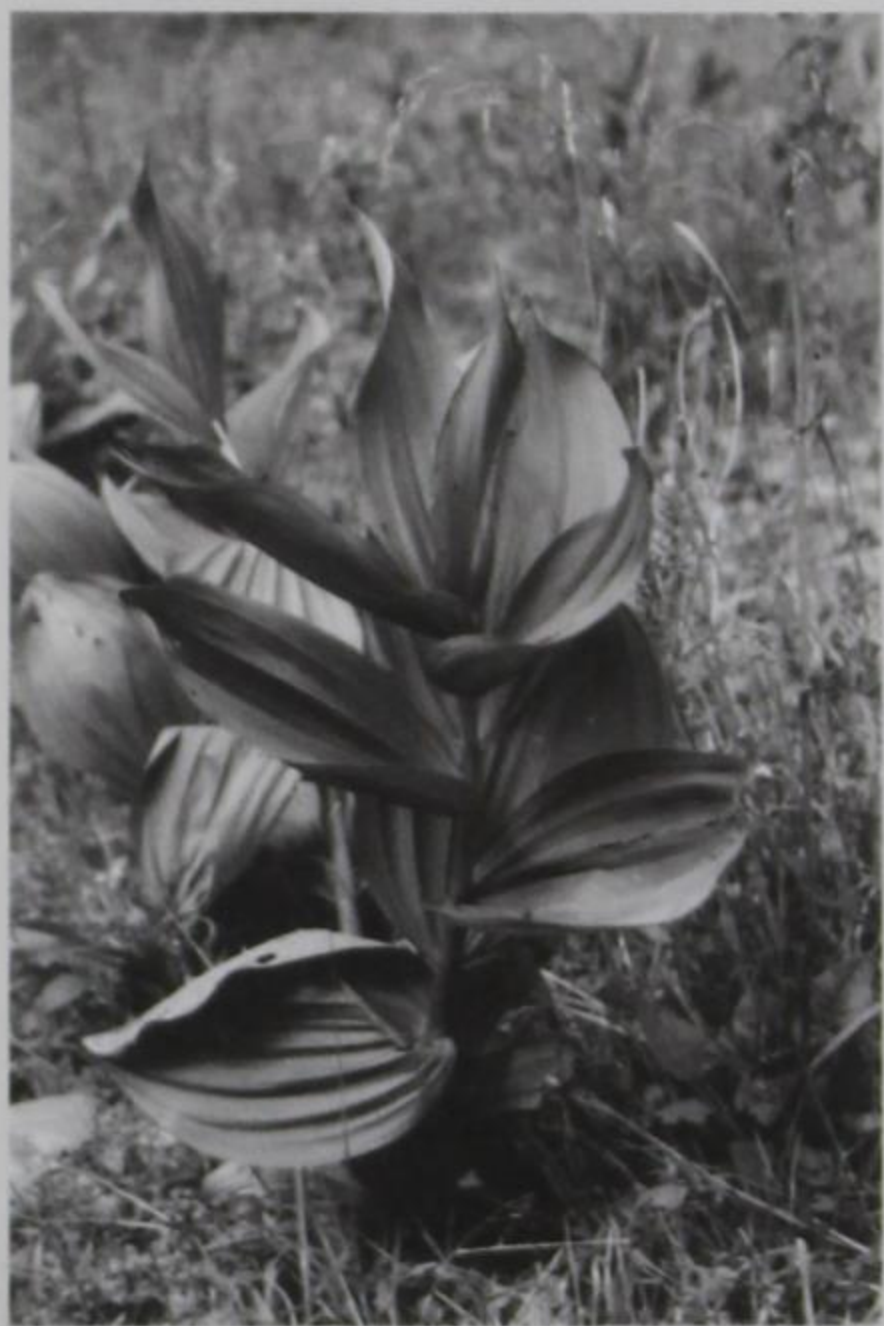
Χαρακτηριστικό το φύλλωμά του

γούνται και ως διακοσμητικά για το ωραίο τους φύλλωμα. Προτιμούν σκιά και υγρασία. Πολλαπλασιάζονται ευχερώς με σπορά ή βλαστό. Στην Ελλάδα απαντούν αυτοφυή τα δύο ακόλουθα είδη. 1° Άνθη πρασινωπά, εσωτερικώς συνήθως ωχροκίτρινα, με ποδίσκο πολύ βραχύτερο του περιγονίου (περιάνθιο κλειστό). 2° Το λευκό πολυετές χνουδωτό, με στέλεχος ισχυρό και τις παραπάνω αναφερόμενες ιδιότητες. Εις το είδος τούτο αναφέρεται πιθανώς Ελλέβορος ο λευκός του Θεοφράστου (φυτών ιστορία 9, 10, 1 και 9, 18, 2) του Διοσκουρίδου κατά τον οποίον “Ρωμαίοι Βερέτρον άλβουμ εκάλουν” (IV, 148). Οι ίδιοι αναφέρονται και εις τον μέλαν ελέβορο “αναιρών... και ίππους και βους και