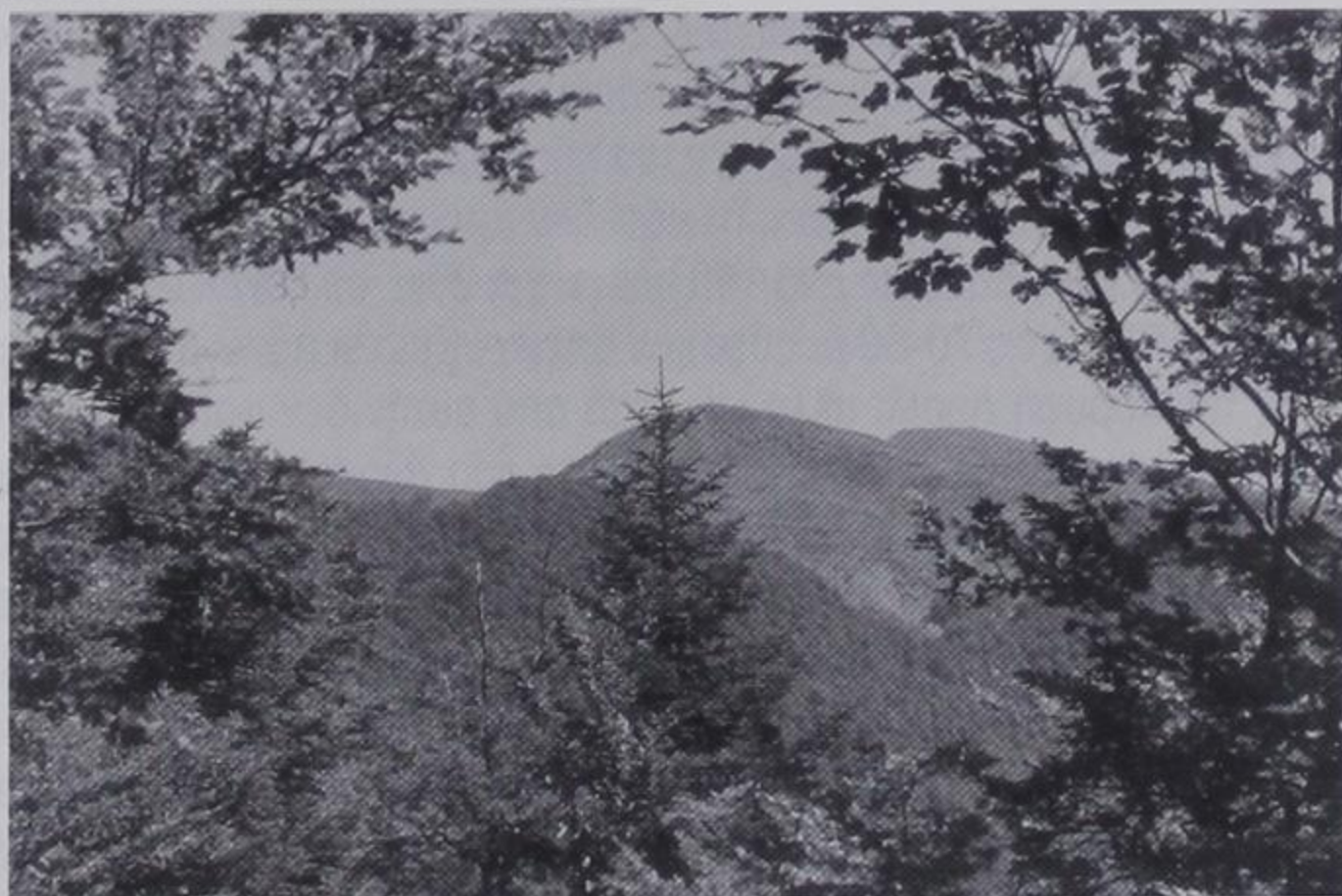
Άποψη του "Γκόλιου"