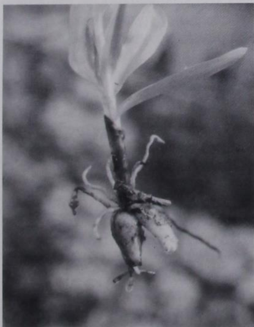
Ο βολβός του φυτού

Το σαλέπι είναι βολβός (κόνδυλος) μικρομεγέθης ή και πολύκλαδος ιδίως ο βαρκίσσιος, απλώνεται σε πολύ αδύναμο ήλιο για να ξηραθεί αφού προηγουμένως πλυθεί καλά και αποξηραμένος πουλιέται πλέον στους εμπόρους σε υπολογίσιμη τιμή, αλέθεται και είναι εξαίσιο αφέψημα, παρασκευάζονται ποτά διάφορα, είναι εύγευστο, θερμαντικό, τονωτικό, θρεπτικό,