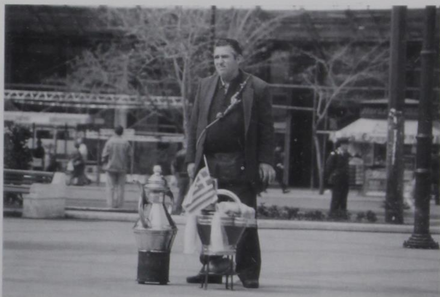
Σύγχρονος σαλεπιτζής στην Πλ. Συντάγματος

των ταχύτατων βερβερίδων που κουκουνάρια ροκάνιζαν στα έλατα.