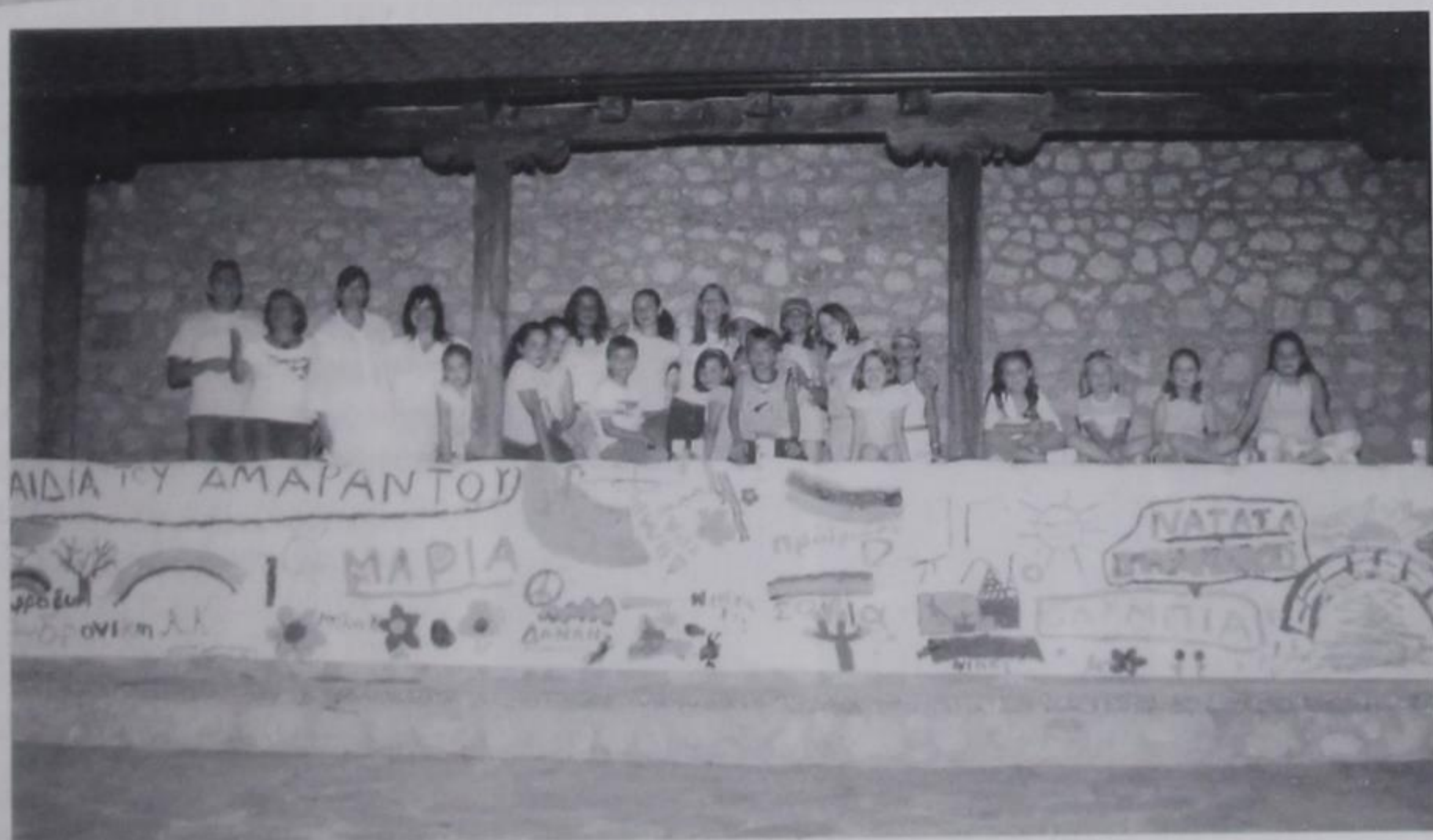
Αναμνηστική φωτογραφία μετά το τέλος της γιορτής. Μπροστά από τα παιδιά το έργο που μόνα τους ζωγράφισαν.