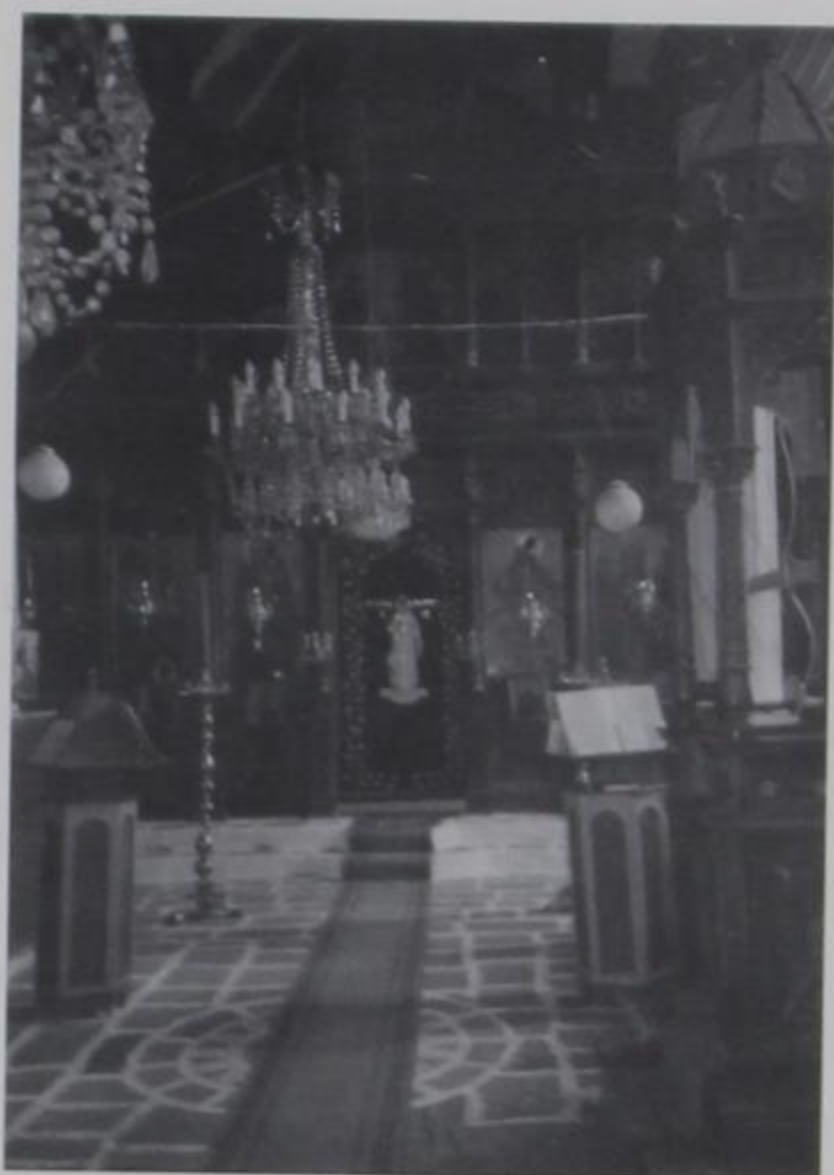
Το εσωτερικό του Ι.Ναού πριν την αλλαγή των πολυελαίων και του δαπέδου

μπλου ακριβώς είναι τοποθετημένη μεσαίου μεγέθους η εικόνα της Αγίας Τριάδος και δεξιά της και αριστερά 12 εικόνες μεσαίου μεγέθους σπάνιας αγιογραφικής ομορφιάς και ανεπτυγμένης αισθητικής και παριστάνουν την ζωή και τα θαύματα του Χριστού μας.