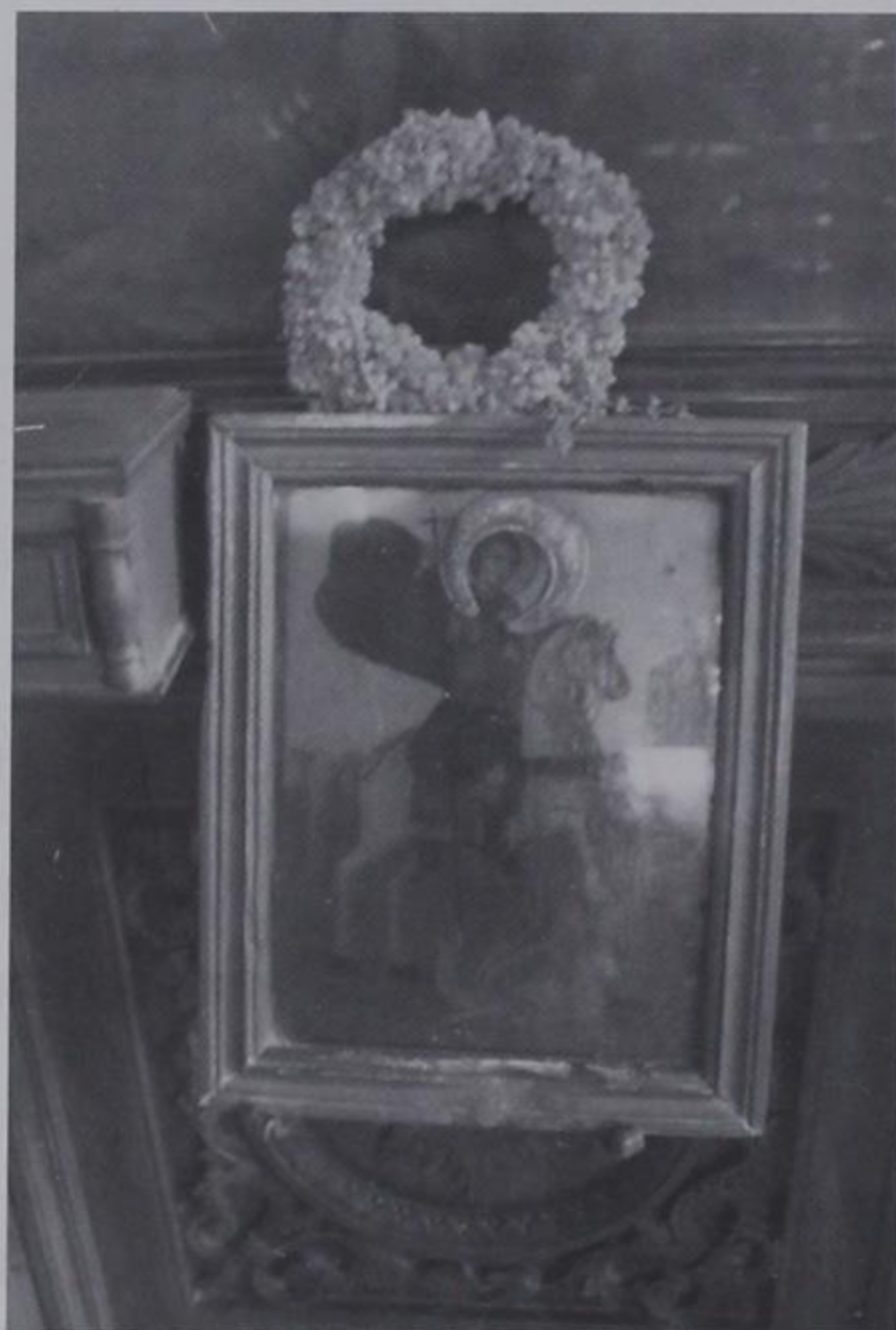
Ο Άγιος Γεώργιος του Ι.Ναού μας με το στεφάνι από Αμάραντο.

Βρέθηκα στο Χαγιάτι της εκκλησίας μας μόνος μου μια φοβερή, βροχερή και παγωμένη νύκτα του Νοέμβρη του 2000, ερημιά παντού, καμιά φωνή, καμιά ακρόαση. Το σκοτάδι πυκνό, η βροχή καταρρακτώδης, η ανεμοθύελλα δυνατή, μου ήταν αδύνατον να τηλεφωνήσω στην Πάτρα και καθηλώθηκα για ώρες κάτω από το αμυδρό φως του κανδηλιού που κρέμονταν στην κεντρική πόρτα της εκκλησίας στην εικόνα του καβαλάρη μας Αγίου Γεωργίου. Κάποια στιγμή με κυρίευσε ο φόβος της απόλυτης σιωπής, της περασμένης ώρας, και των καιρικών φαινομένων, σήκωσα τα μάτια μου προς την εικόνα και αμέσως άλλαξε η ψυχολογία μου. Για μας τους Αμαραντιώτες η εικόνα αυτή είναι τοποθετημένη στην καρδιά μας, στη συνείδησή μας, στις προσδοκίες μας, και αποτελεί, για όλες τις γενιές, το σύμβολο της προστασίας, της συντροφιάς, της παρηγοριάς, είναι ο συμπαραστάτης μας, ο συνοδηγός, ο συνοδοιπόρος, στους πονεμένους, τους φτωχούς, τους κατατρεγμένους, τους αδικημένους, τους περιφρονεμένους.