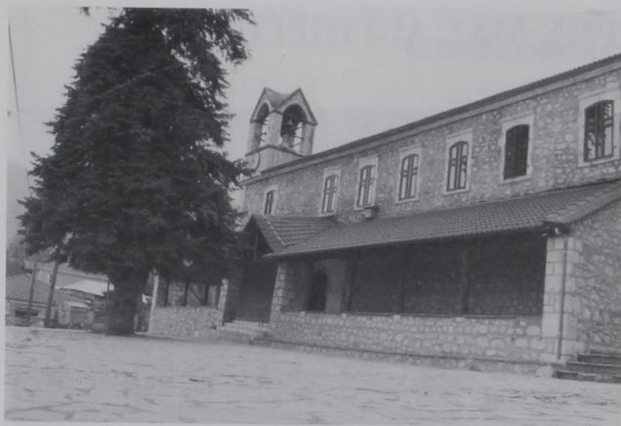
Ο Ι. Ναός του Αγίου Γεωργίου μετά την σωτήρια και καλαίσθητη εξωτερική επισκευή του.