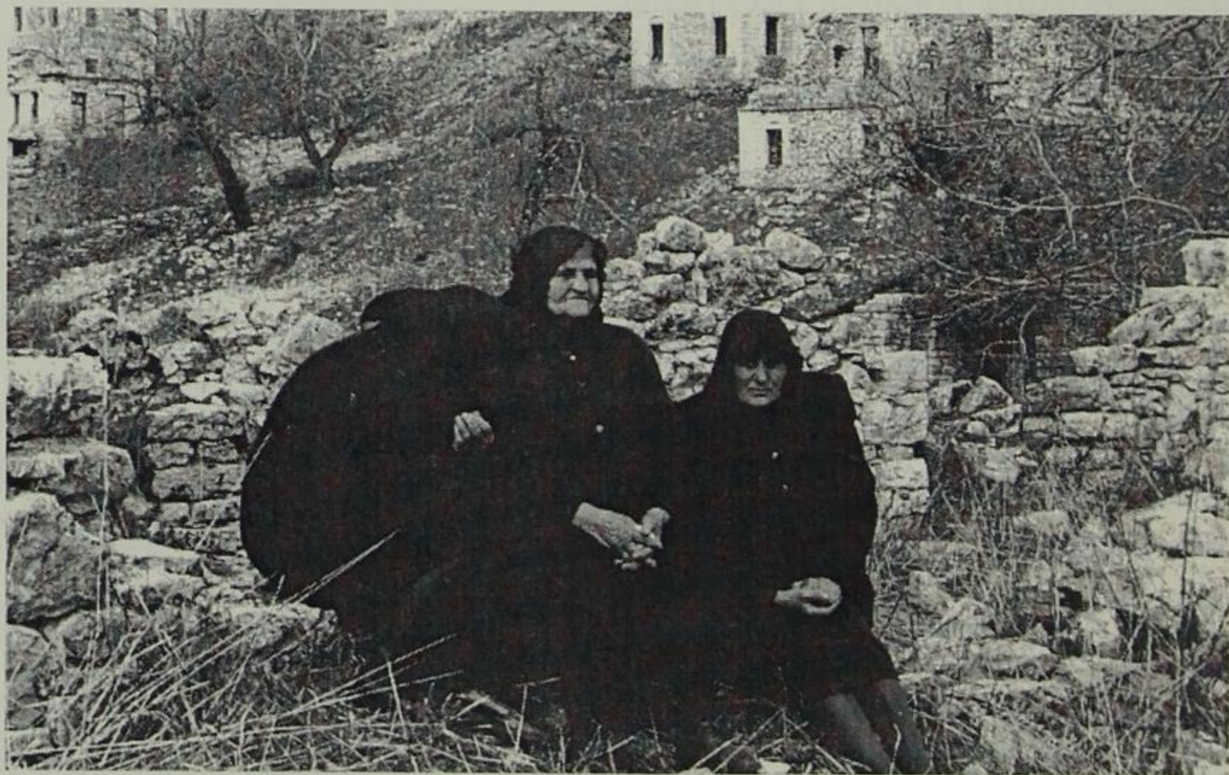
Από τα γυρίσματα της ταινίας: Μαυρονόρος