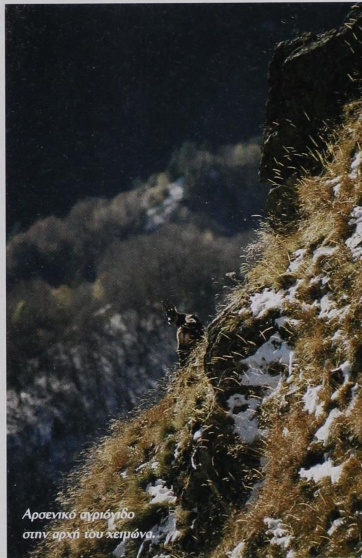
Αρσενικό αγριόγιδο στην αρχή του χειμώνα.