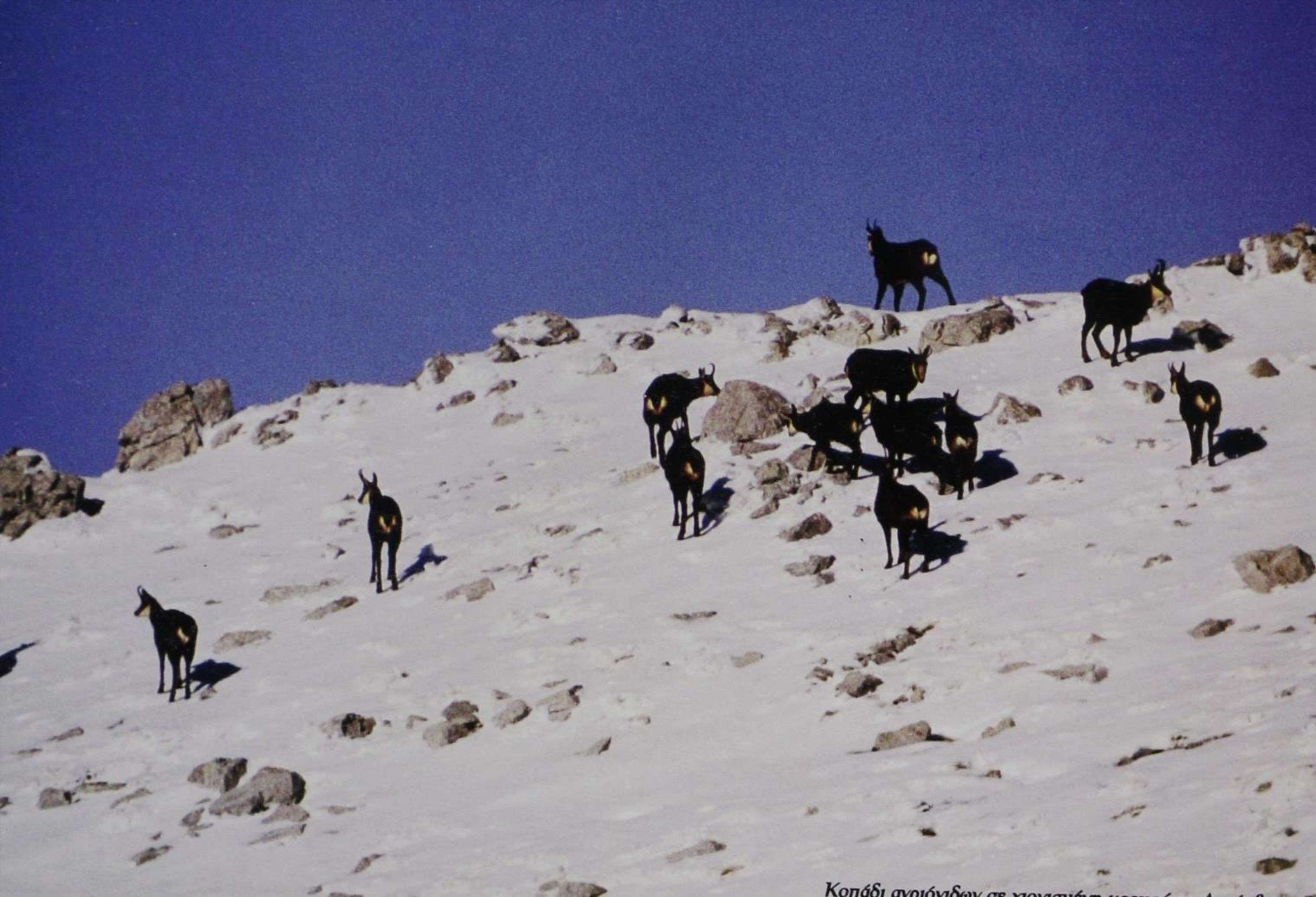
Κοπάδι ανοιόγιδων σε χιονισμένη κορυφή