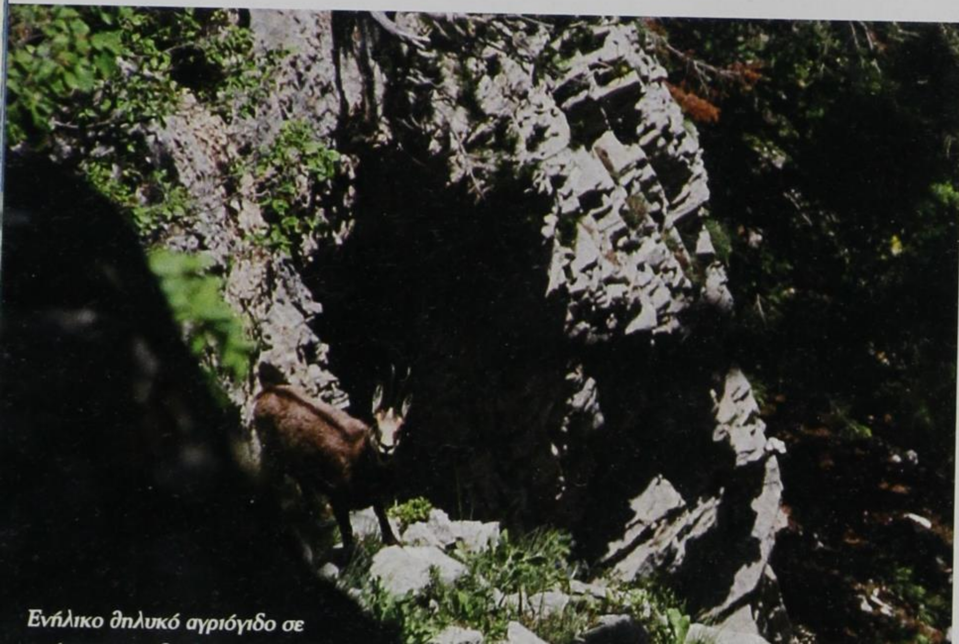
Ενήλικο θηλυκό αγριόγιδο σε

Πρόκειται για τα είδη εκείνα που η απειλή της εξαφάνισης τους δεν απλώνεται σε ολόκληρη τη γεωγραφική κατανομή τους, αλλά εντοπίζεται σε συγκεκριμένες μικρής σχετικά εκτάσεως περιοχές, όπως για παράδειγμα σε επίπεδο ορεινής γεω-