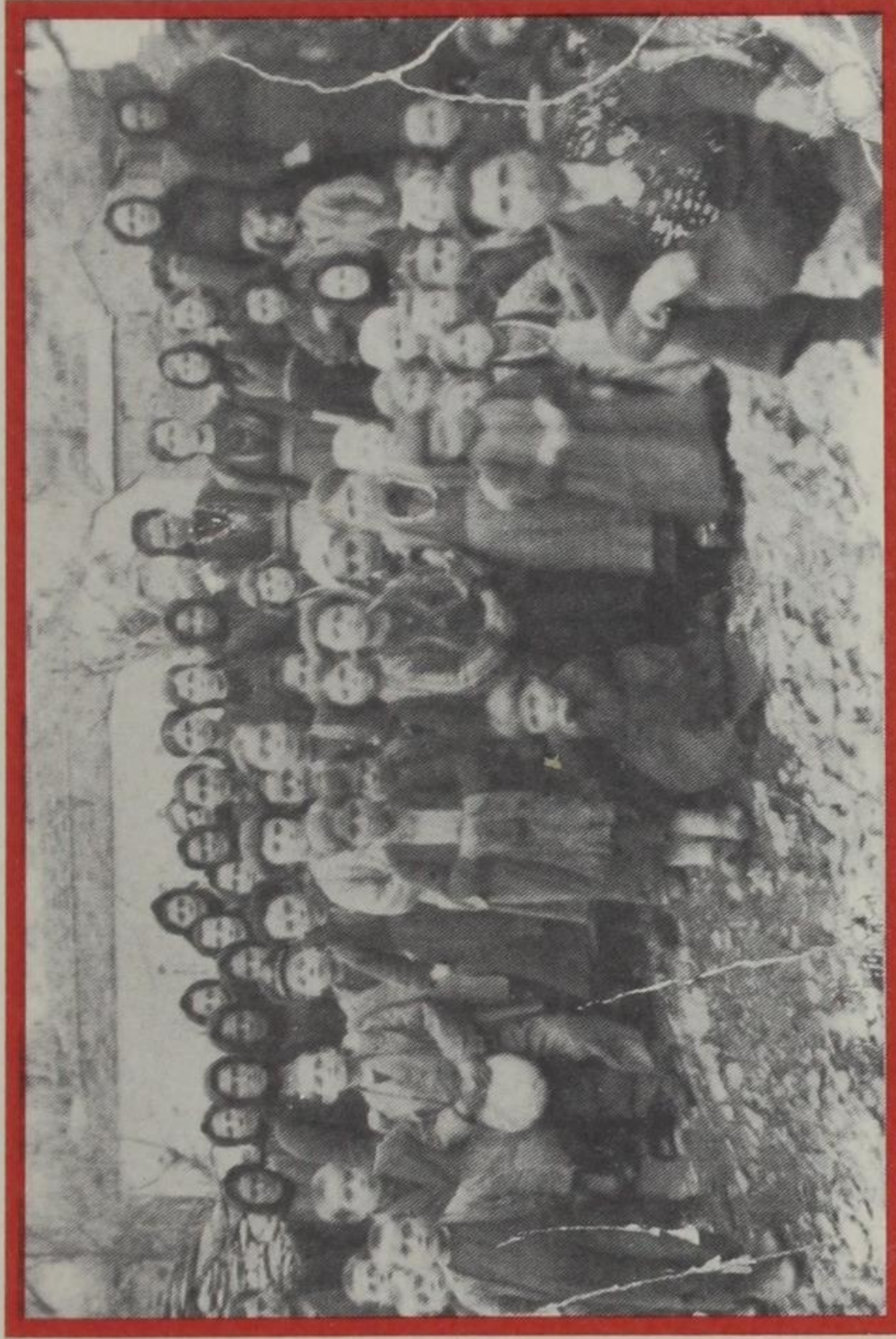
1935. Γυναίκες και παιδιά μπροστά στον 'Αη-Γιώργη.

Μια νεώτερη από μένα γυναίκα, γέννησε στο κατώι, δίπλα στα κατσίκια και τον γάιδαρο. Τανυτόταν όρθια, κρατώντας τ' αυτιά του ώσπου γέννησε το τέταρτο παιδί της. Ήταν τυλιγμένο σε πάνα κι ο κόσμος πίστευε πως θα ήταν πολύ τυχερό. Την πάνα δεν την πετούσαν όπως το ύστερο αλλά την στέγγωναν, τη φύλαγαν στο σεντούκι για να τη βάλουν αργότερα στο χαίμαλι του παιδιού μαζί με τον σφαλό για να μην ματιάζεται.