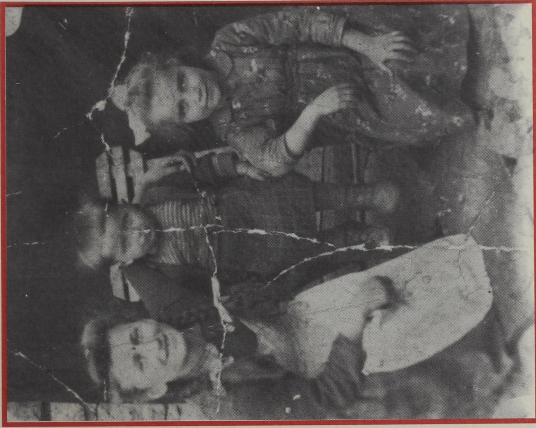
1950. Η Μελλομένη, η Ελευθερία και η Ευτυχία.