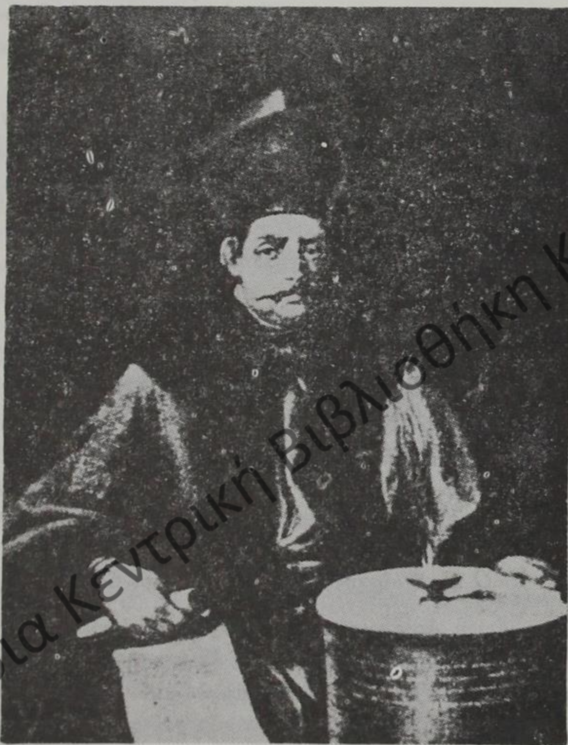
Προσωπογραφία του Παναγιώτη Χατζηνίκου (1709—1796)

γ) Τò γεγονός ότι έξω άπό τά Γιάννινα, ό Π. Χατζηνίκου, άφησε και στήν Κόνιτσα κληροδοτήματα, όπως θά δοϋμε παρακάτω (όπως κι ό Ζώης Κα-