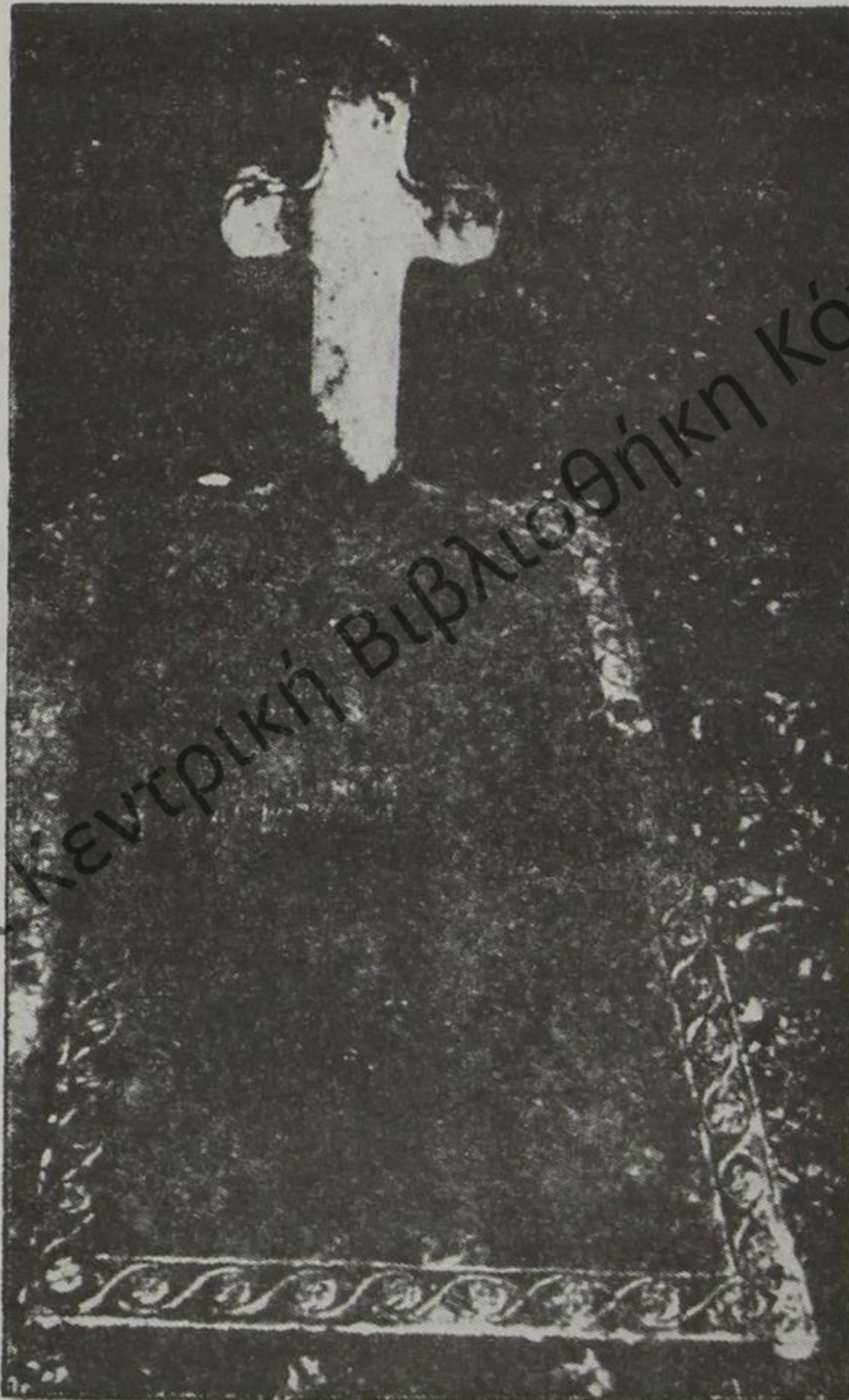
Ὁ τάφος τοῦ Παναγιώτη Χατζηνίκου στὸ Μπρασόβ.

Ἐκ τῶν γράμματα τῶν Κονιτσιωτῶν ποῦ καταχωρίσαμε στὴν ἀρχὴ τοῦ παρόντος, μαθαίνουμε ὅτι ὁ Παναγιώτης Χατζηνίκου εἶχε καταθέσει στὸ Ὀρφανοτροφεῖο τῆς Μόσχας 16.000 ρούβλια μὲ τὸ ὑπ' ἀριθμ. 4356 μπιλλιέτο. Καί