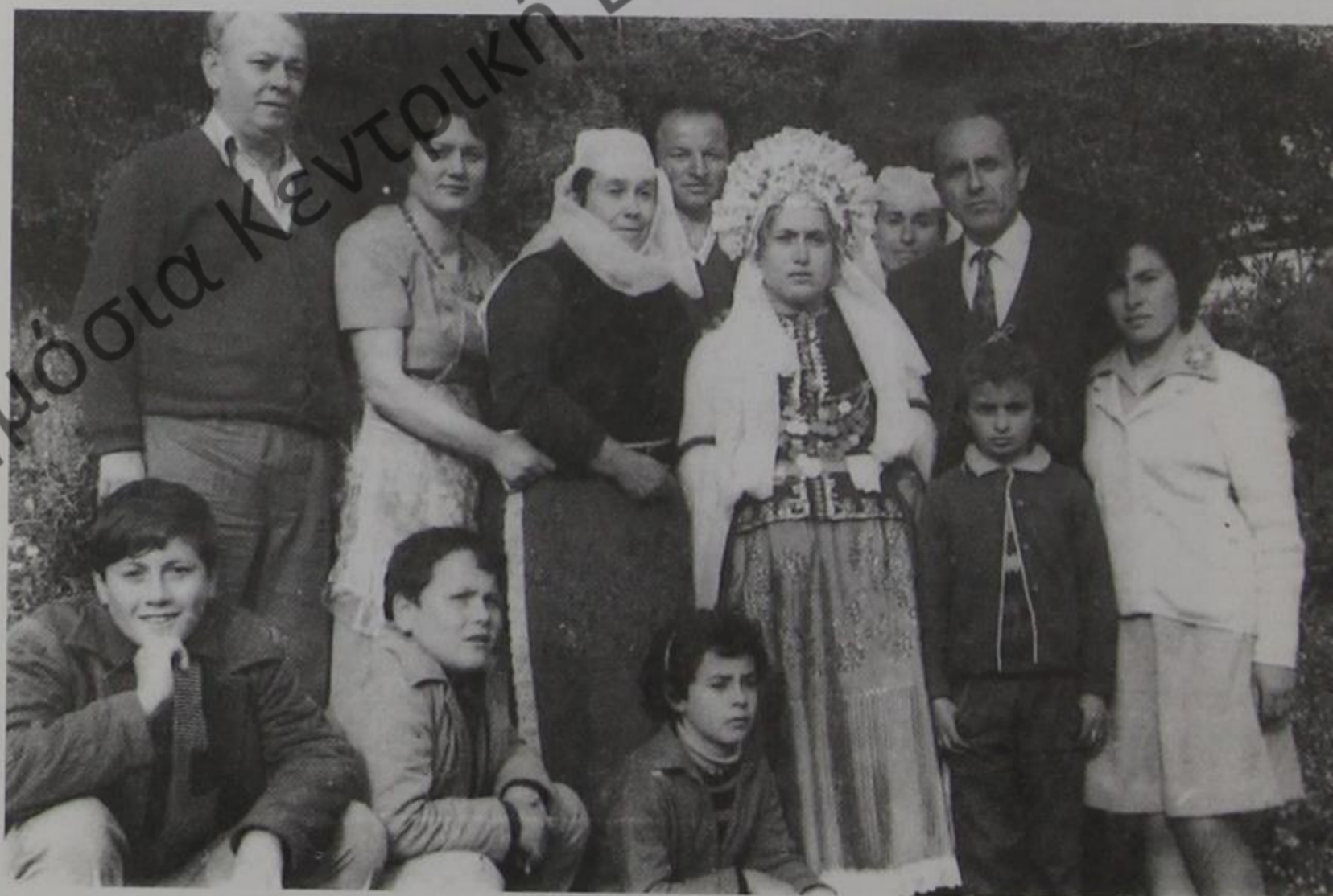
Γάμοι στη Δερόπολη. Οικογενειακό ενθύμιο.