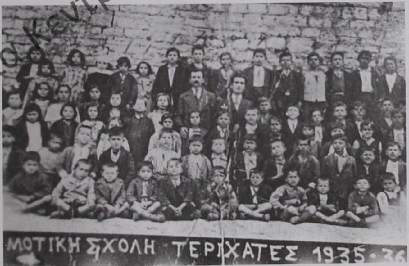
Δημοτικό σχολείο ΤΕΡΙΑΧΑΤΙΟΥ 1935-36.