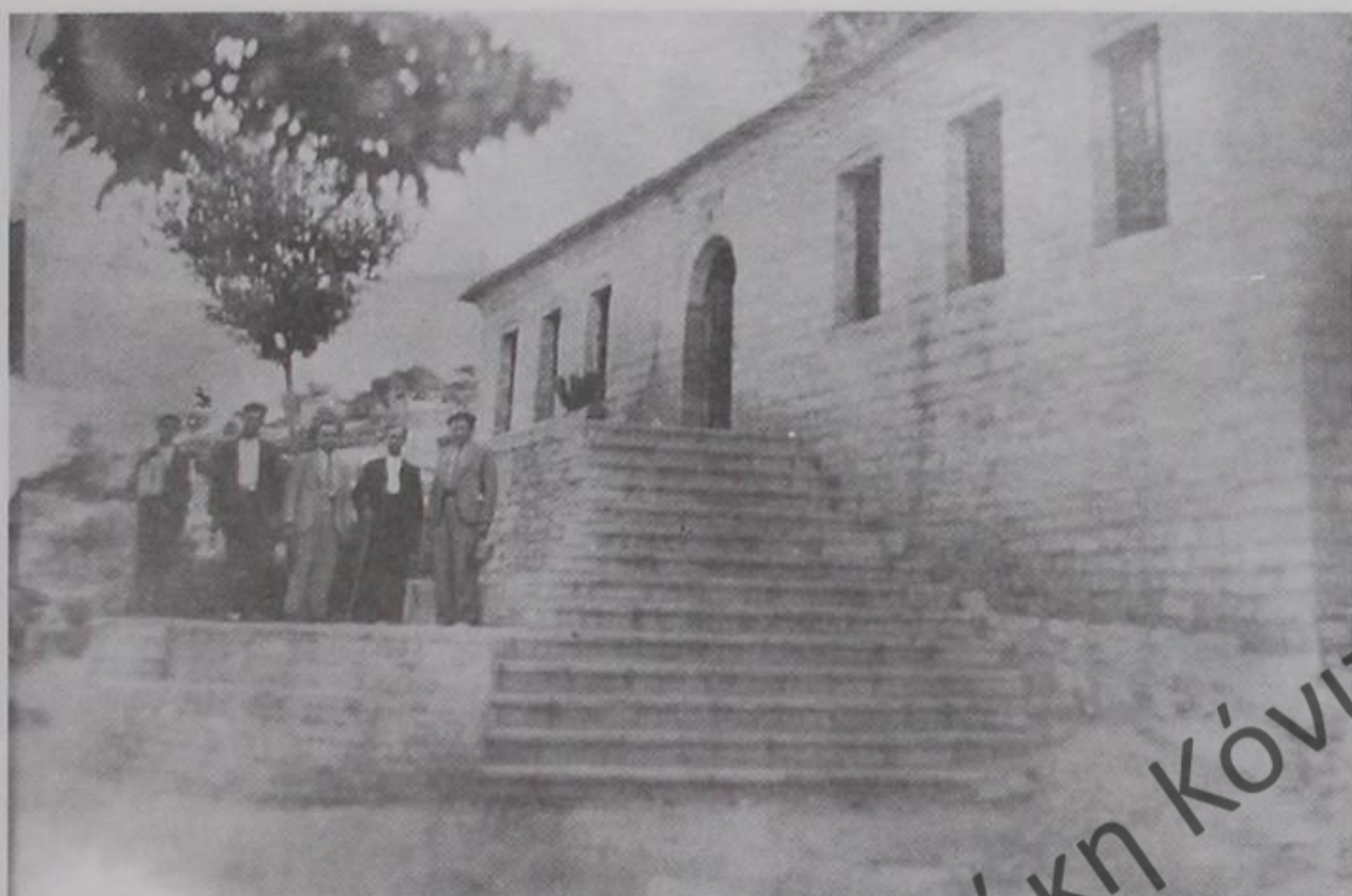
Δημοτικό Σχολείο. Γράψης Δρόπολης. Από δεξιά: Μίχης Πάτσης δάσκαλος, Γιώργος Λούτσης πρόεδρος κοινότητας, Αλέξανδρος Βυαγγελίδης δάσκαλος.