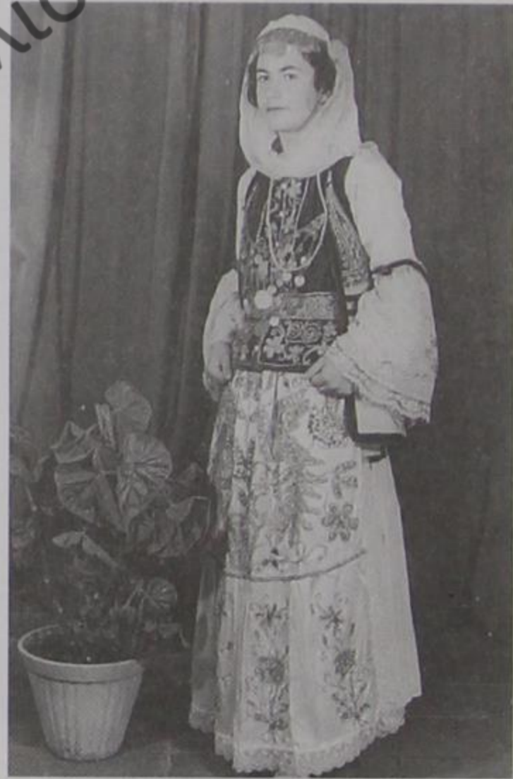
Κοπέλες απ' το χωριό Δερβιτσιάνι της Δερόπολης ντυμένες με παραδοσιακές στολές (δροπολίτικα).