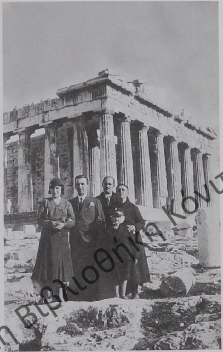
1934. Δελβινιώτες σε εκδρομή στην Ακρόπολη.