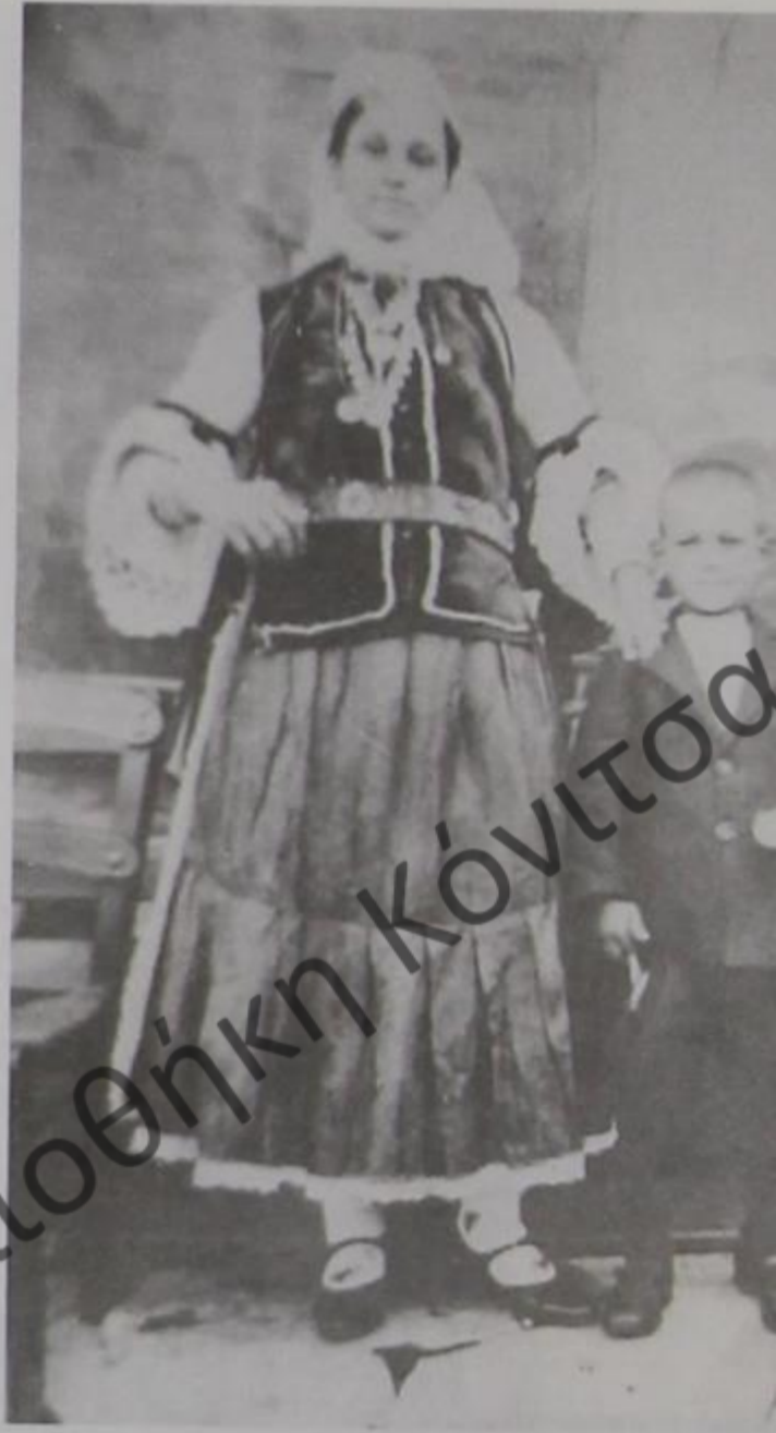
Γράψη Δρόπολης, δεκαετία 1940.