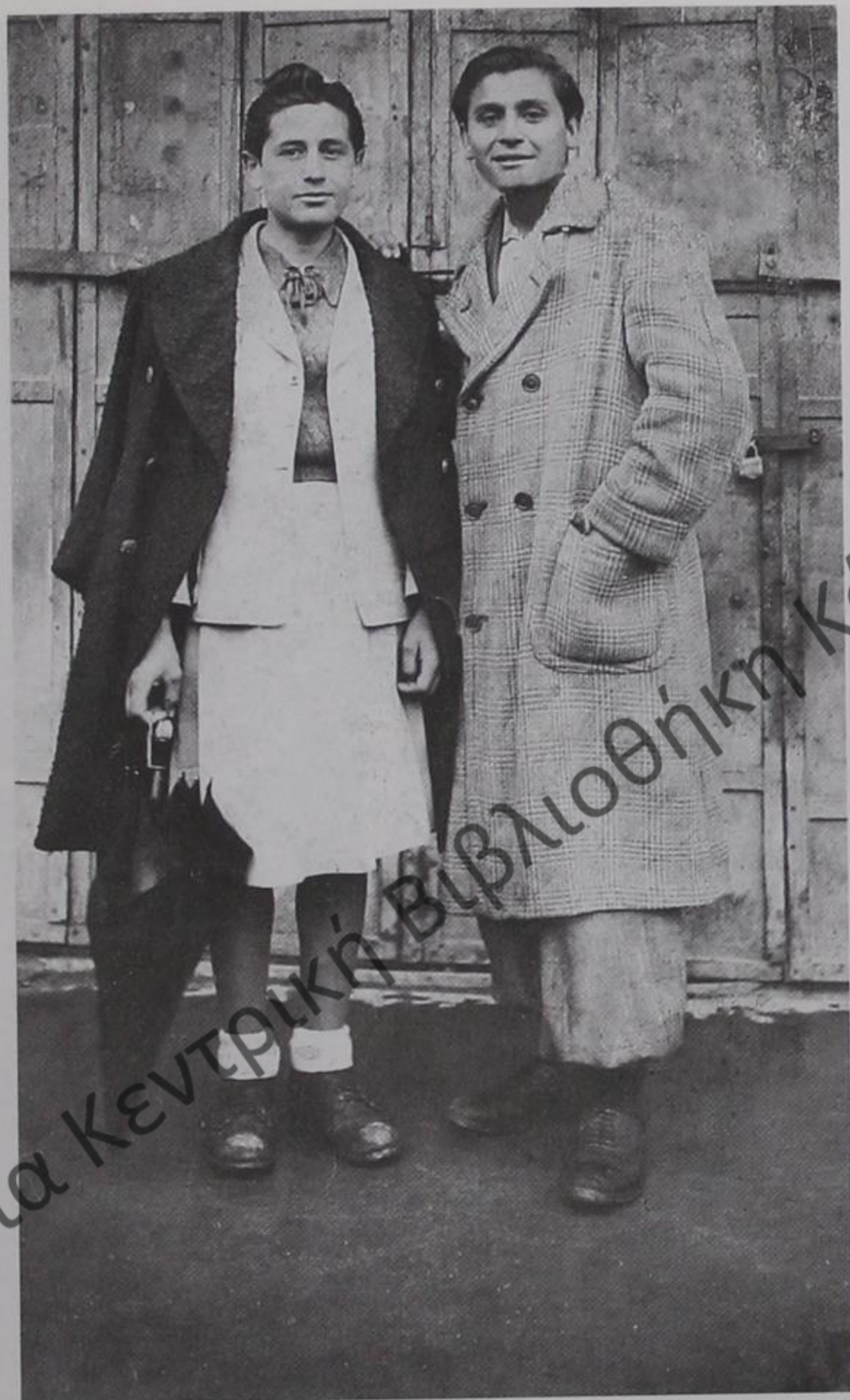
Νεαροί δελβινιώτες μεταμφιεσμένοι στο Καρναβάλι του Δελβίνου 1935.