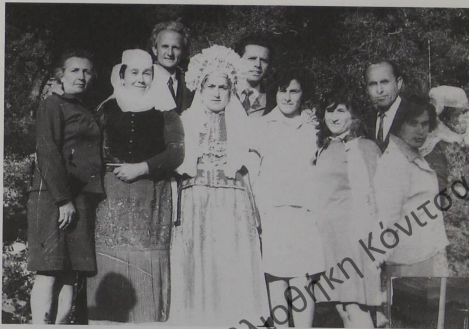
Δεροπολίτισα νύφη ντυμένη παραδοσιακή φορεσιά.