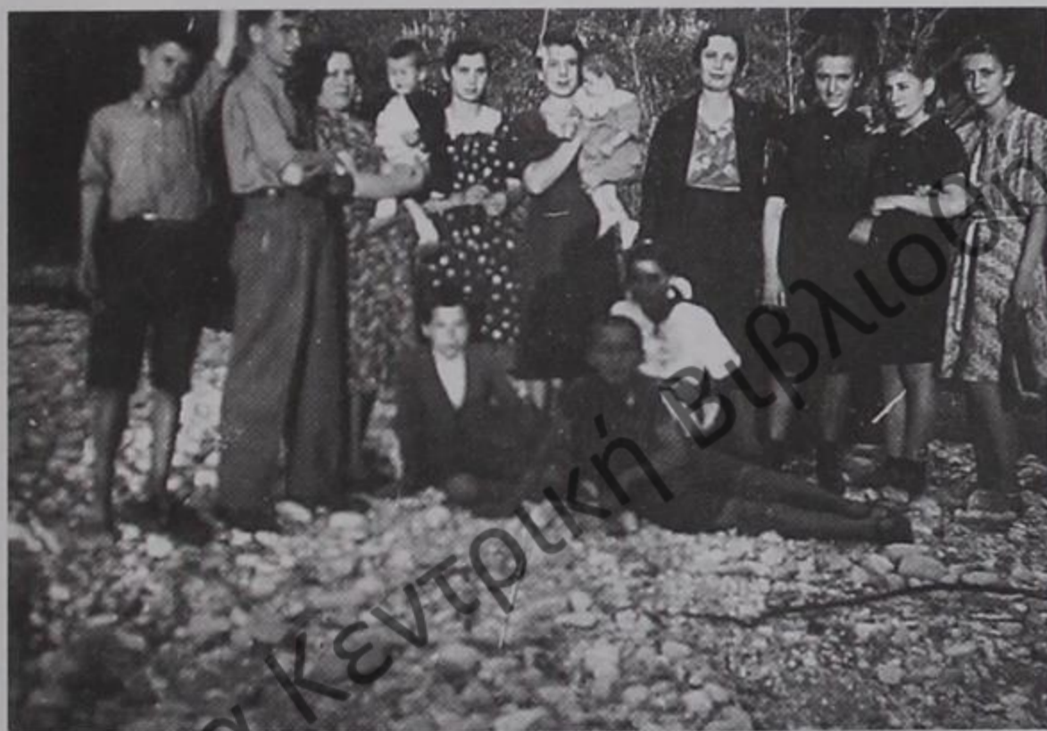
Εκδρομή στα μπο- στάνια. Οικογένειες δελβινιωτών 1940.