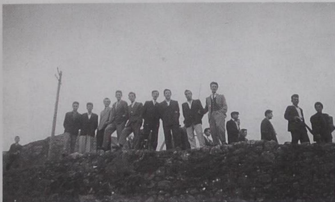
Εκδρομή στο κάστρο του Δελβίνου 1939