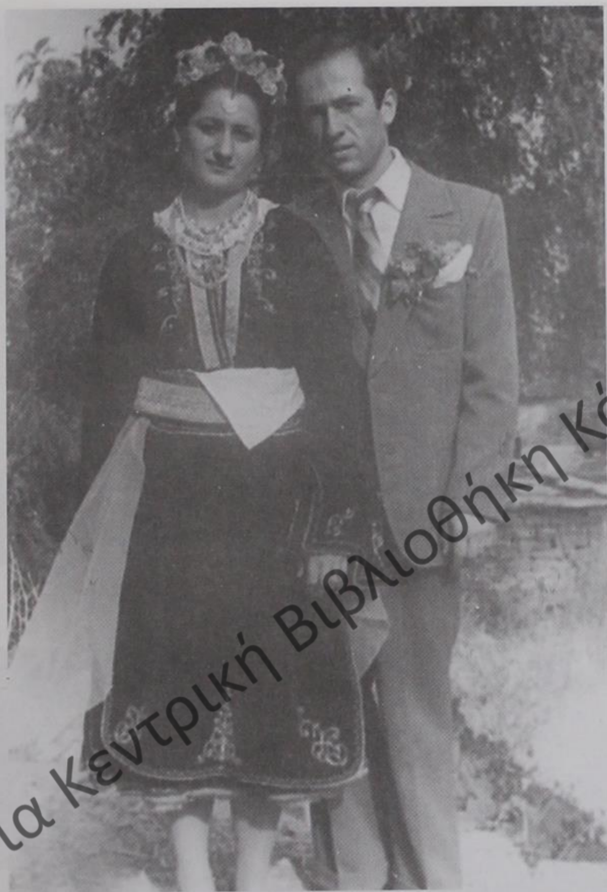
Γαμπρός και νύφη απ' το Πωγώνι, ντυμένη με παραδοσιακή φορεσιά.