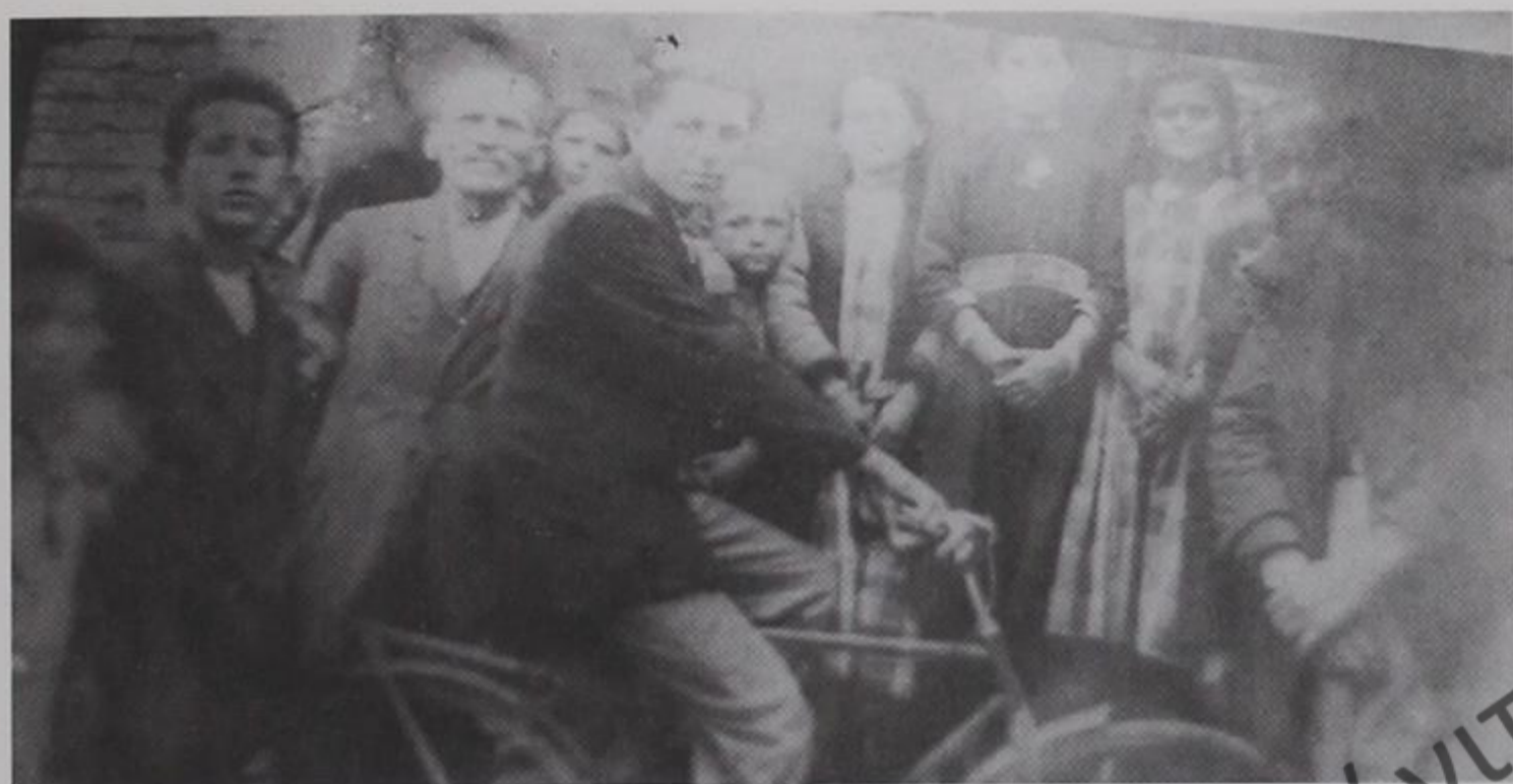
Γράψη Δρόπολης δεκαετία 1930.