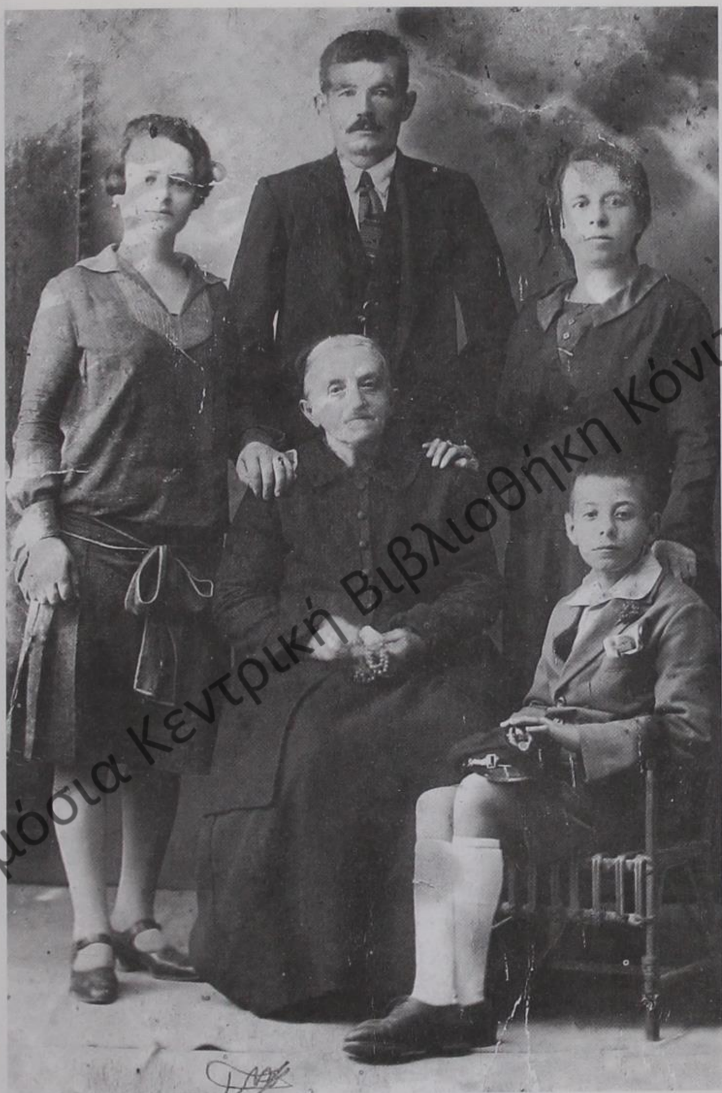
Δελβινιώτες, παραδοσιακή οικογένεια στη δεκαετία του '20.