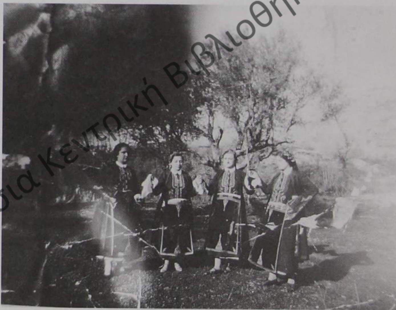
Κορίτσια Δρόβιανης Δελβίνου 1930.