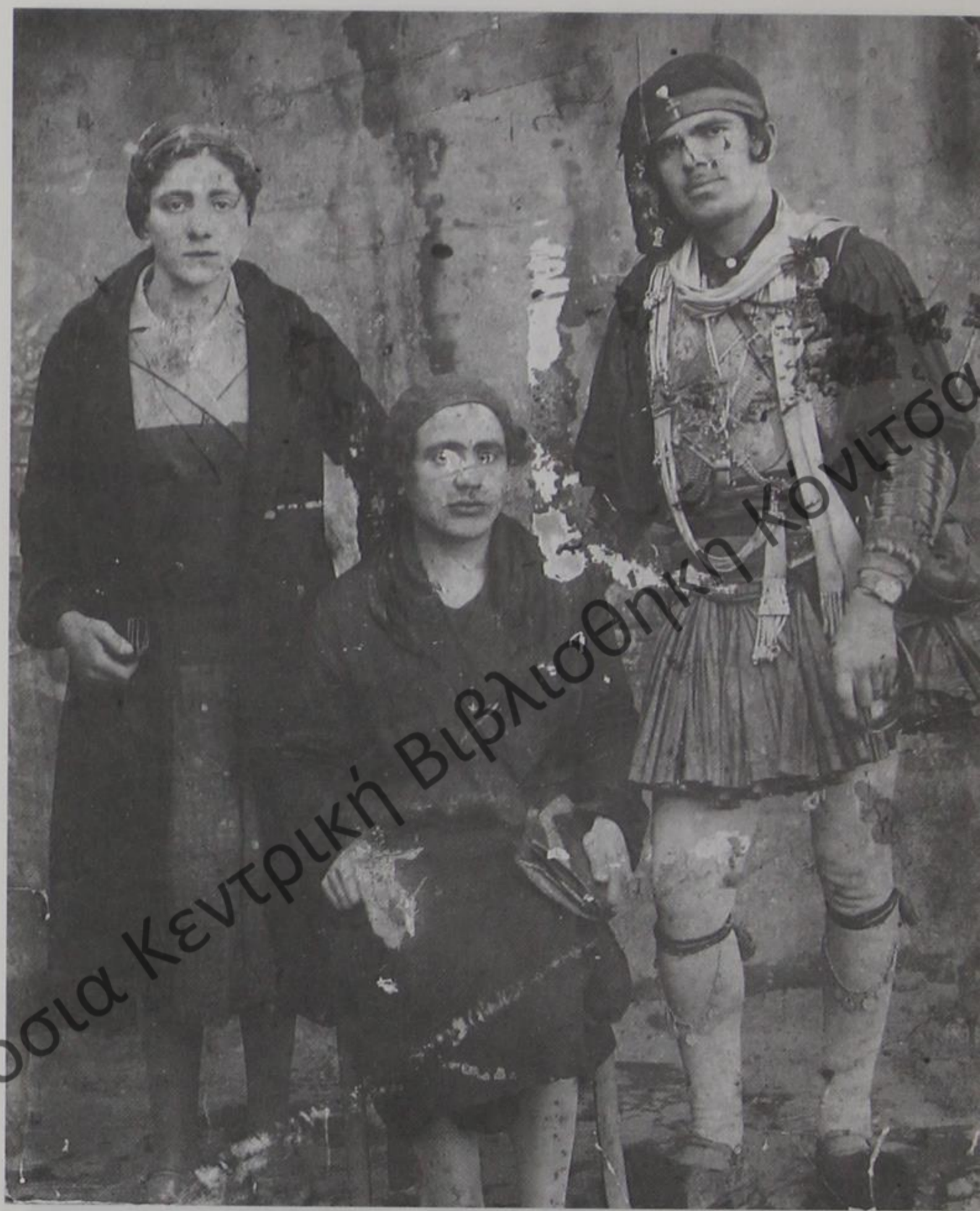
Δελβινιώτες μεταμφιεσμένοι σε καρναβάλι στη δεκαετία του '30.