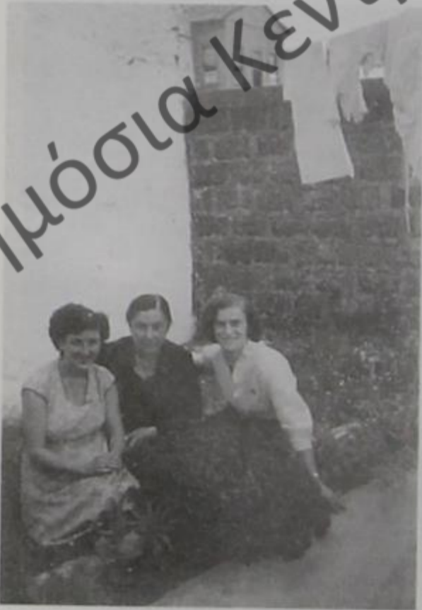
Σπίτι στη συνοικία της Λάκας του Δελβίνου, ενθύμιο 1962.