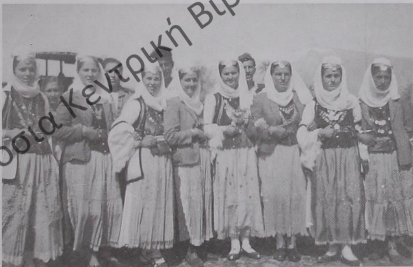
Γράψη Δρόπολης 1956-57.