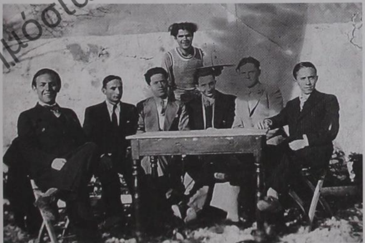
Μια παρέα δελβι- νώτες στα 1930 σε καφενείο του Δελβίνου.