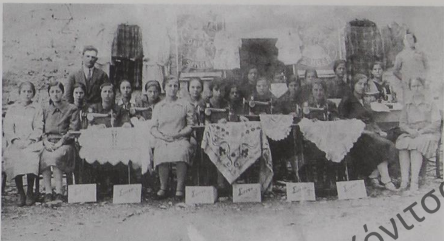
Δρόβιανη Δελβίνου. Φροντιστήριο Ραπτικής (δεκαετία 1920-1930).