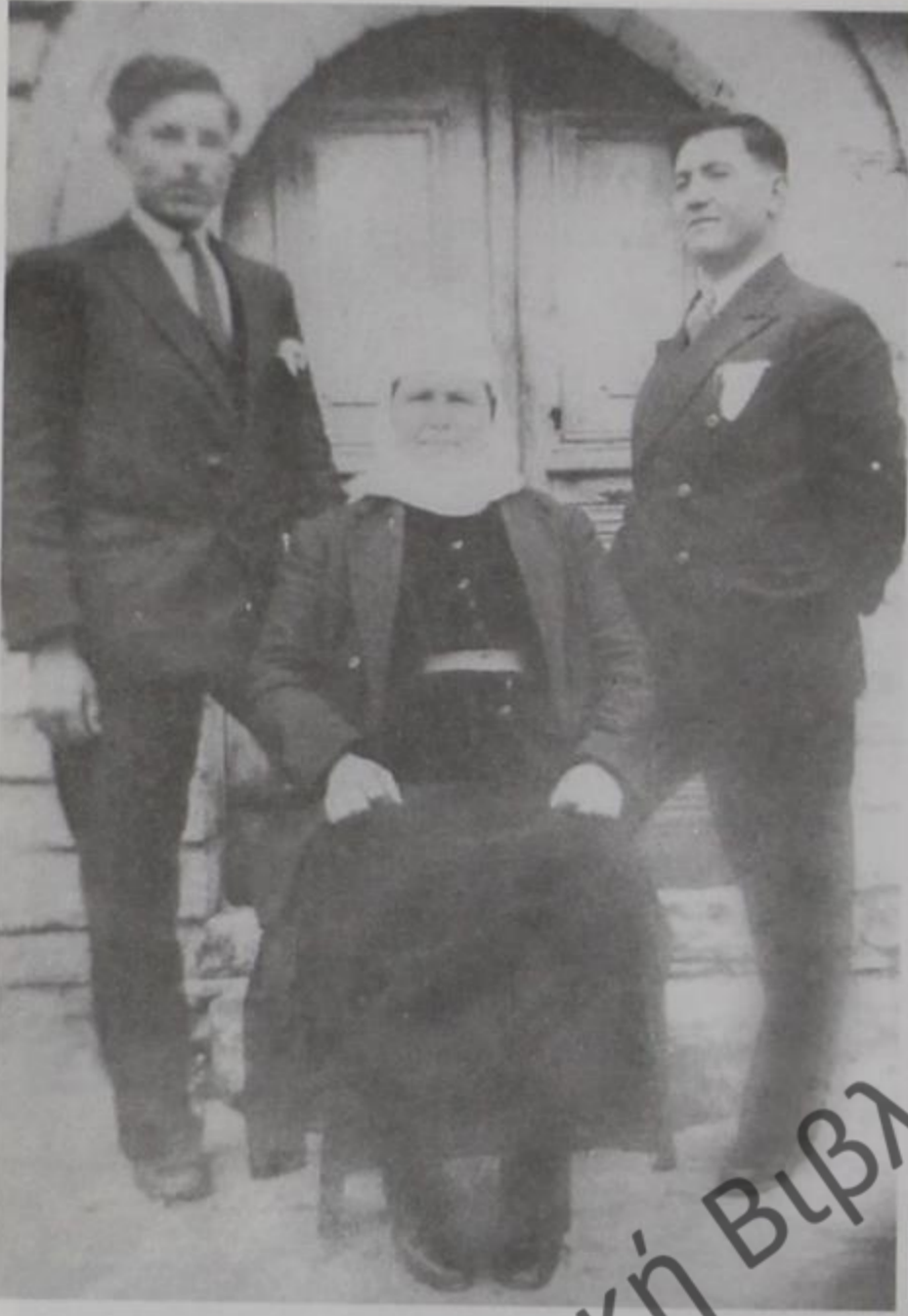
Γράψη Δρόπολης, δεκαετία 1930.