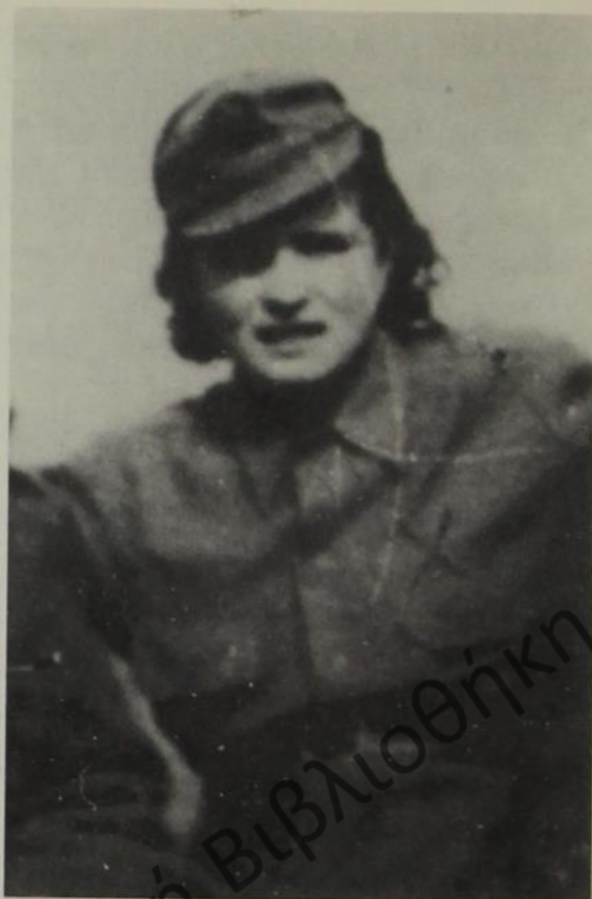
Βέργω Σωτηριάδου. Η πρώτη αντάρτισσα από τη Δρόπολη. Διακρίθηκε σε πολλές μάχες.

σία γινόταν τους τελευταίους μήνες του έτους ή τους πρώτους της επόμενης χρονιάς.