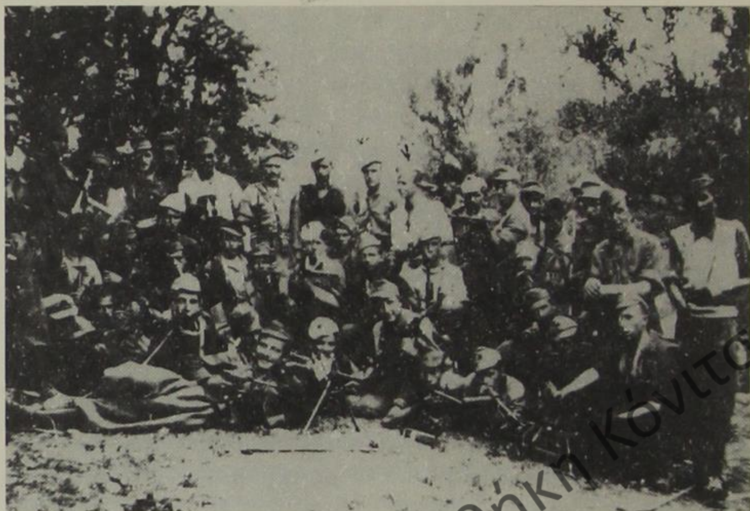
Αντάρτες του 2ου τάγματος της Ελληνικής Μειονότητας «Παντελής Μπότσαρης».

Την Άνοιξη του 1944 σ' όλα τα χωριά της Πάνω Δρόπολης τα σχολεία λειτούργησαν κανονικά. Σε 15 σχολεία φοιτούσαν 509 αγόρια και 324 κορίτσια. Στα σχολεία εργάζονταν 25 δάσκαλοι. Όλα τα παιδιά είχαν την οργάνωσή τους, τα αετόπουλα, και συνεργάζονταν με τα 600 μέλη της Αντιφασιστικής Νεολαίας. Στο σχολείο Γεργουτσατίου φοιτούσαν 75 μαθητές, 55 αγόρια και 20 κορίτσια 1 .