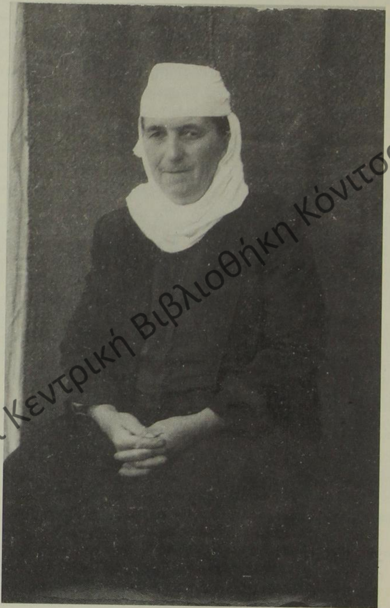
Μάνα Δροπολίτισσα με καθημερινή ενδυμασία.