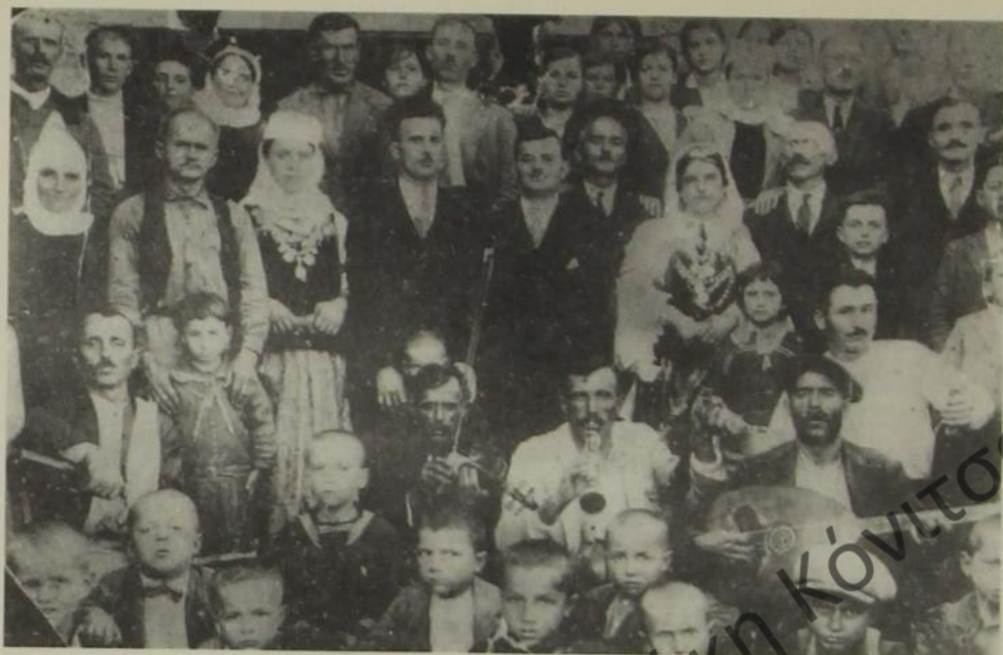
Αναμνηστική φωτογραφία από γάμο στο Βουλιαράτι, τέλη της δεκαετίας του 1920.

Ξανάνοιξαν τις πύλες τους την 1η Σεπτεμβρίου 1935.