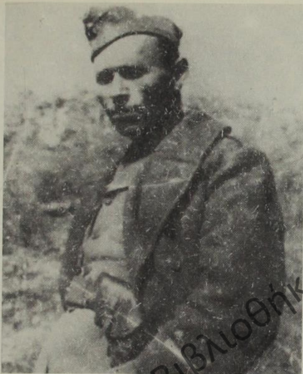
Βασίλης Δαλιάνης, ο γνωστός καπετάνιος. Διοικητής του τάγματος «Θανάσης Ζήκος».

Οι κάτοικοι όλων αυτών των περιοχών απαλλάχτηκαν από το βραχνά των κατακτητών και οργάνωσαν τη ζωή τους, σύμφωνα με τις αρχές του Εθνικοαπελευθερωτικού Αγώνα.