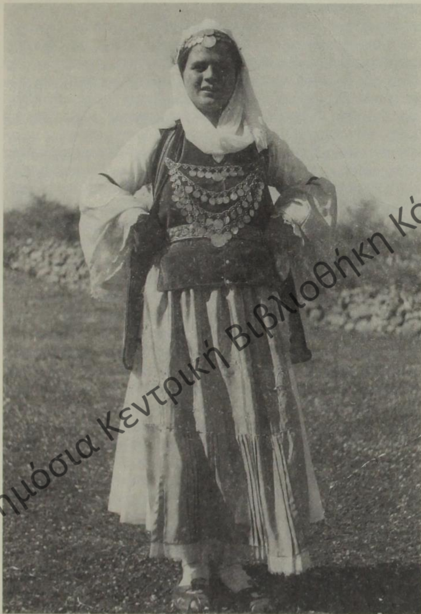
Δροπολίτισσα με νυφική στολή