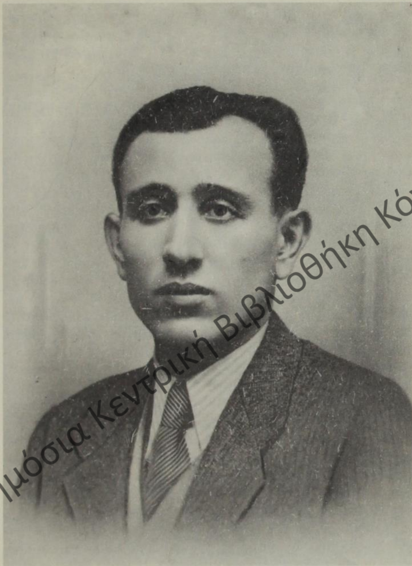
Θανάσης Ζήκος. Ο πρωτομάρτυρας της Ελληνικής Μειονότητας στον Απελευθερωτικό Αγώνα της Αλβανίας.