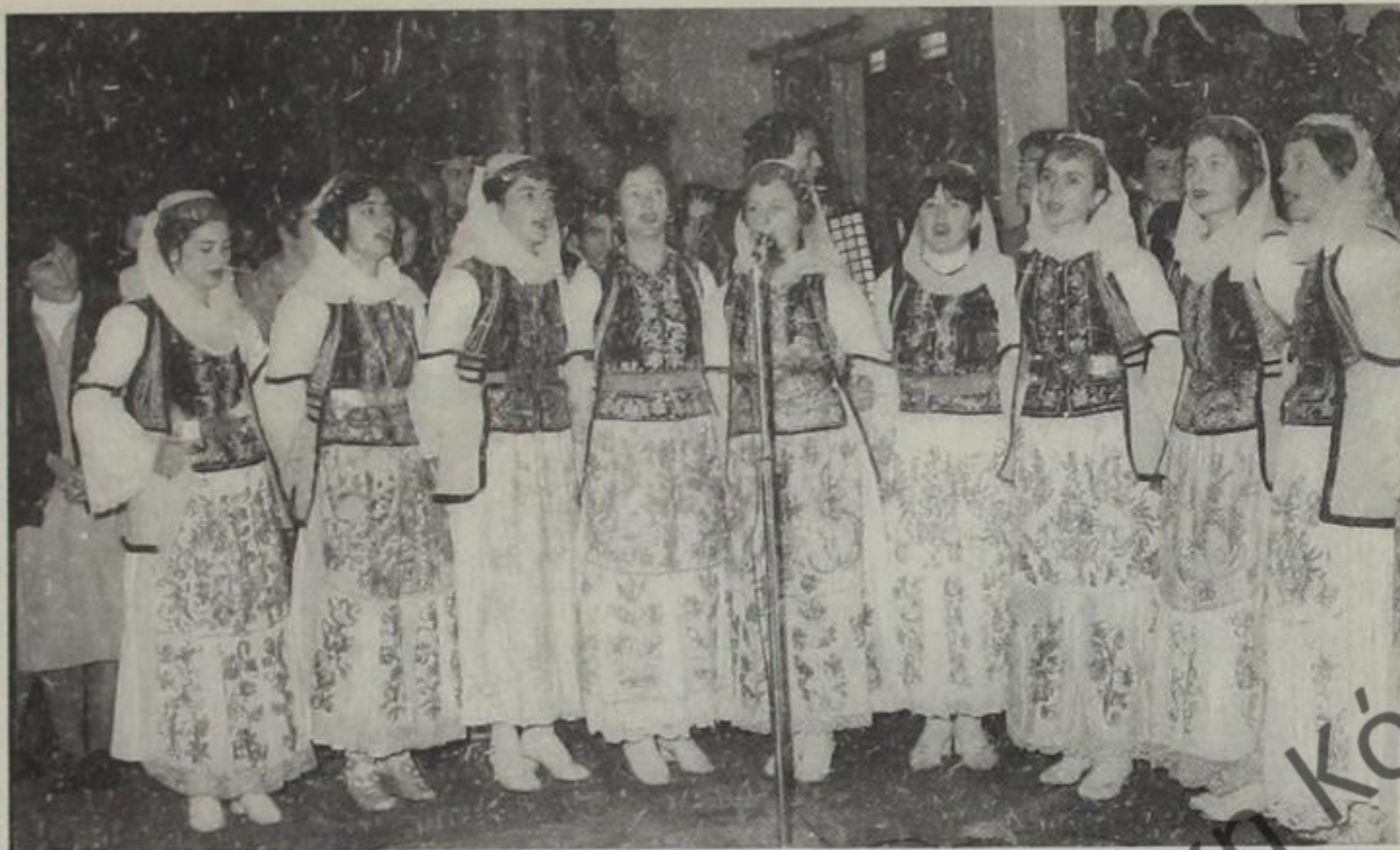
Γυναίκες της Δρόπολης, με τοπικές ενδυμασίες, σέρονουν το χορό.

λον. Εκτός αυτών ο κολίγος του Βούρκου δεν κατείχε ούτε το οικόπεδο όπου είχε χτίσει το σπίτι του ή πιο σωστά να πούμε την καλύβα του. Του απαγορευόταν, επίσης, να φυτέψει οπωροφόρα δέντρα στον αυλόγυρο του σπιτιού του. Εάν δεν υπάκουε στις απαιτήσεις του τσιφλικά και στους δρακόντειους νόμους αυτού, ο ιδιοκτήτης τον έδιωχνε από το σπίτι και του έπαιρνε τη γη 1 .