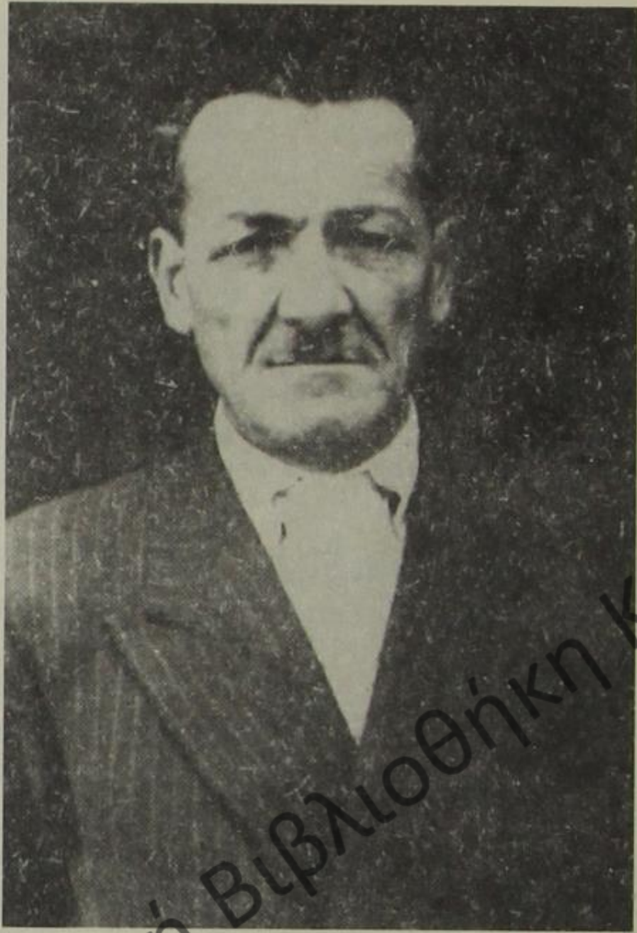
Παναγιώτης Πάνου. Αγωνιστική μορφή και πρώτος διοικητής του Ιου τάγματος «Θανάσης Ζήκος»

Στο χώρο της Εθνικής Ελληνικής Μειονότητας δεν υπήρχε κανένα συγκεκριμένο πανμειονωτικό κέντρο, που θα συντόνιζε και θα καθοδηγούσε τη δράση μιας ενιαίας οργάνωσης. Υπήρχαν, όμως, δραστήρια στελέχη (Πωγώνι, Δρόπολη, Ριζά και Βούρκο), που ήρθαν σ' επαφή με τις προαναφερόμενες οργανώσεις για να ενημερωθούν πώς αντιμετωπίζει η κάθε μια το πρόβλημα της Μειονότητας στην Αλβανία και να γίνει η σωστή επιλογή. Ένας τέτοιος χειρισμός ήταν απαραίτητος, γιατί τα προβλήματα των μειονοτήτων είναι λεπτά, ζητούν σοβαρή αντιμετώπιση, σωστό προσανατολισμό και επιδέξιο χειρισμό για να μην καταστούν πεδίο διενέξεων αντιμαχόμενων παρατάξεων και ξένων επιδιώξεων.