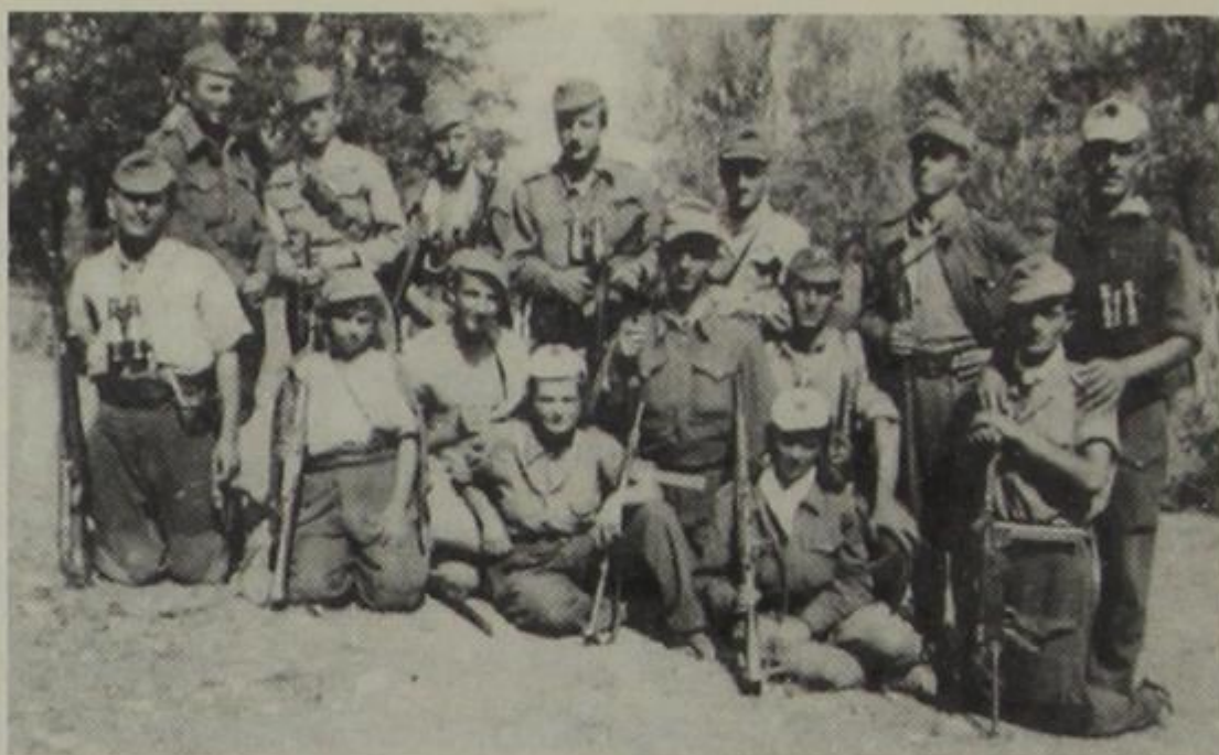
Ομάδα αγωνιστών του τάγματος «Θανάσης Ζήκος»

στις μειονοτικές περιοχές. Τονίστηκε να εντατικοποιηθεί η πολιτική διαφώτιση του λαού, να καλλιεργηθεί το πνεύμα συναδέλφωσης του λαού της Μειονότητας με τον αλβανικό λαό, υπερπηδώντας τις προκαταλήψεις, το διχασμό και τις καχυποψίες του παρελθόντος, να διευρυνθεί η συμμετοχή της Ελληνικής Μειονότητας στον ένοπλο αγώνα κατά των κατακτητών και συνεργατών τους. Αποφασίστηκε σε όσο το δυνατό σύντομο χρονικό διάστημα, εκτός της τσέτας του Πωγωνίου, που ήδη βρισκόταν σε δράση, να σχηματισθούν και τσέτες στη Δρόπολη, στα Ριζά και στο Βούρκο ως ξεχωριστά μειονοτικά αντάρτικα τμήματα.