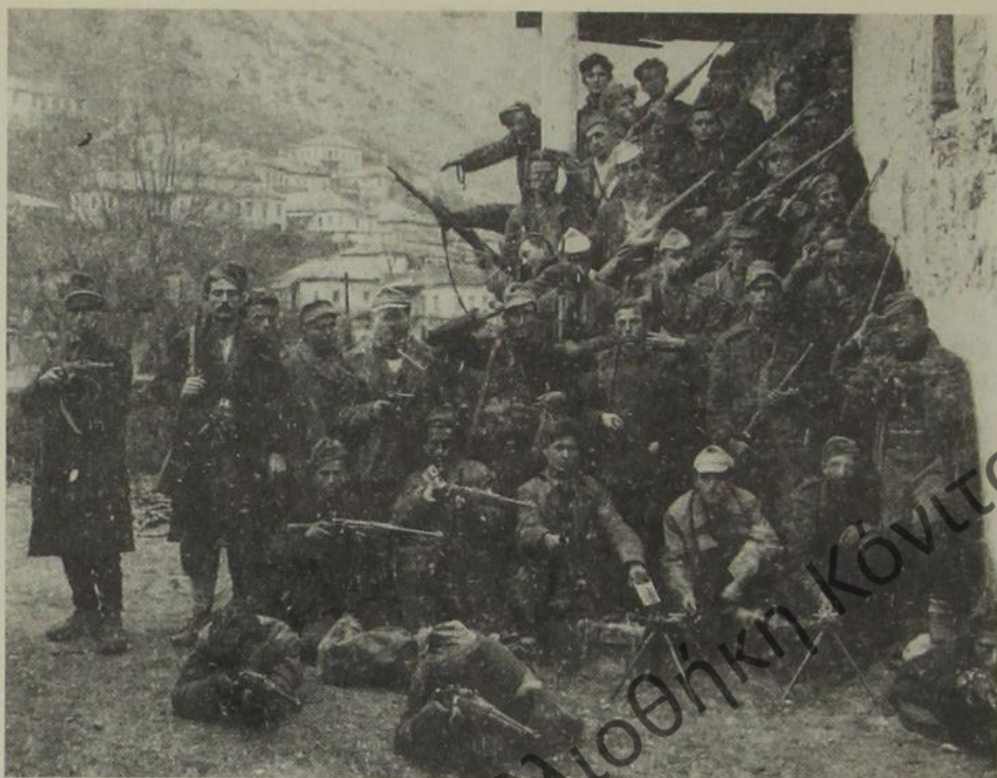
Αντάρτες του 1ου τάγματος της Ελληνικής Μειονότητας «Θανάσης Ζήκος» στο χωριό Σωτήρα.

έρχονταν από όλες τις παρατάξεις, απ' όλα τα κοινωνικά στρώματα και επαγγέλματα, ανεξαρτήτως από τις πολιτικές και ιδεολογικές τοποθετήσεις τους.