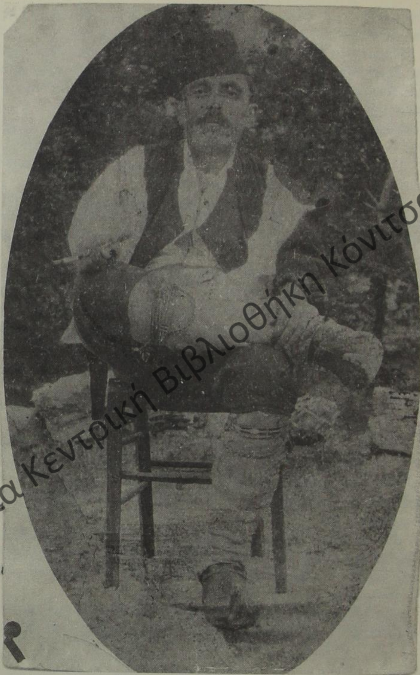
Άντρας με παραδοσιακή στολή της επαρχίας Πωγωνίου (Χλωμό).