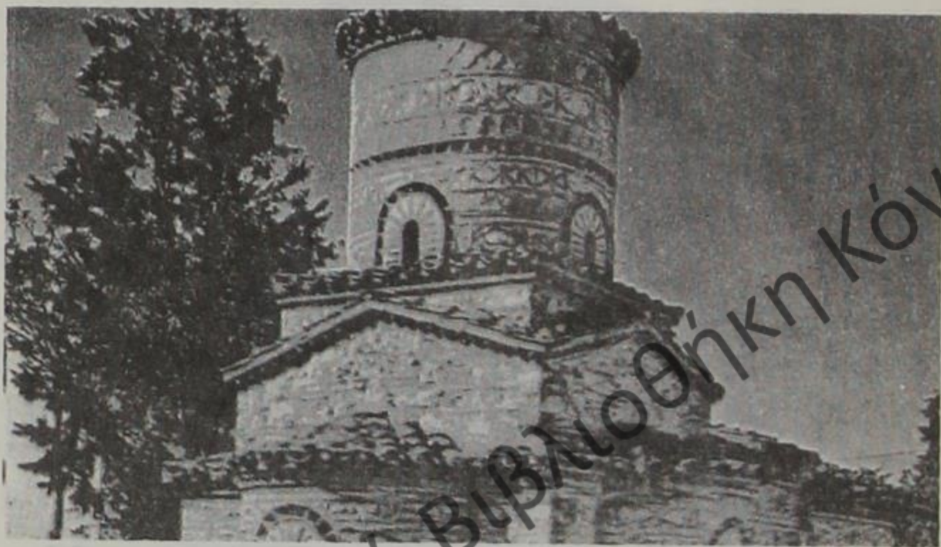
Καστοριά: Η Κουμπελίδικη.

Αυτά ήταν τα ιδανικά και τα πρότυπα του σεπού και μαχητικού αυτού ιεράρχη της Ορθόδοξης Εκκλησίας μας.