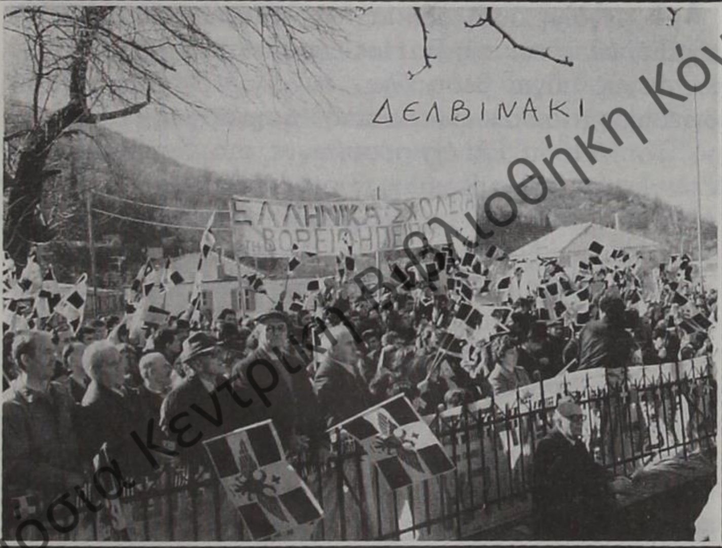
Συγκέντρωση στο Δελβινάκι.