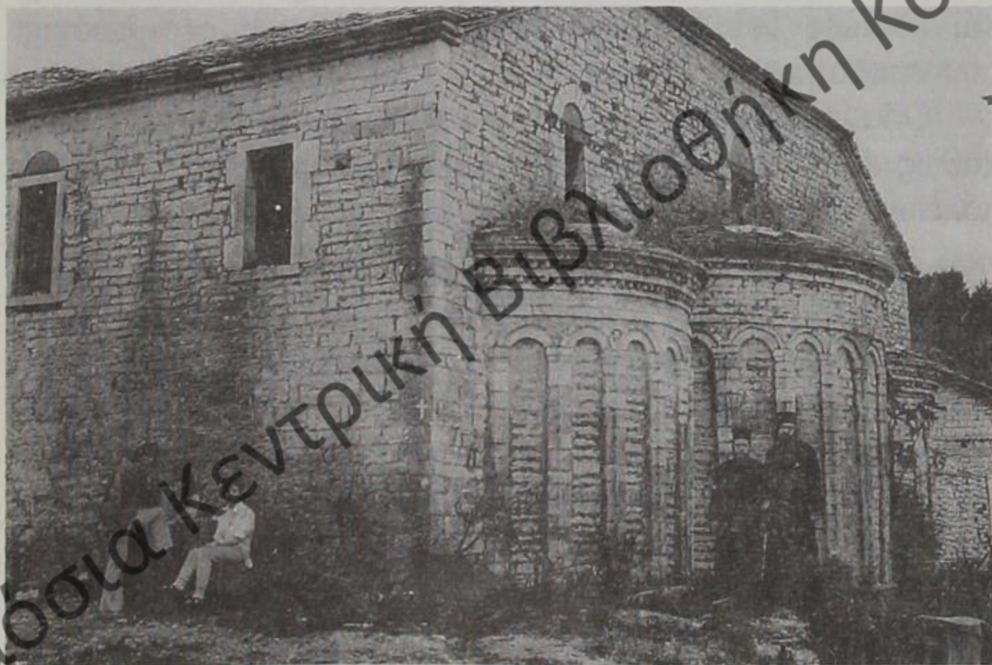
Ιερός Ναός των Παμμεγίστων Ταξιαρχών Αργυροκάστρου (αποθήκη σιδήρου σήμερα)

Την δέ δεύτερη παρουσιάζει ο Ο. Masson καταλήγοντας στο ακόλουθο συμπέρασμα: «Όσον αφορά στις ελληνικές χώρες, τις κοντινές με την Ιλλυρία, όπως η Ήπειρος και η Ακαρνανία, μπορεί κανείς να ισχυρισθεί ότι πράγματι δεν υπέστησαν επίδραση από βορρά, σε πείσμα θεωριών που διατυπώθηκαν με βάση επιφανειακή ερμηνεία τούτου ή εκείνου του ονόματος».