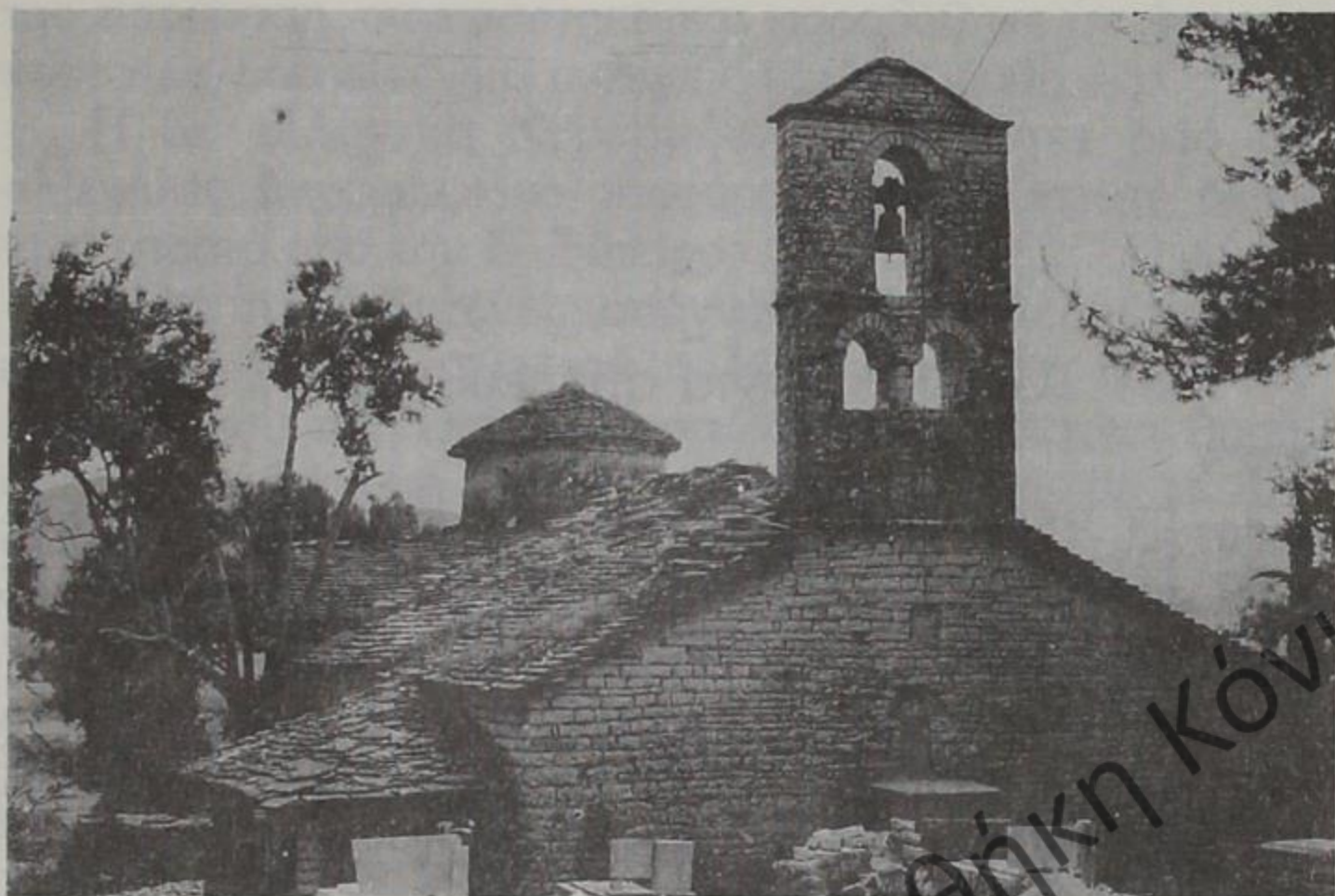
Ιερός Ναός Κοιμήσεως Θεοτόκου Ζερβάτι - Δροπολής

Ηπείρου, τον Ευάγγελο Ζάππα, τον Απόστολο Αρσάκη, τον Χρηστάκη Ζωγράφο και άλλους ευεργέτες, που μαρτυρούν την αλώβητη ελληνική συνείδησή τους σε όποιο σημείο της υψηλίου κι αν έζησαν.