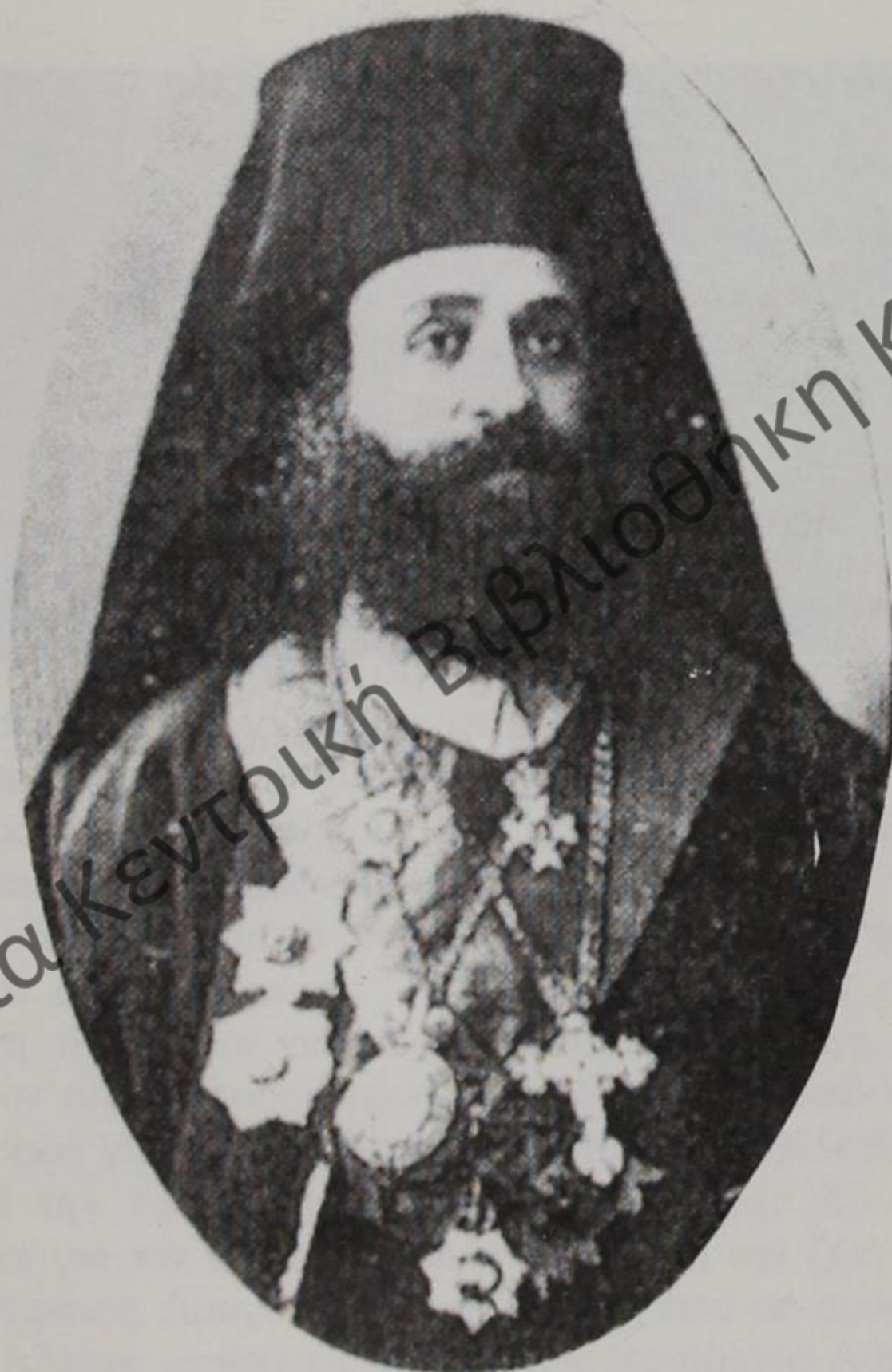
Ἱερέμας Καραβαγγέλης Μητροπολίτης Καστορίας