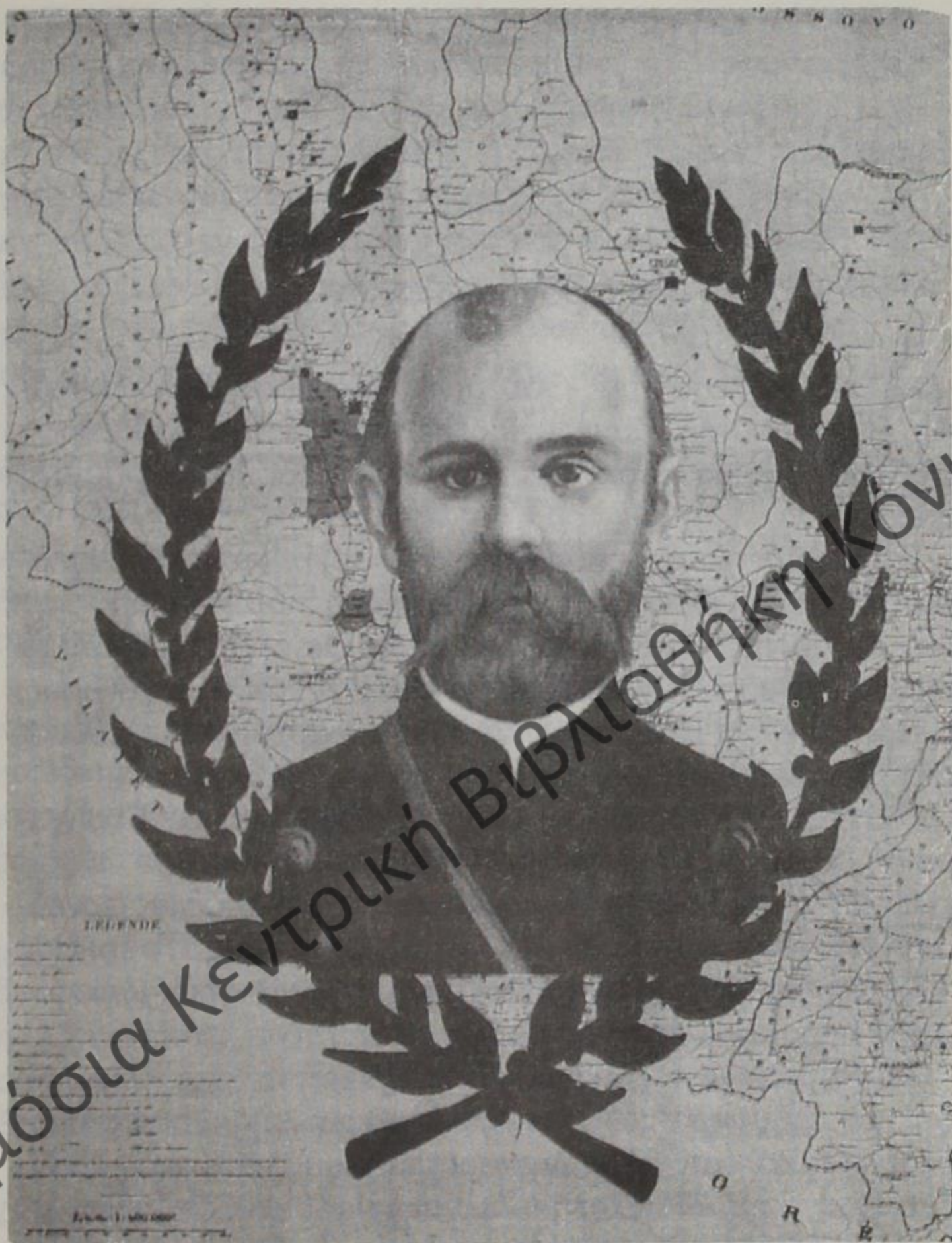
Ο Μακεδονομάχος καπετάν Κώτας