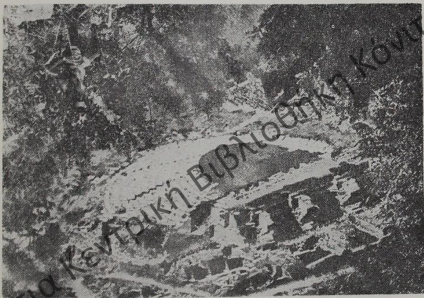
Τὸ θέατρο στὸ Βουθρωτὸ

Θα πρέπει για την ακρίβεια τῶν ὄσων ἀκούσαμε να ἀναφέρω πως ὁ ξεναγός μας μᾶς εἶπε πως τὸ 1957