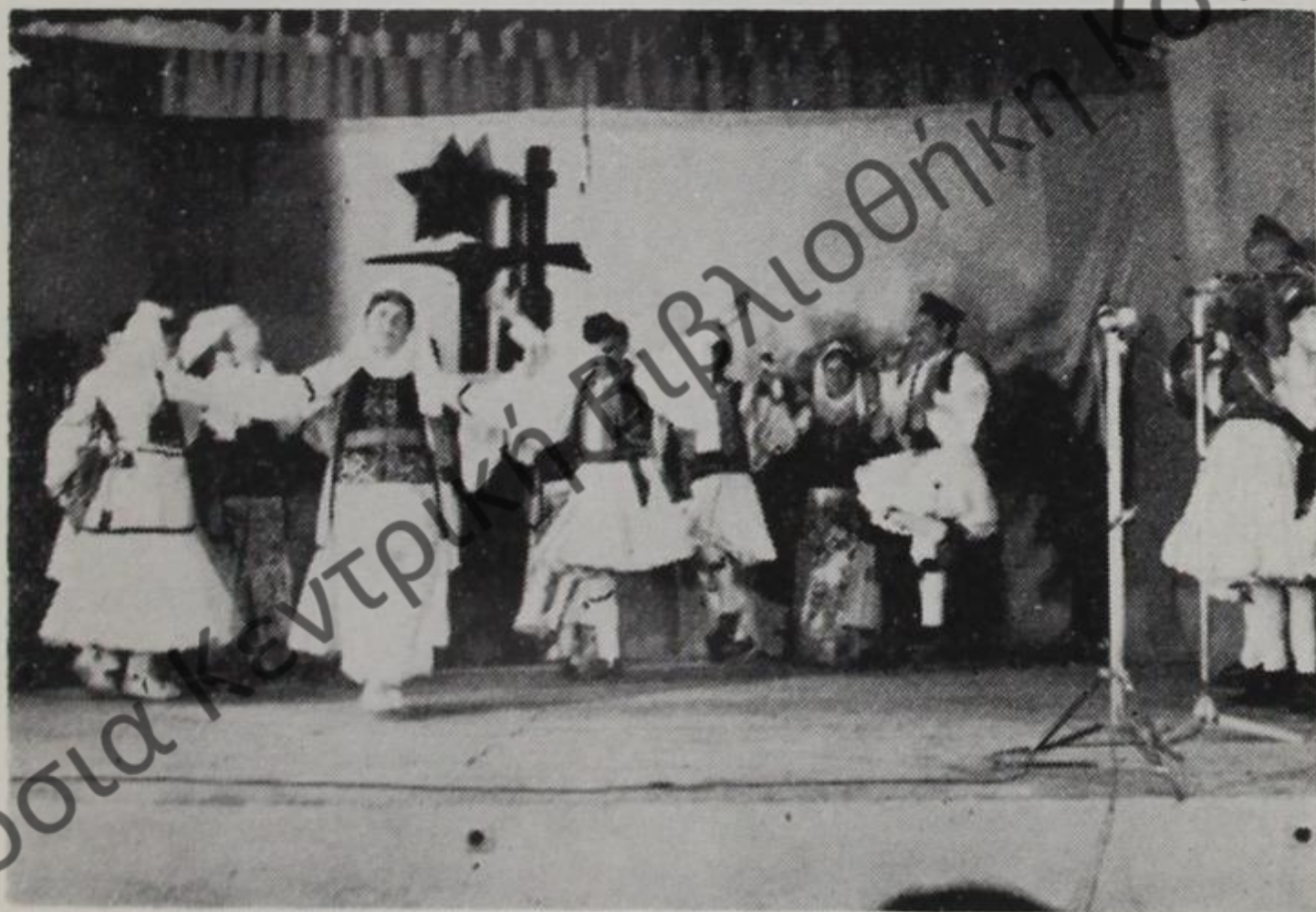
Συγκροτήματα χορευτικὰ τῆς Γράψης χορεύει.