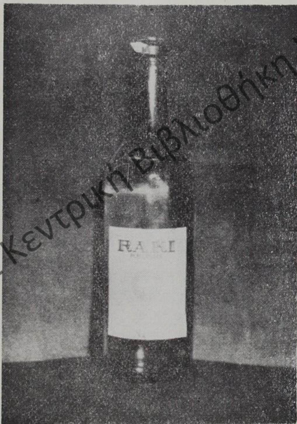
Μπουκάλι μὲ ρακὶ τῆς Ἀλβανίας

τελείωνε κάθε ἐπαρχία τὴν ἐπίδειξίν της, τραγουδοῦσε τὸ τραγούδι τοῦ Χότζα καὶ σηκωνόταν ὄρθιοι ὄλοι οἱ θεαταί, φυσικὰ καὶ ἐμεῖς ποὺ εἴμεθα φιλοξενούμενοι. Τὰ συγκροτήματα εἶχαν ἐλαφρὲς χορογραφίες ἔτσι ποὺ νὰ γίνεται πιὸ ἐνιαῖο καὶ πιὸ κατανοητὸ τὸ σύνολο στὸ τί ἀκριβῶς ἐξέφραζε ὁ χορὸς του. Ὁραιότατα τὰ συγκροτήματα τῆς Μερντίτας, τῆς Τροπόγιας ποὺ τὸ στῦλ ἔμοιαζε κάπως στὸ Ἀνατολίτικο, ἀλλὰ ἀπὸ ὅσα εἶδα