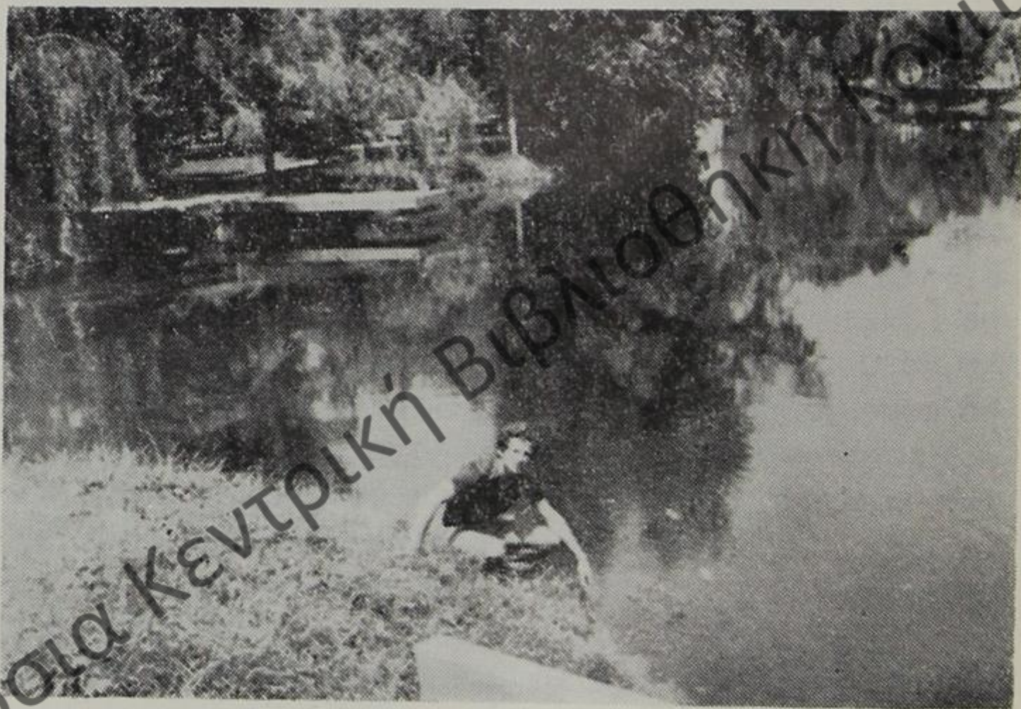
Τὸ πάρκο καὶ ἡ τεχνητὴ λιμνούλα στὸ Πόγραδετς.

Ἐκεῖ περάσαμε τὶς δύο τελευταῖες μέρες καὶ κάναμε τὶς δύο τελευταῖες παραστάσεις μὲ τὸν ἐνθουσια-