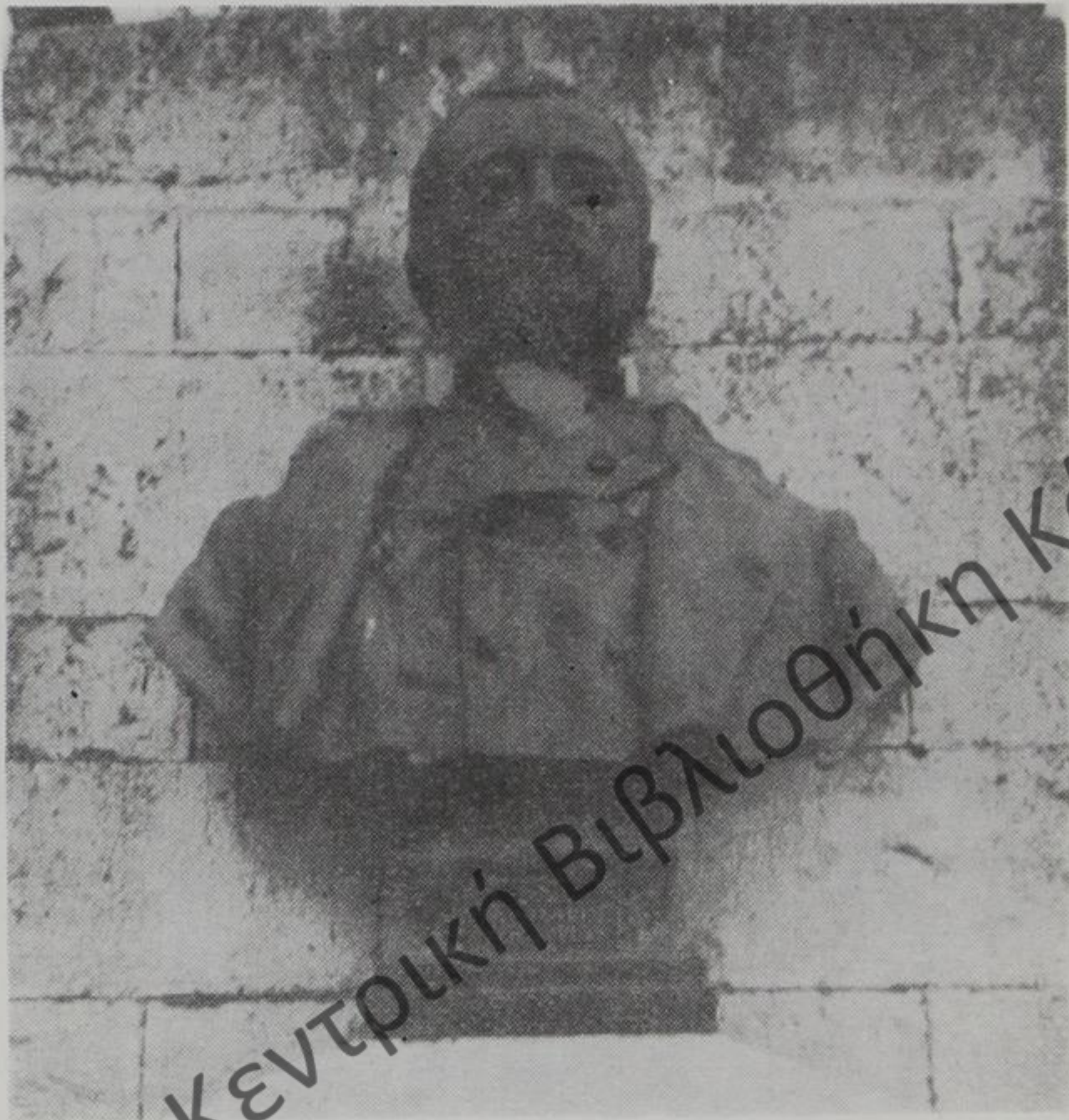
Προτομή του Χρησιτάκη Ζωγράφου στο πάροχο της κεντρικής πλατείας Ιωαννίνων

Φιλογενή και φιλεκπαιδευτικά αισθήματα βρίσκομε και στην ψυχή της συζύγου του και των τέκνων του.