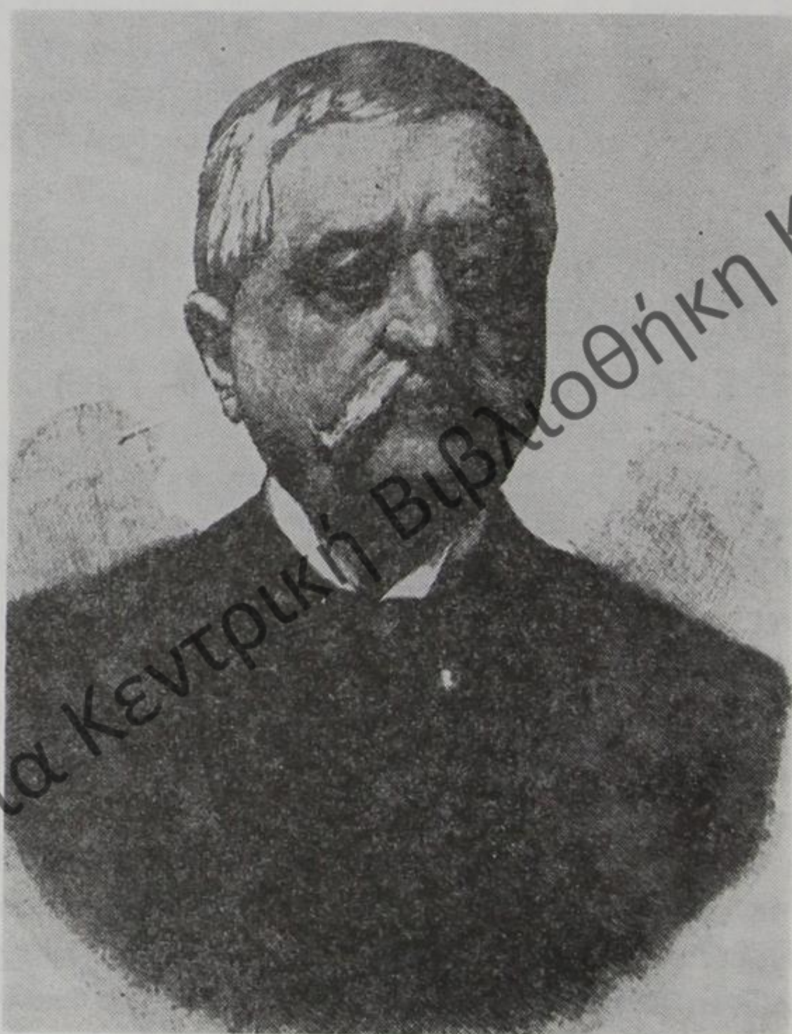
ΧΡΗΣΤΑΚΗΣ ΖΩΓΡΑΦΟΣ (1820—1898) από το Κε- ιστοράτι Αργυροκάστρου, τραπεζίτης στην Κωνσταντινούπο- λη, μεγάλος ευεργέτης της Εκκλησίας και του Έθνους, ιδρυ- τής των Ζωγραφείων Διδασκαλείων.

σταντινούπολη. Δανείζει εμπόρους και επιχειρηματίες και αυτήν ακόμη την τουρκική κυβέρνηση. Συμμετέχει ως μέτοχος στην ίδρυση της γενικής εταιρείας του οθωμανικού κράτους και της εταιρείας των τροχιοδρόμων. Φημίζεται στους κύκλους του επαγγέλματός του για τις οικονομολογικές γνώσεις του και την πλούσια πείρα του. Ορίζεται μέλος της επιτροπής προϋπολογισμού του τουρκικού κράτους και ιδιαίτερος τραπεζίτης του Σουλτάνου Μουράτ Ε'. Όλες αυτές οι εργασίες του προσκομίζουν αρκετά κέρδη και, με το πατρογονικό πνεύμα της οικονομίας, έχει πάντοτε στη διάθεσή του αρκετά χρηματικά κεφάλαια, που του επιτρέπουν να κινείται άγετα στις επιχειρήσεις και να διατηρεί σταθερές πηγές εσόδων 2 .